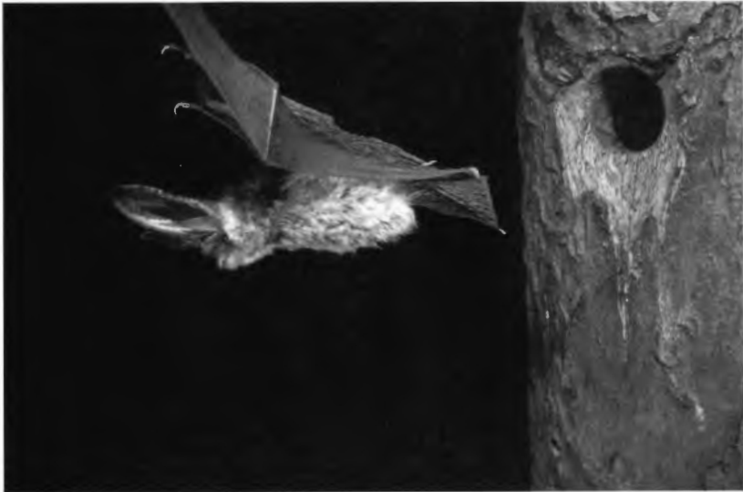
Abb. 2: Braunes Langohr

Der Fortpflanzungsnachweis des Braunen Langohrs ist erfreulich und war auch aufgrund der bekannten weiten Verbreitung im Münsterland und in NRW zu erwarten.