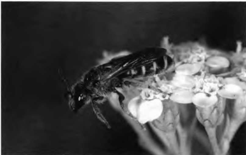
Abb. 2: Die Furchenbiene Halictus simplex konnte 2006 erstmalig in Westfalen festgestellt werden. Sie besiedelt trockene Offenlandbereiche im Diemeltal.

Ein großer Teil der Fundorte ist bei BLEIDORN, LAUTERBACH & VENNE (2001) näher beschrieben.