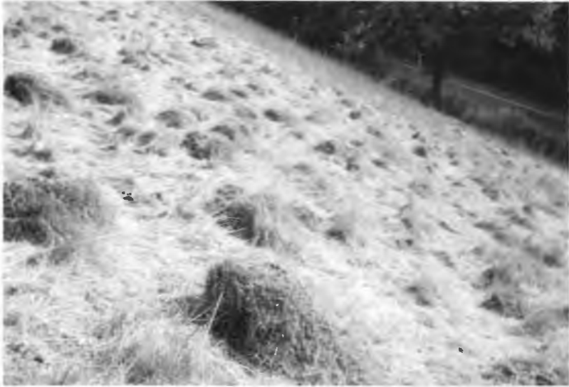
Foto 1: Buckelwiese am Möllenberg (Kreis Lippe)