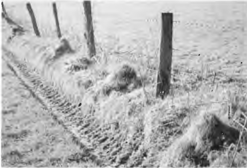
Foto 2: Buckelrain im NSG „Jakobsberg“ in Amshausen (Krs. GT)

Die Vergrasung, die man auf intensiv beweideten Magerrasenflächen beobachten kann, ist hier nicht festzustellen. Der sich ständig wiederholende Verbiss verhindert die Vergrasung und sorgt für eine bessere Durchwärmung der Böden und der Buckeloberfläche.