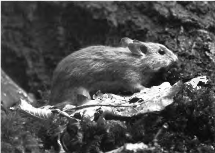
Abb. 1: Gelbhalsmaus ( Apodemus flavicollis )

Um zu untersuchen, ob es darüber hinaus zu einer weiteren Arealausweitung gekommen ist, wurden für diese Arbeit Gewöllaufsammlungen aus den nördlich und westlich angrenzenden Gebieten analysiert. Die Ergebnisse und weitere verfügbare Daten sind in einer neuen Verbreitungskarte dargestellt.