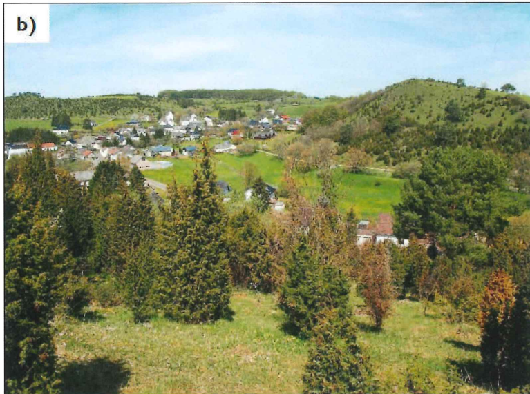
Abb. 3: a) Mikrohabitat mit hoher Deckung von Helianthemum nummularium ssp. nummularium , b) Kalkmagerrasenlandschaft in den Alendorfer Kalktriften.