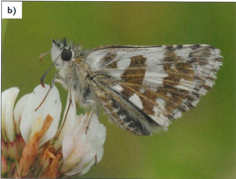
Abb. 2: a) Pyrgus alveus – Flügeloberseite, b) Pyrgus alveus – Flügelunterseite.