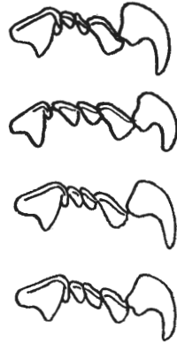
Abb. 3. Boredere rechte Zahnreihe des Oberkiefers bei Crocidura . Oben: typische C. leucodon (nach Miller); darunter: typische C. russula (nach Miller); darunter: C. leucodon von Dickenberg; zu unterst: C. leucodon von Mauritz.

Von der Feld-Spitzmaus ( Crocidura leucodon Herm.) können ebenfalls zwei Exemplare aus dem Landesmuseum genannt werden. Das eine stammt von Mauritz bei Münster (12. III. 37, ♀, Kopf und Rumpf 74 mm, Schwanz 38 mm, Ohr 8,5 mm, Hinterfuß 14 mm), das andere von Dickenberg im Teutoburger Walde nahe dem Heiligen Meere (11. VIII. 37, ♂, Kopf und Rumpf 80 mm, Schwanz 32 mm, Ohr 8 mm, Hinterfuß 12,5 mm). Diese Art ist von der ähnlich gefärbten Waldspitzmaus ( Sorex araneus L.) leicht an den weißen (statt rotspitzigen) Zähnen zu unterscheiden, von der Hausspitzmaus ( Crocidura russula Herm.) an dem oberseits dunkleren, unterseits weißen Fell, das an den Körperseiten beide Farben scharf abgesetzt zeigt, während bei der Hausspitzmaus das matte Graubraun der Oberseite allmählich in das Hellgrau der Unterseite übergeht. Unterschiede in der Bezahnung, die in der Literatur als Kennzeichen für Cr. leucodon und Cr. russula genannt werden, sind nicht so konstant, daß sie zur sicheren Bestimmung ausreichen. Normalerweise ist der 3. obere