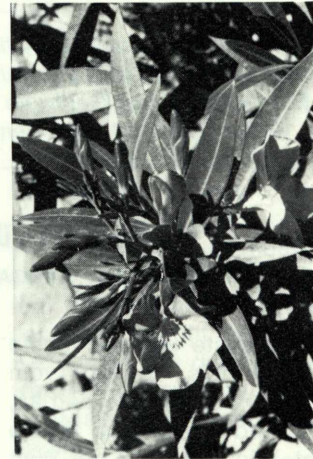
Oleander ( Nerium oleander )

wächse) und das Harmelkraut ( Peganum harmala – Fam. Zygophyllaceae/Jochblattgewächse). Der Oleander erfüllte als übermannshohes Dickicht die sandigen Wadis und sorgte mit seinen prachtvollen rosa-roten Blütenbüscheln, die an den Sträuchern in großer Zahl standen, für eindrucksvolle Farbkontraste. Viel unscheinbarer zeigte sich das Harmelkraut, ein Halbstrauch, mit seinen rahmweißen 3 cm großen Blüten, das in Petra auf trockenem, sandigem Boden weitverbreitet war. Diese echte Wüstensteppenpflanze ist hier und in ganz Nordafrika zu Hause. Blüten