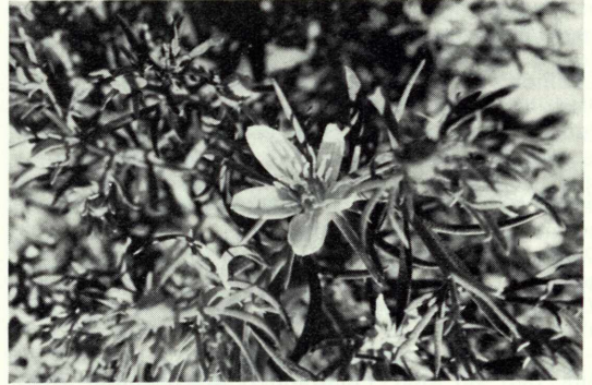
Harmelkraut ( Peganum harmala )

Es gab im Stadtgebiet von Petra eigentlich nur zwei Pflanzen, die reich blühten, nämlich der Oleander ( Nerium oleander – Fam. Apocynaceae/Hundsgiftge-