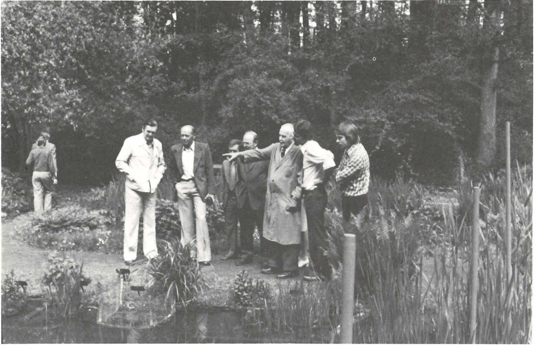
Am 15. Mai 1977 besuchte der engere Vorstand das Freiland-Terrarium und Aquarium in Stein und ließ sich von den Mitarbeitern über die bisher erzielten Fortschritte informieren.

Die Beziehungen zwischen den Abteilungen untereinander und zur Vorstandschaft sind zufriedenstellend. Mehr und mehr fühlen sich die Abteilungen als kooperierende Teile eines Ganzen und nicht mehr als unverstandene Kinder einer „Muttergesellschaft“, wie es in falsch akzentuiertem Euphemismus früher manchmal hieß. Relikte solchen Denkens erklären sich aus der Geschichte der Naturhistorischen Gesellschaft, die im Laufe ihrer langen Geschichte gelegentlich kleine Gruppen als Abteilungen aufnahm, ohne sie ausreichend zu integrieren. Heute ist es klar, daß Abteilungsmitglieder in erster Linie Mitglieder der Naturhistorischen Gesellschaft mit allen ihren Rechten, Pflichten und Verpflichtungen und erst in zweiter Linie Mitarbeiter einer Gruppe mit Sonderzielen sind, die wir als Abteilung bezeichnen. Es ist die nicht immer leichte, aber notwendige Aufgabe der Vorstandschaft und in Zweifelsfällen des erweiterten Vorstandes, dem auch die Obleute und Pfleger angehören, die Interessen der Natur-