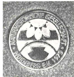
Die Gedenkmünze, die sich die Besucher in Gold, Silber oder Bronze selbst prägen konnten. Die Vorderseite zeigt das Motiv des Plakats, die Rückseite das Emblem der NHG. Den Entwurf lieferte E. Schäfer.