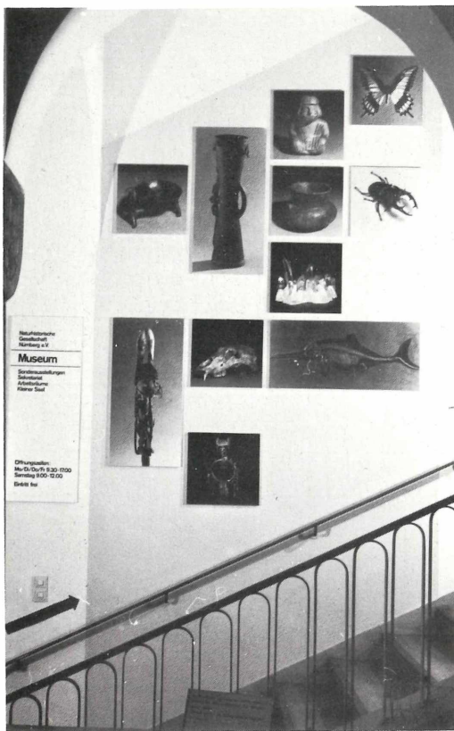
Der neugestaltete Treppenaufgang im Luitpoldhaus. Wir lassen Bilder sprechen und verzichten auf all zu klotzige Schriften. Wann gehen Sie wieder einmal ins Museum?