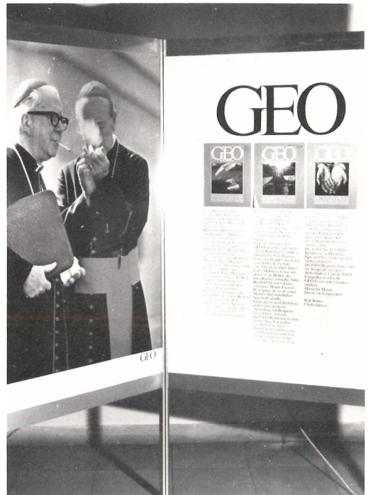
Ein Schnappschuß aus der GEO-Ausstellung