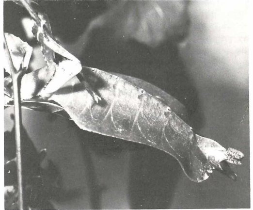
Bei der Eiablage

Die erstaunliche Ähnlichkeit des „Wandelnden Blattes“ mit der Form und Färbung seiner Umgebung sind ein extremes Beispiel für schützende Ähnlichkeit (Mimikry). Sogar die Beine haben die Form von „Blättern“ und auf dem Rücken der Tiere lassen sich „Blattadern“ erkennen. So vollkommen getarnt und an ihre Umgebung angepaßt, können ihre Feinde sie nur schwer entdecken.