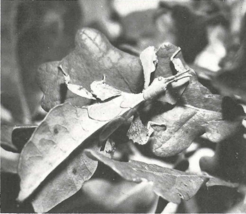
Wandelndes Blatt männliche Larve