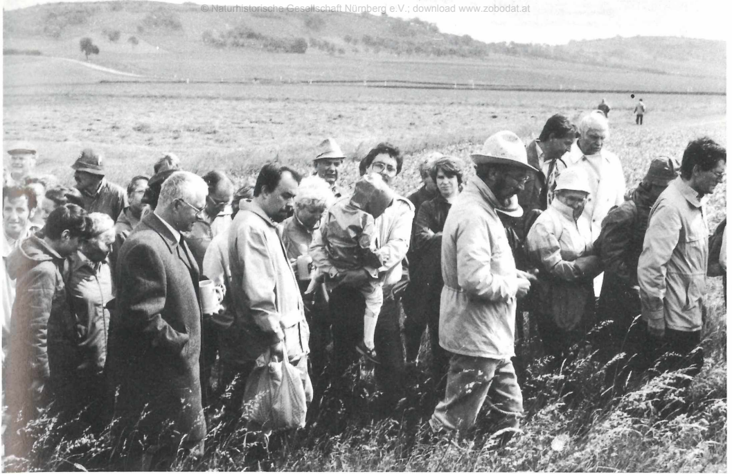
Beim Rundgang um den Gipshügel 1985