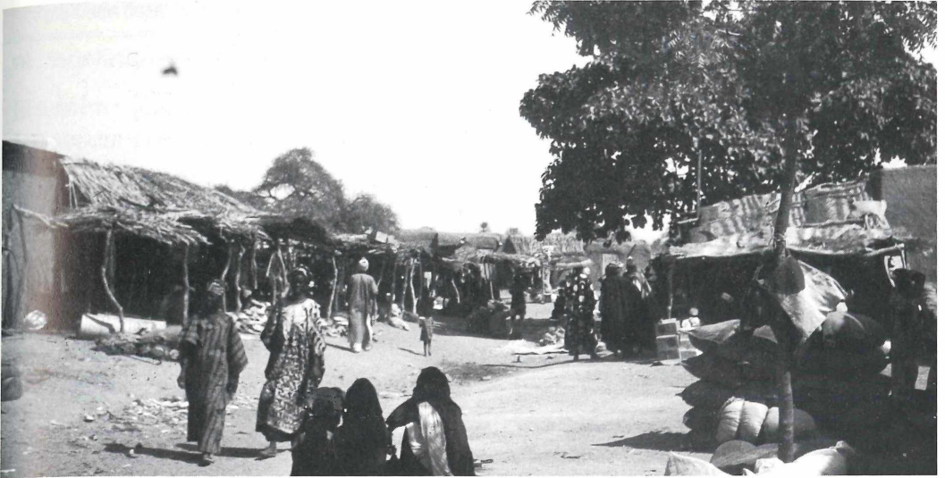
Tourungumbe liegt an der Grenze zu Mauretanien. Der Markt ist ein typisches Beispiel der traditionellen Form unter Bäumen.

Auch dieser Umstand führt zum Anwachsen der Elendsviertel an den Rändern der Städte und Märkte Afrikas. So verwundert es nicht, daß Diebstahl, Korruption und Prostitution in den unkontrolliert wachsenden Märkten und Städten überhandnehmen.