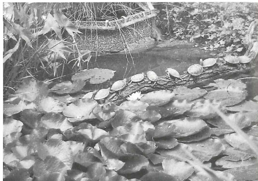
Europäische Sumpfschildkröten an ihrem Lieblings-sonnenplatz, aufgereiht wie Perlen. Sie lassen sich auch durch die zahlreichen „Freilandbesucher“ nicht stören.

Neben dem regen Interesse unserer Besucher an den Wochenenden (ca. 28 000), hatte sich heuer auch der Bayerische Rundfunk für das „Freilandaquarium“ interessiert. In einer Hörfunksendung in Bayern 2 wurde im August ein 7minütiges Interview über unsere Arbeit im „Freiland“ gesendet. Auch die NZ brachte einen fast ganzseitigen, reich bebilderten Artikel in ihrem Stadt-Nürnberg-Lokalteil. Gegen Ende der Öffnungssaison veranstaltete der Bund Naturschutz zusammen mit unserer Abteilung eine Informationsausstellung im Kaufhaus „Hertie“, zu der wir verschiedene in unserer Heimat vorkommende Amphibien und Reptilien zur Verfügung stellten. Die Sonderausstellung dauerte 2 Wochen und war sehr gut besucht.