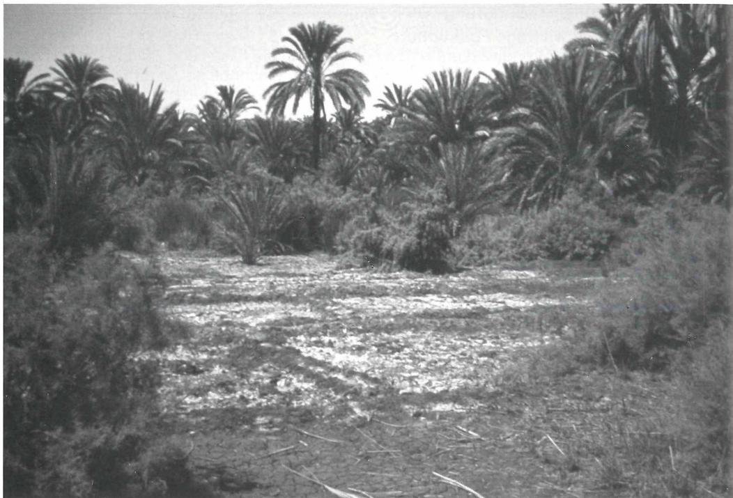
Bodenversalzung im ägyptischen Niltal: Sie wird sichtbar an den Salzausblühungen in zur Bewässerung vorbereiteten Beeten.

fuhr in Mitteleuropa zwischen 0,8 und 3,0 kmol H/ha x Jahr. In niederländischen Waldböden hat man sogar eine Säurebelastung von bis zu 6 kmol H/ha x Jahr festgestellt. Angesichts dieser progressiven Bodenversauerung in den gemäßigten Zonen der Nordhalbkugel sind Schutzmaßnahmen dringend erforderlich, zumal die Bodenversauerung als eine Hauptursache des Waldsterbens angesehen wird. Kompensationskalkungen können allerdings die Not nur lindern, nicht beseitigen, außerdem gilt es dabei auch Risiken wie z.B. Nitratauswaschung in das Grundwasser einzukalkulieren.