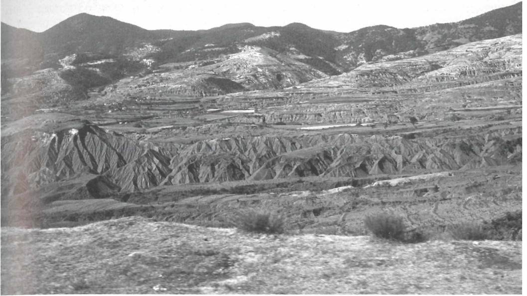
Bodenerosion in Mexiko: Fortschreitende Bodenzerstörung vernichtet unersetzbares Ackerland.

Bodenerosion durch Wasser und Wind bedeutet in allen Ackerländereien meist einen irreversiblen Verlust von den Bodeneigenschaften, welche die Bodenfruchtbarkeit bedingen. In erster Linie ist damit das Sorptionsvermögen für Wasser und Nährstoffe gemeint. Bodenerosion zerstört Böden und verursacht auch weiter vom Ort des Abtrags entfernt Schäden, so z.B. Verschlammung der Wasserläufe und Talsperren oder Gewässerkontaminationen mit chemischen Stoffen (bes. Phosphate, Schwermetalle, Pestizide). Ökonomisch macht sich Bodenerosion zunächst durch Ertragsausfälle oder Ertragseinbußen bemerkbar. Selbst in den fruchtbaren Lößlandschaften Mainfrankens ist das so, wie das Beispiel einer Erosionskatastrophe zeigt: auf der geringmächtigen Pararendzina in Erosionslage werden nur 50 dt/ha Winterweizen geerntet gegenüber 60 dt auf der Parabraunerde oder dem Kolluvium, bzw. nur 550 dt Zuckerrüben gegenüber 650 dt. Das entspricht einer Ertragseinbuße von 16,6 % bzw. 15,3 %.