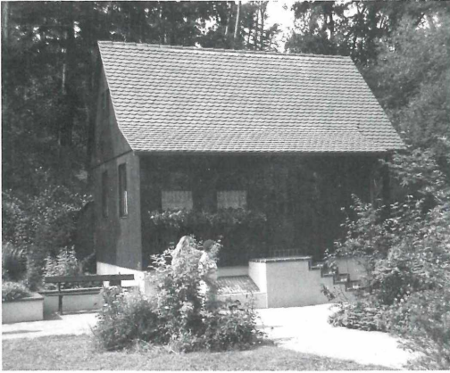
Das neue Aquarienhaus nach der Fertigstellung