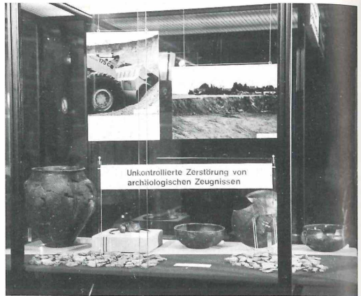
Im Jugendgästehaus sprach die Abt. f. Vorgeschichte die Probleme mit vorgeschichtlichen Funden an und zeigte, was moderne Restaurierung möglich macht.

Die Vitrine im Jugendgästehaus der Stadt Nürnberg wurde am 13.4.1987 nach Plänen der Abteilung für Medien und Ausstellungen aufgebaut und dann erstmals in Zusammenarbeit mit der Abteilung für Völkerkunde dekoriert. Die 2. Dekoration erfolgte zusammen mit der Abteilung für Karst- und Höhlenkunde am 21.12.1987, die wegen des großen Interesses der jugendlichen Gäste auf Wunsch des Heimleiters noch bis zum Spätherbst verlängert wurde. Am 23.11.1988 erfolgte dann die 3. Dekoration über die Arbeit der Abteilung für Geologie. Die 4. Dekoration wurde am 14.8.1989 zusammen mit der Abteilung für Vorgeschichte eingebracht. Eine Neudekoration erfolgt Anfang 1990. Für Bild-, Schrift- und andere Dekorationsmittel entstanden bisher Kosten in Höhe von rund 1.000,- DM. Wie mit dem Deutschen Jugendherbergswerk, Landesverband Bayern, der Träger dieser Einrichtung ist, vereinbart, werden diese Kosten von der NHG getragen. - Man sieht, Öffentlichkeitsarbeit ist nicht zum Null-Tarif zu haben. Eine NHG-Vitrine in der Stadtbibliothek wurde von der Abteilung für Medien und Ausstellungen für ca. 2 Monate zur Mitgliederwerbung genutzt. Obgleich die Vitrine an gut frequentierter Stelle stand und mit Color-Vergrößerungen, Modellen, Ausstellungs-systemen und einem informativen Schriftblock auf die Möglichkeit einer ehrenamtlichen