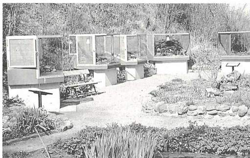
5 neue Terrarien