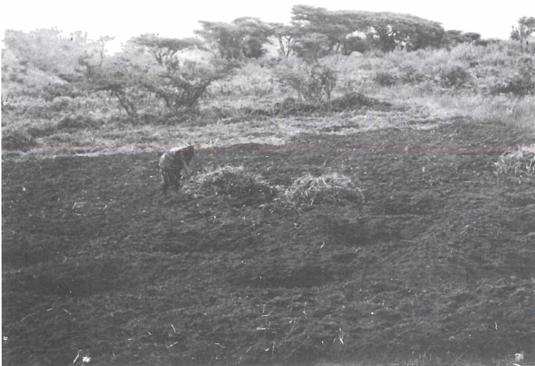
Abb. 3: Reinigung des Feldes zwischen den ngolo-Gruben.