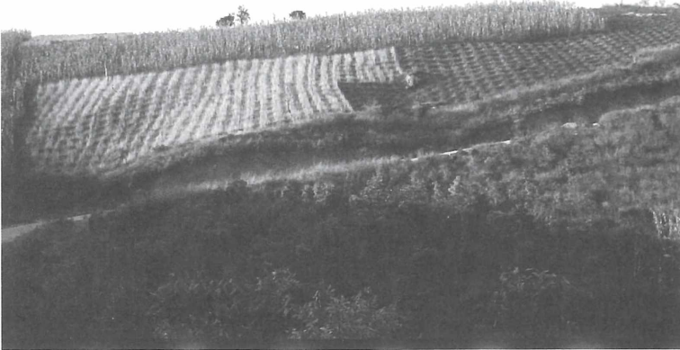
Abb. 2: Weizenfeld mit ngolo-Gruben, teilweise abgeerntet.

„Auf frisch gerodetem Waldland bauen die Matengo zuerst Fingerhirse im Fleckenfeldbau an. Im zweiten Jahr graben sie