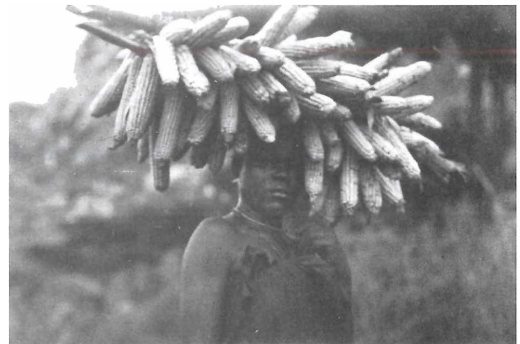
Abb. 4: Transport der Maiskolben mit Hilfe von Tragestangen. Foto: Nikolaus von Holzen 1929

Der nächste große Umbruch in der Landwirtschaft ist durch die Einführung des Kaffeeanbaus herbeigeführt worden. Die ersten Versuche mit dieser ausschließlich zur Ausfuhr bestimmten Produktion fanden um 1927 statt. 1932 wurde durch die zuständigen britischen Behörden festgestellt, daß die Qualität des Robusta-Kaffees vom Matengo-Hochland zufriedenstellend ist. Einen großen Aufschwung nahm dieser für sie noch immer neue Wirtschaftszweig, als die um 1960 recht hohen Kaffeepreise des Weltmarktes einigen unternehmungslustigen Matengo zum Wohlstand verhalfen. Um 1990 arbeiteten schätzungsweise 10 % der Bevölkerung in der Kaffee-Monokultur. Die Familien der Kaffeebauern sind dabei voll beschäftigt, deshalb müssen sie den eigenen Bedarf an Lebensmitteln käuflich erwerben. Zu den Neuerungen, die mit dem Kaffeeanbau auftraten, gehört die Gründung einer Genossenschaft; sie liefert die offiziell zugelassenen Setzlinge. Meistens werden 100 bis 150 Stauden gepflanzt, mit Silbereichen als Schattenspender dazwischen. Die Stauden tragen nach drei Jahren zum erstenmal Früchte, bringen aber bei guter Pflege viele Jahre hindurch reiche Erträge. Die Pflege ist allerdings mühsam: Man muß zwischen den Reihen das Unkraut jäten, die Stauden jährlich mehrmals mit Chemikalien gegen Insekten und Pilzbildung bespritzen, sie mit Stroh gegen Kälte und Trockenheit schützen. Diese Arbeiten werden größtenteils von Männern geleistet, die Frauen helfen aber auch beim Jäten und beim Pflücken der Ernte.