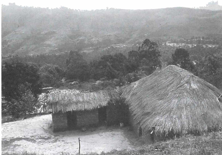
Abb. 5: Wohnhaus mit Küche und Speicher aus Ziegelsteinen.