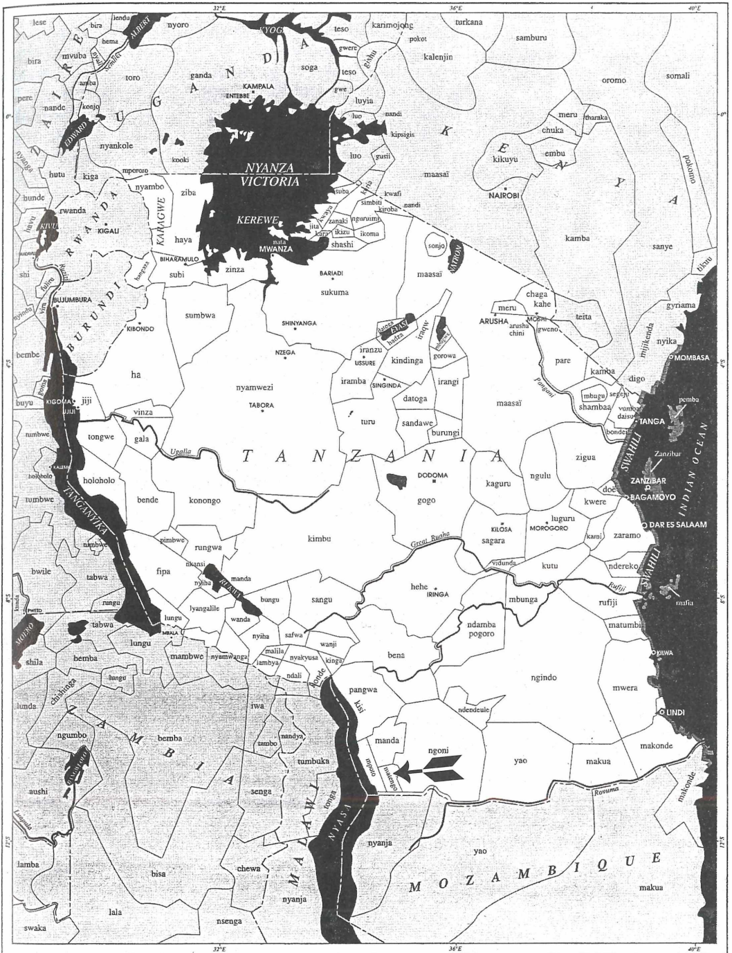
Abb. 1: Lage des Wohngebietes der Matengo im Staat Tanzania (Pfeil). Karte entnommen aus: J. JAHN (Hrsg.), Tanzania – Meisterwerke afrikanischer Skulptur. Berlin/München 1994.