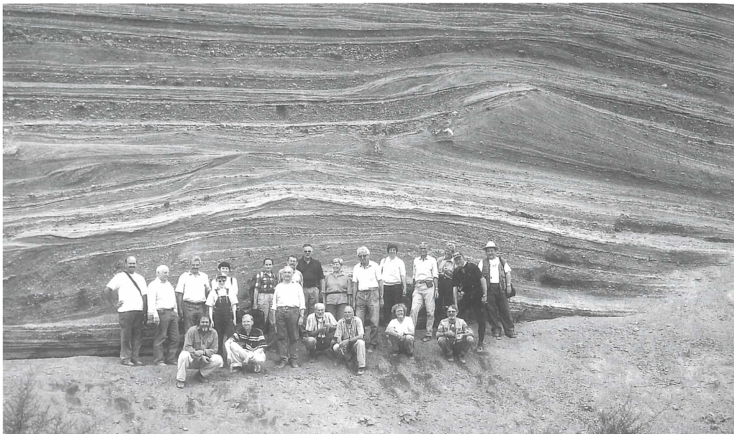
Abb. 2: Die Teilnehmer unserer Exkursion vor den mächtigen Tephraablagerungen des Wingertsberges bei Mendig. Aufgeschossen sind vor allem die oberen grauen, schräggeschichteten phreatomagmatischen Tuffe und Breccien der oberen Laacher-See-Tephra (graue Laacher-See-Tuffe).

in kurzer Zeit eruptierten! In der Hauptphase des Ausbruchs wurde in zwei bis drei Tagen die riesige Menge von ca. 16 km 3 Bims gefördert. Das war auch mehr als bei der berühmten Eruption des Vesuvs im Jahre 79 n.Chr., bei der die Städte Herkulaneum und Pompeji durch Glutlawinen und Bimsdecken begraben und weite Landstriche verwüstet wurden.