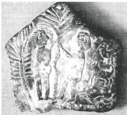
Bildstein „Adam und Eva“