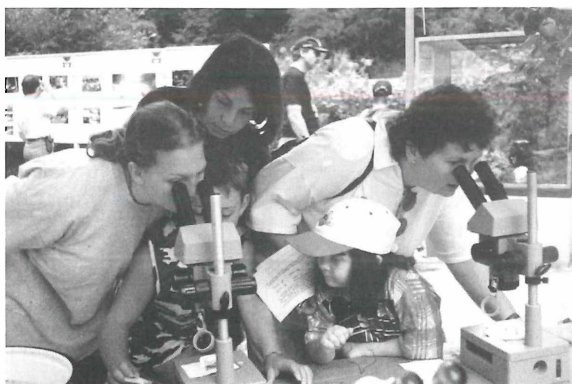
Tage der offenen Tür im „Freiland“ mit interessanten Aktivitäten für die ganze Familie.