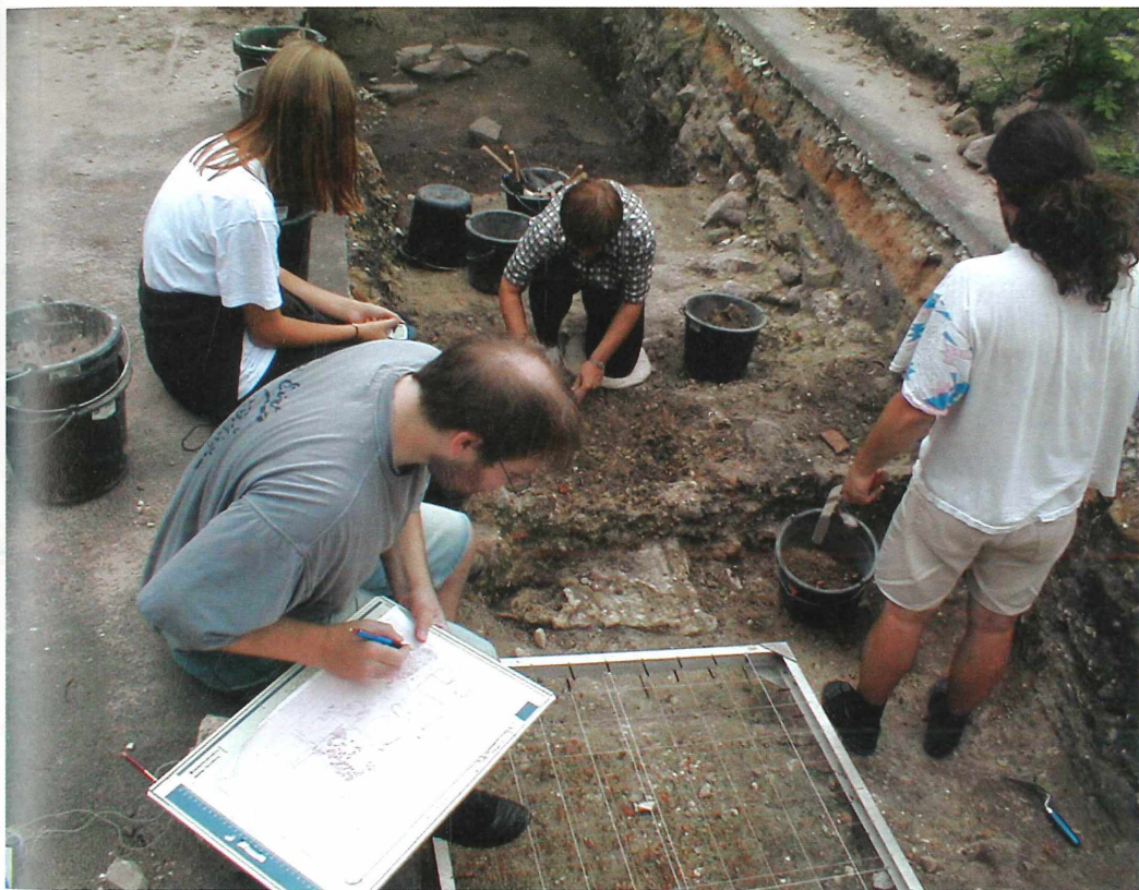
Grabung und zeichnerische Dokumentation am Kreuzgang des Klosters Pillenreuth

ten viele Fragen. Die Ausdehnung der Klosterkirche, die Kreuzgangssituation und einige Details der architektonischen Ausstattung der Kirche wurden dokumentiert. Überraschenderweise zeigte sich die Kirche bis auf die Grundmauern abgetragen, selbst der Ziegelfußboden war – zumindest innerhalb des Grabungsschnittes – bis auf einige wenige verwitterte Ziegel vollständig entfernt worden. An der Nordseite hatte man auch die Außenmauern bis auf das Niveau des Kreuzgangbodens abgebrochen, der Boden selbst war aus Ziegelestrich und deshalb in situ verblieben. Eine offensichtlich noch zur Nutzungszeit des Klosters verursachte Störung des Kreuzgangfußbodens konnte vor Winter einbruch 2001 nicht mehr untersucht werden, so dass der Abschluss der Arbeiten nebst ausführlichem Bericht erst 2002 erfolgen kann. An dieser Stelle sei schon allen Mitarbeiterinnen und Mitarbeitern dafür gedankt, an zahlreichen