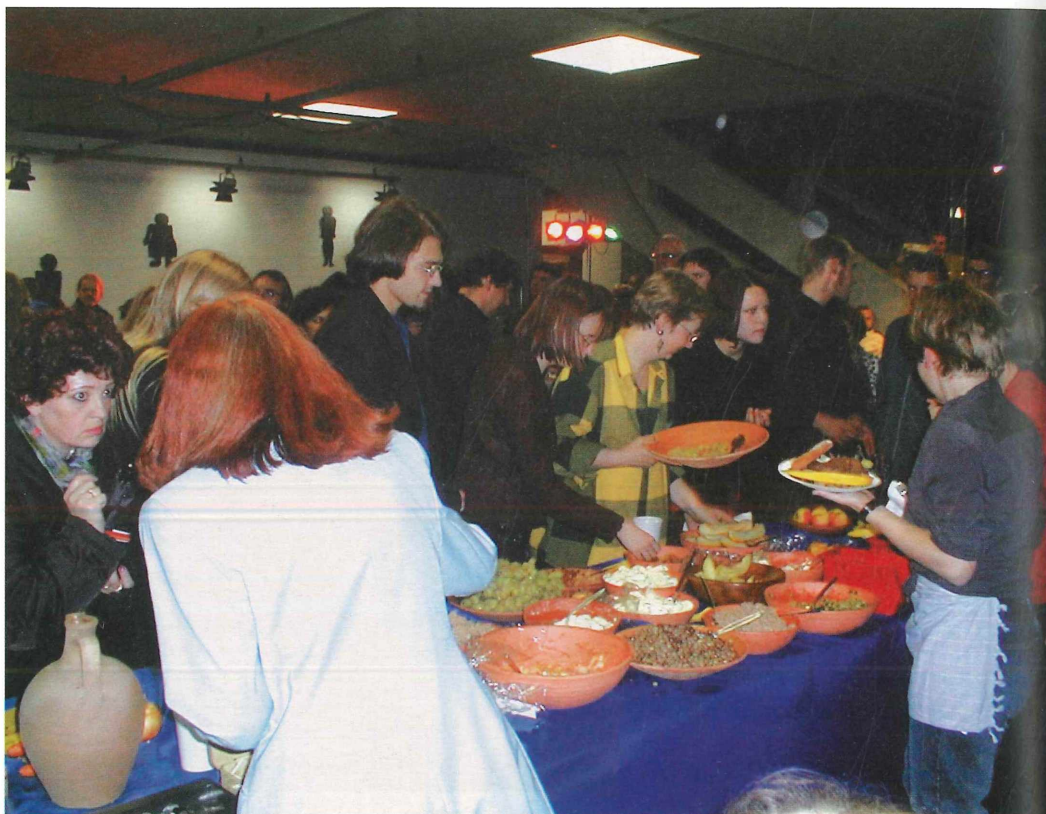
„Essen wie Agamemnon“ in der Blauen Nacht 2000