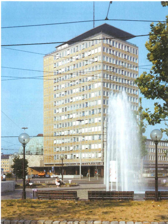
Abb. 1: Das denkmalgeschützte Plärrer-Hochhaus, das 1954 mit 56 m Höhe das höchste Bürogebäude Bayerns war.

„deutsche aller Städte“. Dieses traditionsreiche Bild der Stadt war bei den zahlreichen Besuchern und den Einwohnern so stark verankert, dass etwaige Korrekturen, z.B. durch den Bau von Hochhäusern, kaum Chancen hatten. Die wenigen neueren, höheren Gebäude wie die mächtigen neobarocken Bauten des Hauptbahnhofs und des Theaters mit ihren hohen vierkantigen Kuppeln gegenüber der Befestigungsmauer markierten deutlich die Grenze zwischen historischer Altstadt und Beginn des Erweiterungsgebiets der heutigen Innenstadt. Hier am Bahnhofplatz entstand 1934-35 mit dem Postdienstgebäude der erste höhere, moderne Bürobau in der Stadt, der wohl als Hochhaus zu bezeichnen ist. Der achtgeschossige Stahlskelettbau mit überstehendem Walmdach ver-