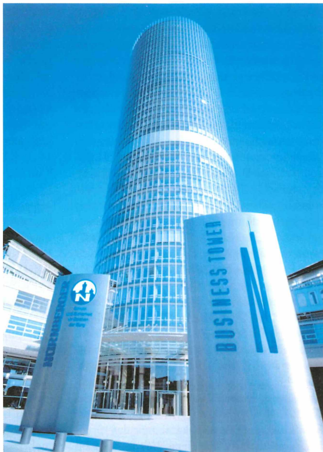
Abb. 2: Der Business-Tower an der Ostendstraße, der 1998/2000 mit 135 m Höhe als höchstes Bürogebäude in Bayern entstand.

Eine Lösung dieses Problems sah man u.a. auch im Bau von Wohnhochhäusern; sie sollten möglichst entfernt von der Altstadt erstellt werden, um das historische Stadtbild nicht zu beeinträchtigen. Hier bot z. B. der anlaufende Bau der Trabantenstadt Langwasser rd. 6 km südöstlich der Altstadt viele Möglichkeiten. Hier entstanden dann auch mehr als zwanzig 11-17-geschossige Wohnhochhäuser, meist in Form von Punkt- und Scheibenhäusern, mit bis zu