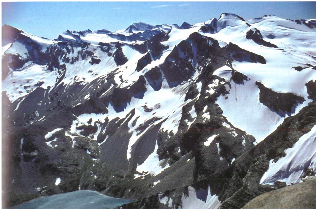
Blick aus 3300 m Höhe in die Nordflanken der noch stark vergletscherten Grajischen Alpen. Die Aufnahme wurde Mitte September gemacht, also zu einem Zeitpunkt, an dem die Schneefelder nahezu vollständig abgetaut sind. Tief unten der Stausee Lago Serrù im Locana-Tal, 2275 m, dessen Zuflüsse von Gletschern gespeist werden.

Heute gibt es noch gut 5.000 Gletscher in den Alpen. Sie haben eine Gesamtfläche von 2.500 km 2 (= 1,4% der Alpenfläche) und ein Eisvolumen von 125 km 3 , so dass darin derzeit etwa eine Wassermenge gespeichert ist, die einem