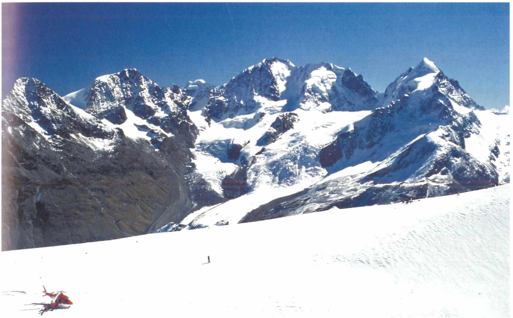
Die Gletscherwelt der Bernina-Gruppe mit dem Piz Bernina, 4.049 m, in der Bildmitte. Vorn der von einer Seilbahn erschlossene und zum Gletscherskilauf genutzte Corvatsch-Gletscher in 3.250 m Höhe.

Dieses Erfahrungswissen, das in den Alpen an zahlreichen Orten noch lebendig ist, gilt jedoch keineswegs nur für die Alpen, sondern grundsätzlich für alles menschliche Leben auf der Erde. In den Gunstregionen der Erde mit geringen naturräumlichen Gefährdungen wird dieses Wissen jedoch leicht verdrängt und heute ganz besonders, weil die Berücksichtigung der Natur beim Handeln und Wirtschaften zusätzliche Kosten verursacht, die „man“ heute gern einsparen möchte. Hier machen die Alpen sehr eindrücklich und anschaulich deutlich, dass die Verdrängung dieses Erfahrungswissens zur Selbstzerstörung des Menschen auf der Erde führt: Die Alpen spielen auch eine wichtige Rolle in Europa als Vorreiter für einen grundlegenden ökologischen Umbau unserer modernen Gesellschaft.