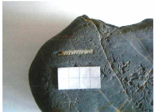
Abb. 4: Der Graptolith aus Rothaurach im Detail. Maßstab 2 cm.