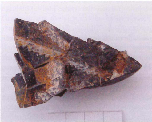
Abb. 6: Monograptus cf. leptotheca LAPWORTH aus dem Lyditgeröll (Llandoverly) von Rednitzhembach. Maßstab 2 cm.

Der 2 cm lange Graptolith von Rothaurach (Abb. 4) liegt auf der Oberfläche des oben beschriebenen Lyditgerölls und ist demzufolge auf natürliche Weise angeschliffen. Ein kurzes Stück kommt nur noch als Abdruck vor und zeigt die körperliche Erhaltungsweise, die im Allgemeinen selten vorkommt. Auf 1 cm Länge weist der Graptolith 9 Theken auf. Diese sind schwanenhalsartig gebogen. Erkennbar sind außerdem die Einstülpungen