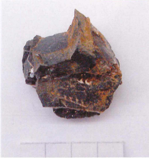
Abb. 5: Monograptus cf. lobiferus MCCOY aus dem Lyditgeröll (Llandoverly) von Rednitzhembach. Maßstab 2 cm.