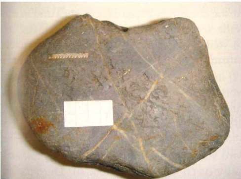
Abb. 3: Das Lydit-Geröll (Llandovery bis unteres Wenlock) aus Rothaurach mit Monograptus cf. priodon BRONN. Maßstab 2 cm.

BERGER 2010: 27 ff.). Die Schotter haben sich wahrscheinlich im Quartär bei der Verwitterung und Abtragung von untermiozänen Tonen und Sanden angereichert. BERGER (2010: 159 ff.) konnte nämlich nachweisen, dass Gerölle von der Zusammensetzung der Hochgelegenen Schotter schon im Unter miozän auf sekundärer Lagerstätte mit Tonen und Sanden zur Ablagerung kamen.