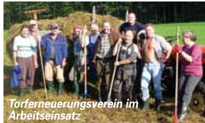
Torferneuerungsverein im Arbeitseinsatz

Das Rennen machte aber schließlich die Gemeinde Bürmoos. Unter dem Patronat der Gemeinde wurde der „Torferneuerungsverein Bürmoos“ gegründet, dem heute 564 Mitglieder, vom Schüler bis zum Pensionisten, angehören. Um den letzten Rest des einst 420 ha großen Hochmoores von Bürmoos leisten seit 1985 engagierte Bürger/innen pro Jahr etwa 3.000 ehrenamtliche Arbeitsstunden für ihr Moor – in Summe 43.240 dokumentierte Stunden!