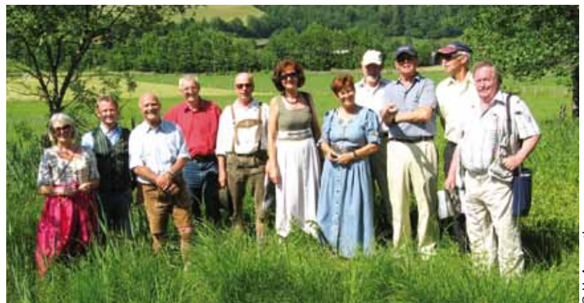
Biotopschutzgruppe in ihrem Lebensraum im Pirtendorfer Talboden

Am 11. Juni 2010 veranstaltete die rührige Biotopschutzgruppe Pinzgau ihr 20 jähriges Bestehen mit einer Begehung im Pirtendorfer Talboden und präsentierte dort in Anwesenheit von Naturschutzlandesrat Sepp Eisl und einer ganzen Reihe von Ehrengästen – von der Bezirkshauptfrau bis zu BürgermeisterInnen – ihre Visionen in einer Broschüre: Ein Biotopverbund von 31 Biotopen zwischen Stuhlfelden und Utendorf wird angestrebt. An der Umsetzung der Visionen wird bereits heftig gearbeitet.