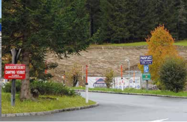
Bau neuer Parkplätze im Nationalparkvorfeld