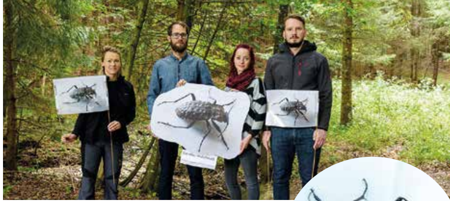
Der nach der FFH-Richtlinie geschützte schwarze Grubenlaufkäfer