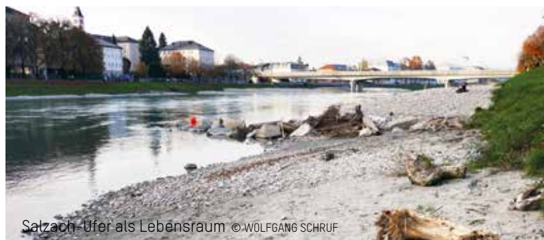
Salzach-Ufer als Lebensraum

* Thomas Bendt ist Gewässerbiologe in Düsseldorf und beschäftigt sich intensiv mit Zuckmücken. Zusammen mit anderen Kollegen arbeitet er an einem Bestimmungsschlüssel und an Steckbriefen für Zuckmückenlarven. Seitdem bekannt ist, dass in der artenreichen Familie Chironomidae (Zuckmücken) sehr viele Arten mit verschiedenen Indikatorfunktionen vorkommen, werden sie zunehmend für die Gewässerbeurteilung herangezogen. Praxisnahe Bestimmungsschlüssel sollen die Schwierigkeiten bei der Bestimmung überwinden.