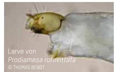
Larve von Prodiamesa rufovittata