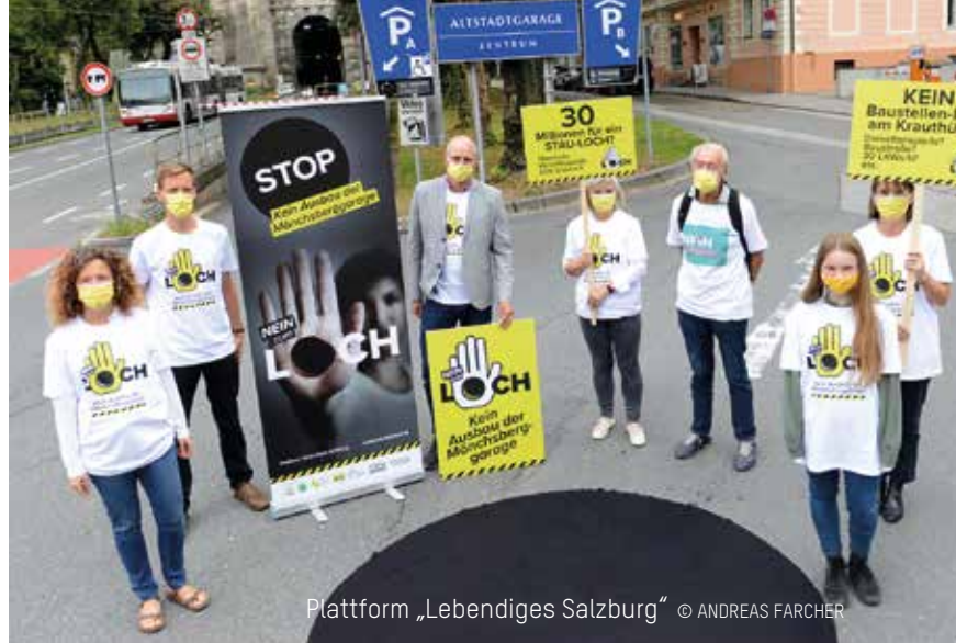
Plattform „Lebendiges Salzburg“

Die überparteiliche Plattform „Lebendiges Salzburg“ sammelt Unterschriften gegen den Ausbau der Mönchsberg-Garage. 30 Millionen Euro würde die Garagenerweiterung kosten, viel Geld, das besser für den Ausbau des Öffentlichen Verkehrs, von Rad- und Gehwegen und für „Park-and-Ride“-Angebote verwendet werden sollte. Bei Erreichen von 2000 Unterschriften muss ein Bürgerbegehren abge-