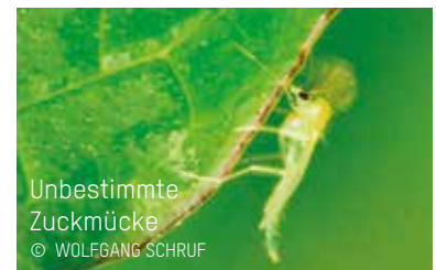
Unbestimmte Zuckmücke