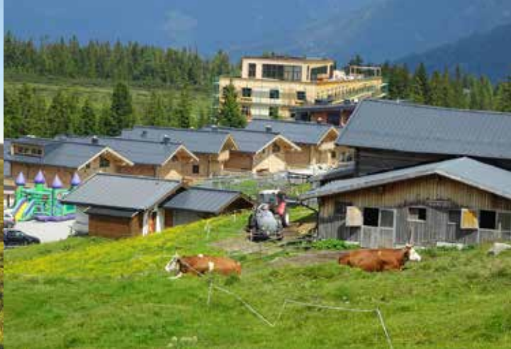
Freie Landschaft als bloße Baulandreserve?