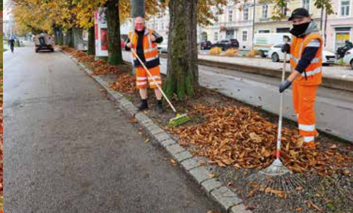
Laubbläser belasten Mensch und Natur