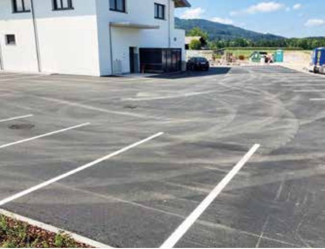
Die Flächenversiegelung schreitet voran