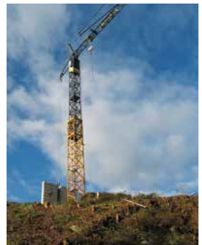
Bau von Zweitwohnsitzen am Naturschutzgebiet