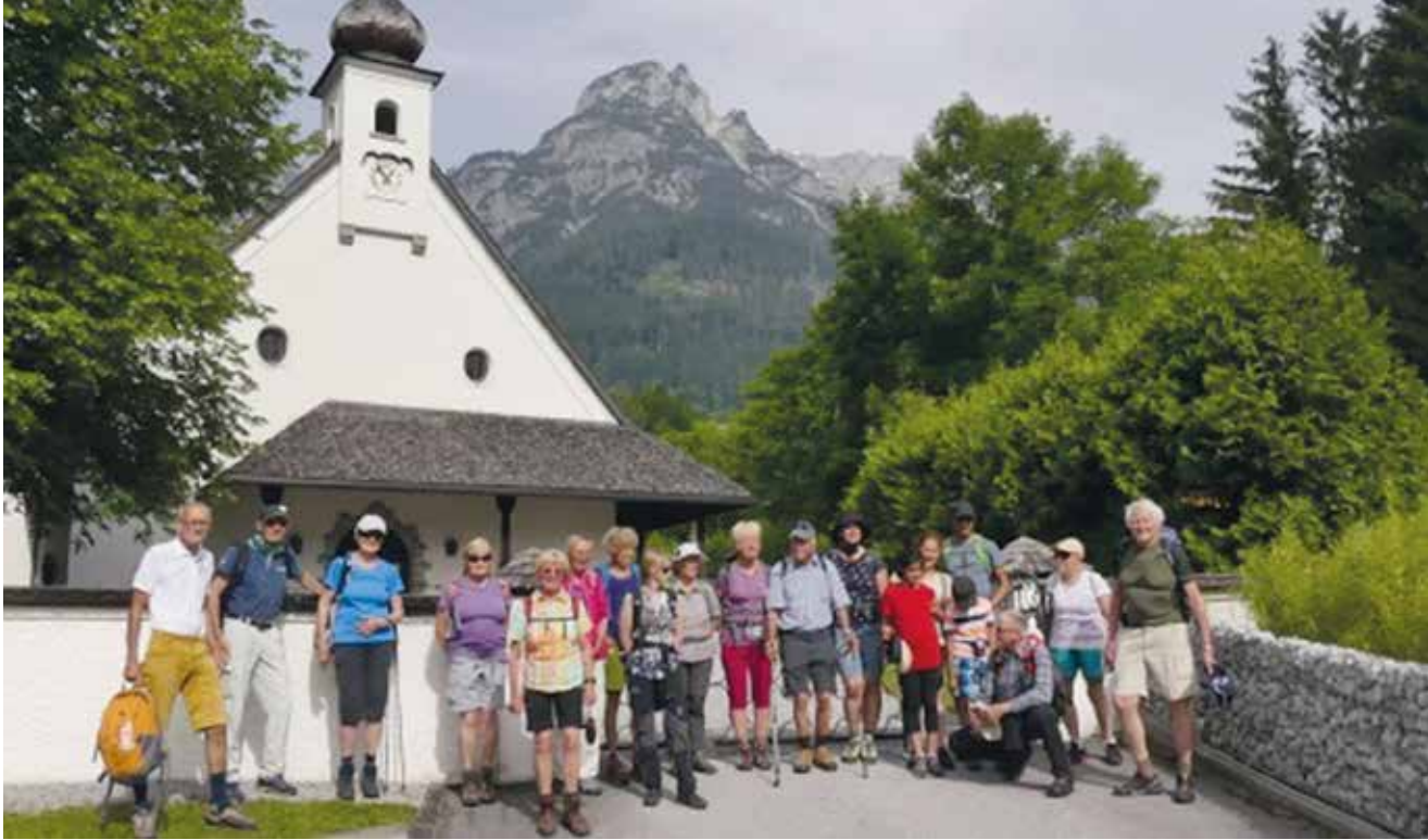
Die Gruppe vor der Tennecker Kirche