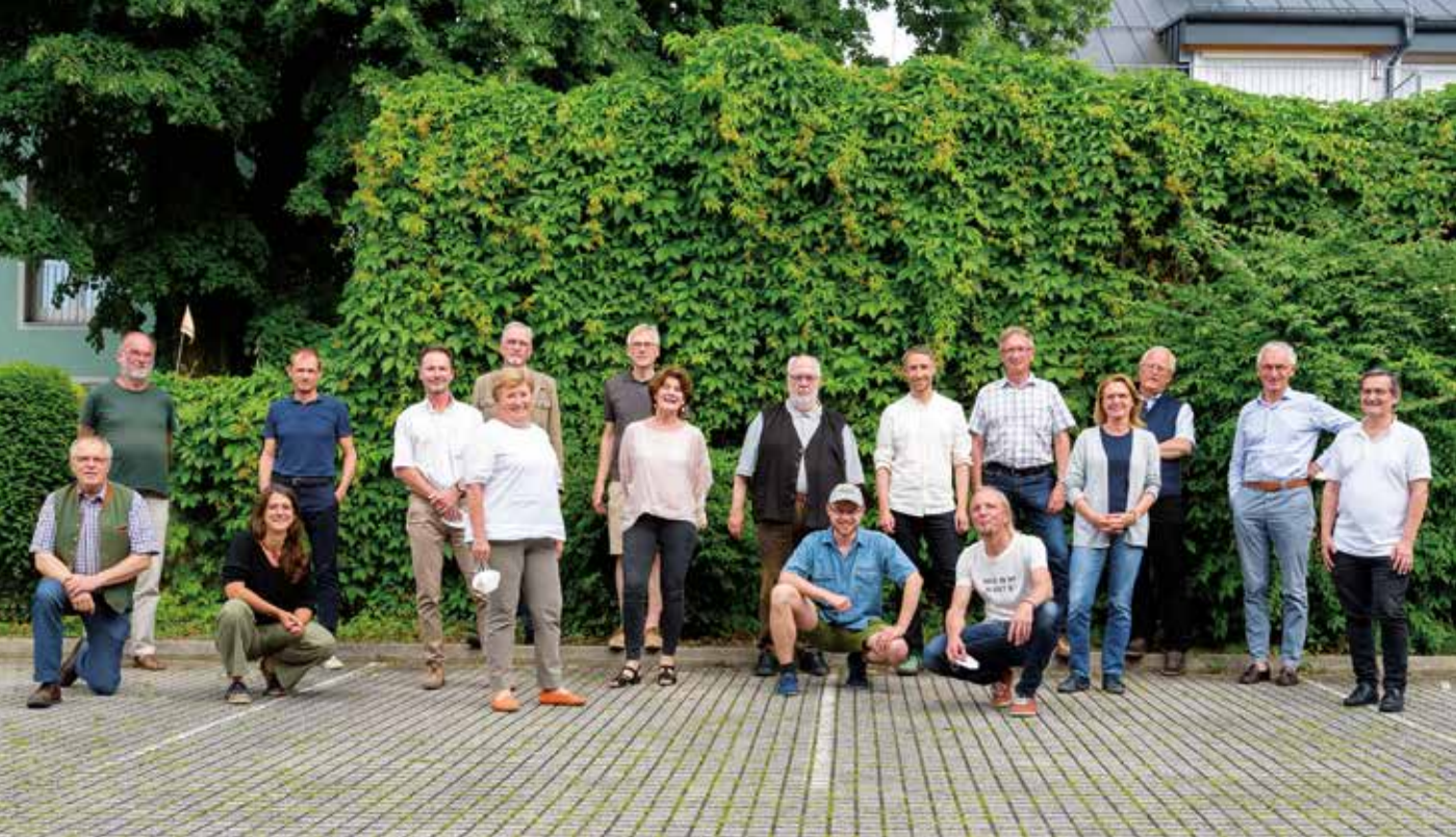
Der Fachbeirat des Naturschutzbundes Salzburg tagte