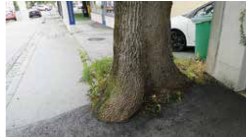
Ein durch Asphaltierung in Salzburg (Fürstenbrunnstraße) malträtiertes Baum

die Österreichische Baumkonvention, die auf die unverzichtbaren Leistungen von Bäumen und Wäldern aufmerksam macht und für mehr Rechtssicherheit und Klarheit punkto Baumhaftung eintritt“, sagt Franz Maier, Präsident des Umweltdachverbandes.