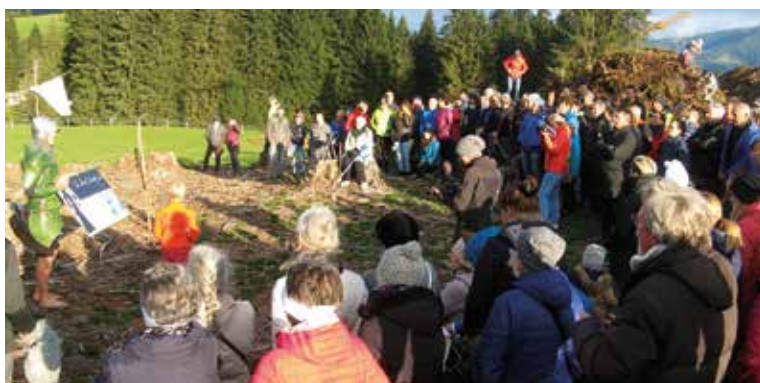
Protest gegen Six-Senses-Projekt beim Wasenmoos

P.P.S.: Auch im Pinzgau kommen die Nachtwespen wieder ans Tageslicht. Die Zerstörung der Natur durch weitere Schipisten am Hochsonnberg bei Piesendorf scheint noch nicht ausgestanden. Ja, sie glauben nicht an die Fakten, notfalls müssen sogar die Fakten daran glauben. Die Hoffnung lebt, nicht zuletzt nach dem „Steinzeit“-Sager des Herrn Bundeskanzler. Hauptsache, es bringt Geld. Auch wenn man es nicht essen kann. Aber man kann sich schöne Anzüge dafür kaufen, wie man sie an einem berühmten Pinzgauer bei einem Pressegespräch in Zusammenhang mit dem beim Wasenmoos gelegenen fragwürdigen „Six Senses“-Projekt im Fernsehen bewundern durfte. Am Ende wird das zur Vorlage der neuen Pinzgauer Tracht?