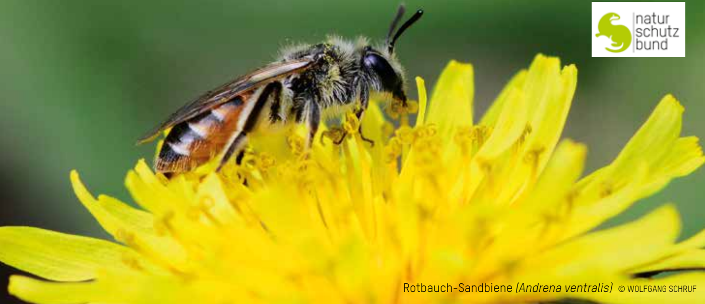
Rotbauch-Sandbiene ( Andrena ventralis )

Unterstützen Sie uns bitte durch Mitgliedschaft oder Spende