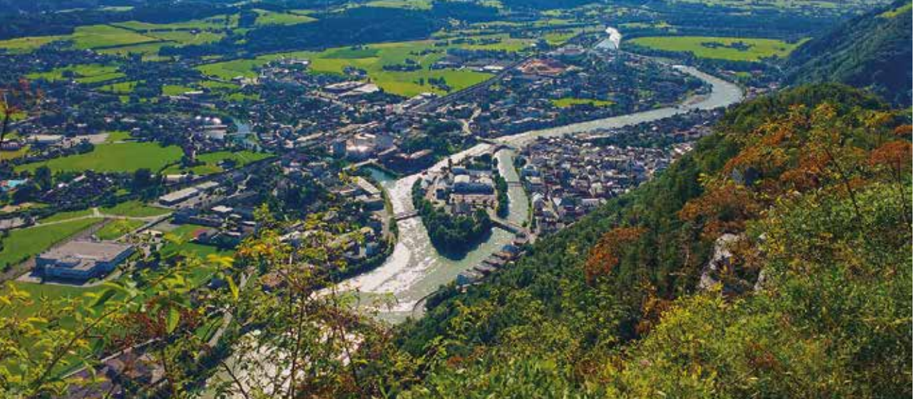
Blick auf die Stadt Hallein, wo es im Juli 2021 massive Hochwasserschäden gab