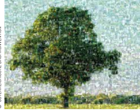
Baum-Mosaik-Foto zur Unterschriften-Aktion