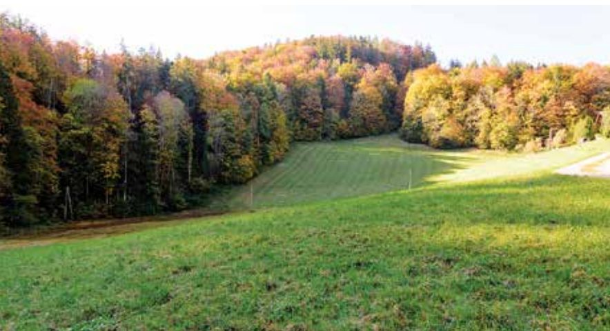
Natürliche Gelände-Senke im Kleinkirchtal als möglicher Hochwasserrückhalteraum

Ein detaillierter Schriftverkehr mit diversen Politikern zur Causa Kothbach ist auf unserer Homepage abrufbar: www.naturschutzbund.at/neuigkeiten-liste/items/koestinger-versus-naturschutzbund-salzburg.html