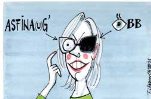
„Evalunore Gewessler“ – Karikatur

wie diesen, für Großbauvorhaben eine öffentlich nachvollziehbare Ökobilanz verpflichtend sein. Zahlen sich Milliarden teure Verkehrsprojekte auch ökologisch aus? Wenn ja, wann wird die ökologische Nutzenschwelle erreicht (Break-even-Point)? Beim Köstendorf Tunnel ist z.B. die Frage erlaubt, ob eine Fahrzeit-Ersparnis von ca. vier Minuten bis Wien das Projekt mit veranschlagten Kosten von knapp drei Milliarden Euro rechtfertigt; insbesondere, wenn laut ÖBB-Berechnungen der künftige Bahnverkehr auch auf der bestehenden Strecke bewältigbar ist und