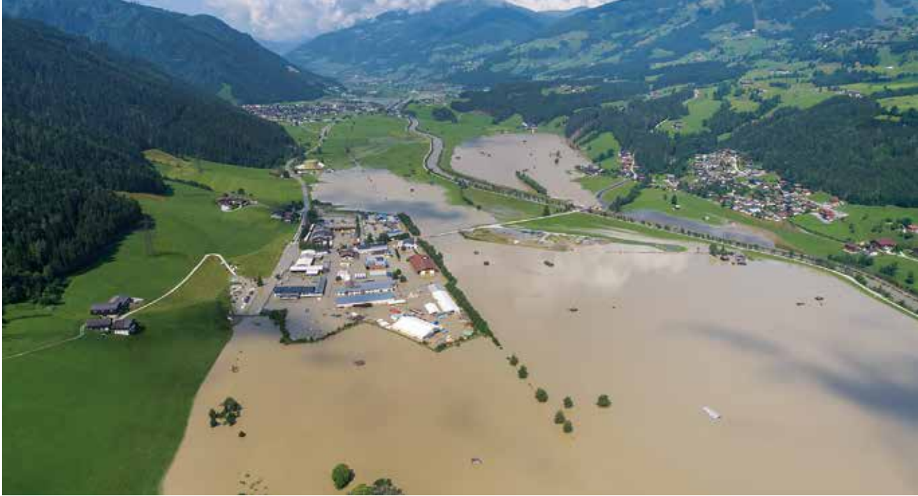
Hochwasser in Mittersill am 21. Juli 2021