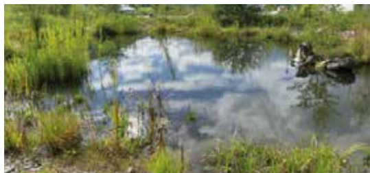
Das Biotop Schwarzenbach beim Umspannwerk Uttendorf