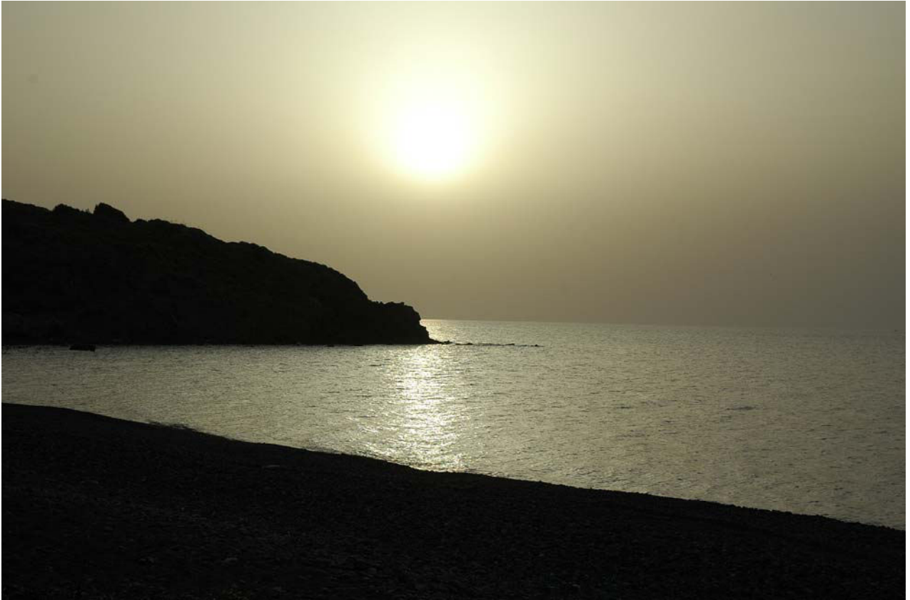
April 2008 Lesbos und das östliche Mittelmeer unter der Saharawolke am 19.4.2008 um 17.20 Uhr bei Molivos