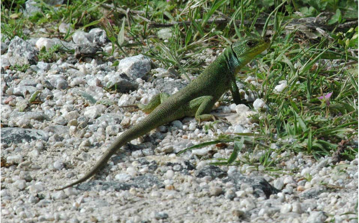
Riesen Smaragdeidechse ( Lacerta trilineata ) 14.4.08