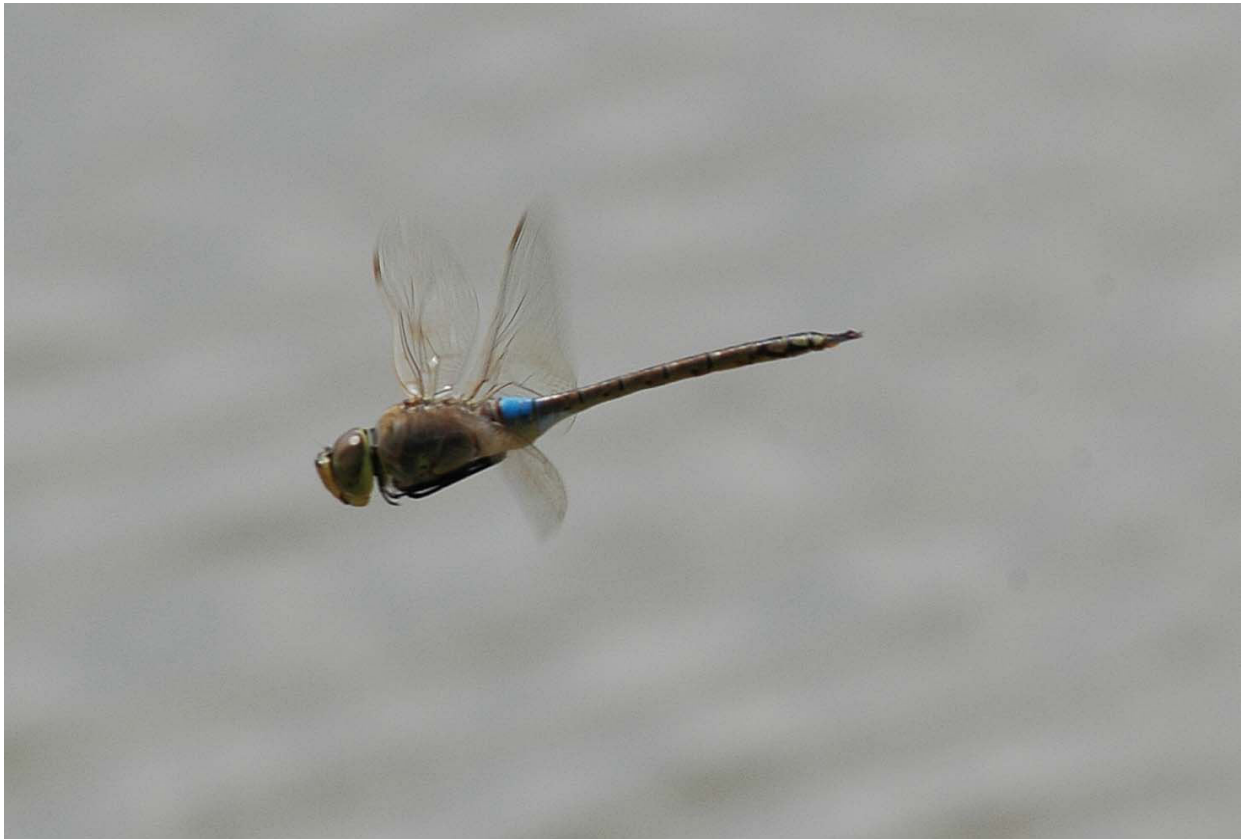
Schabrackenlibelle ( Hemianax ephippiger ) 19.4.08