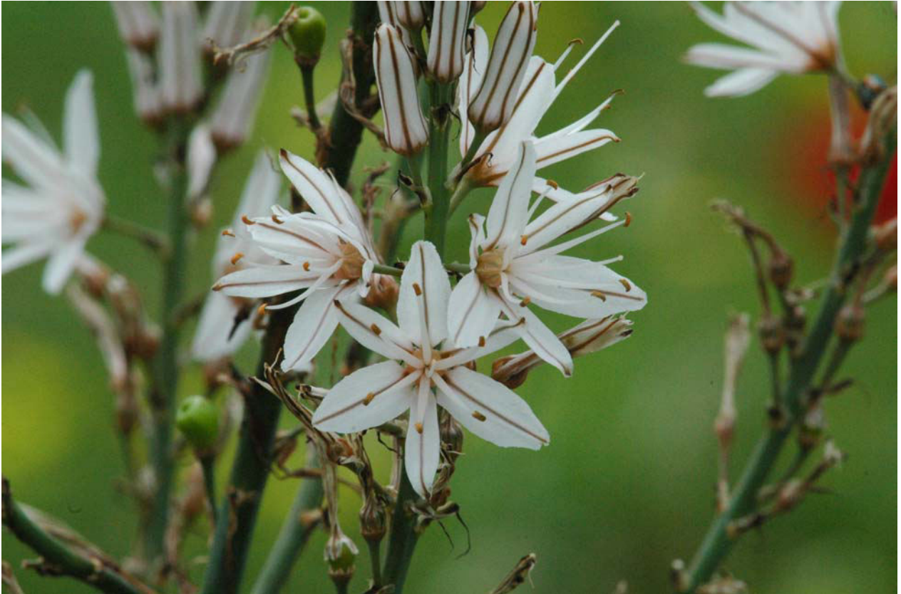
Kleinfrüchtiger Affodill ( Asphodelus aestivus ) 13.4.08