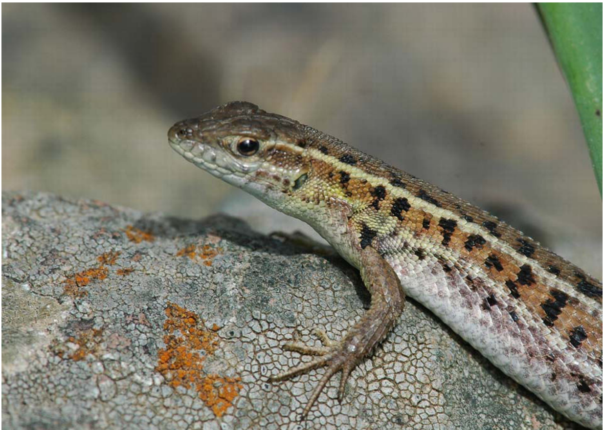
Taurische Mauereidechse ( Podarcis taurica ) 19.4.08