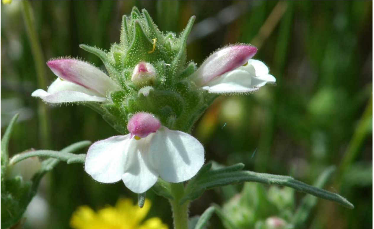
Bunte Bellardie ( Bellardia trixago ) 21.4.08