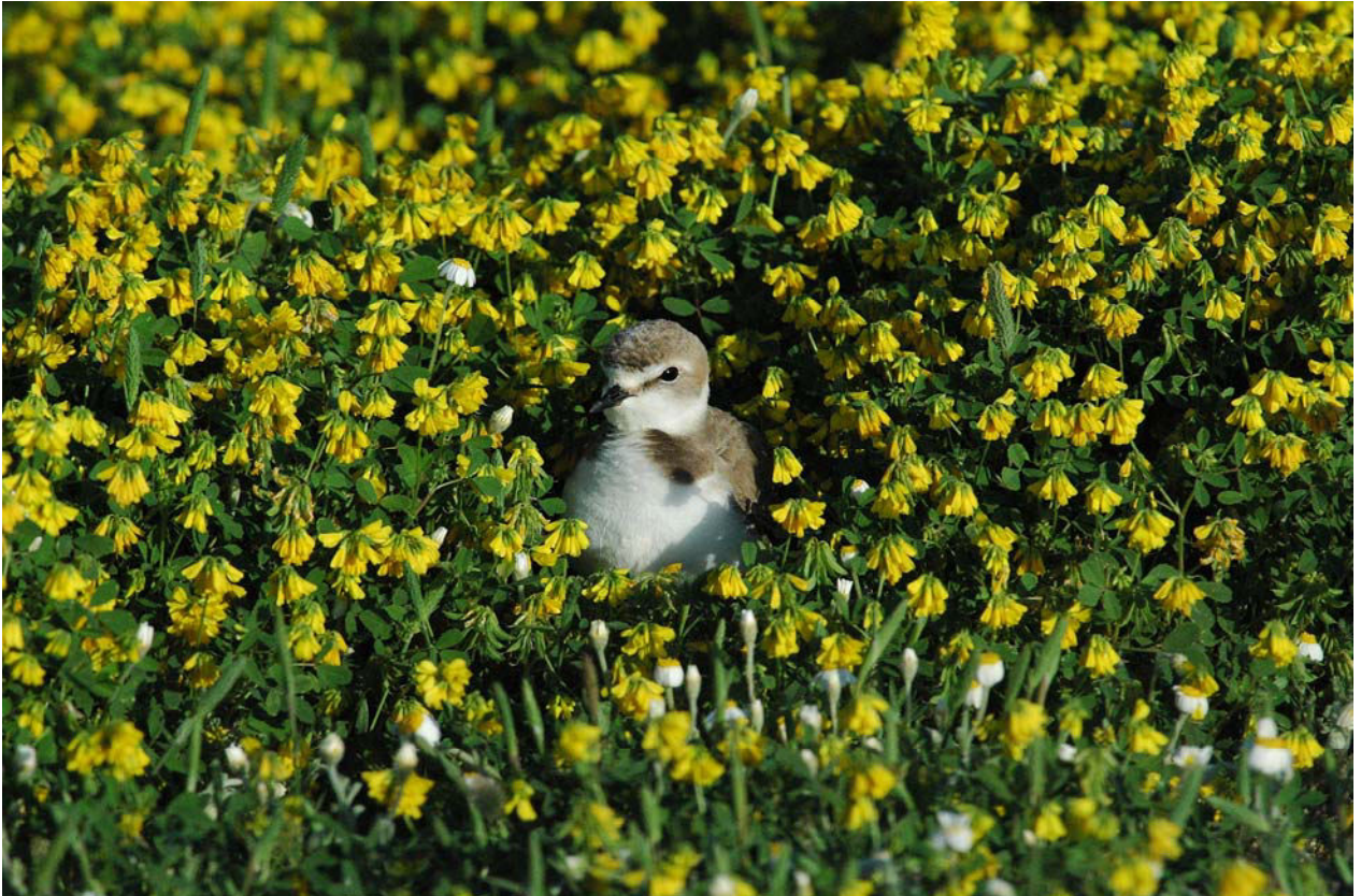
Seeregenpfeifer Weibchen auf dem Gelege im Bockshornklee am Strand vor der Saline von Skala Polichnitou 16.4.08