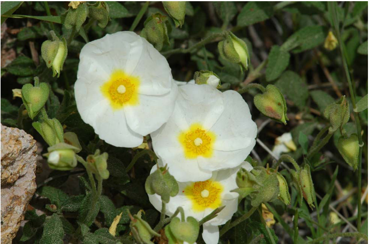
Salbeiblättrige Cistrose ( Cistus salvifolius ) 19.4.08