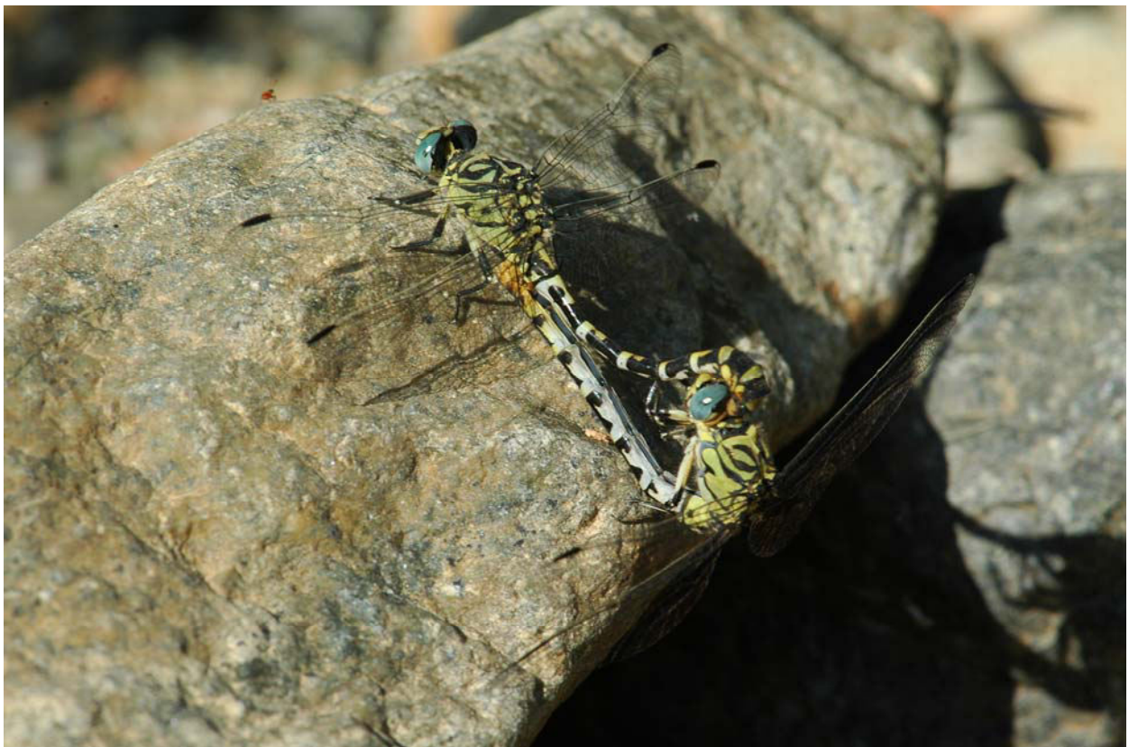
Kleine Zangenlibelle Onychogomphus forcipatus albotibialis 24.4.08 Tafel 5