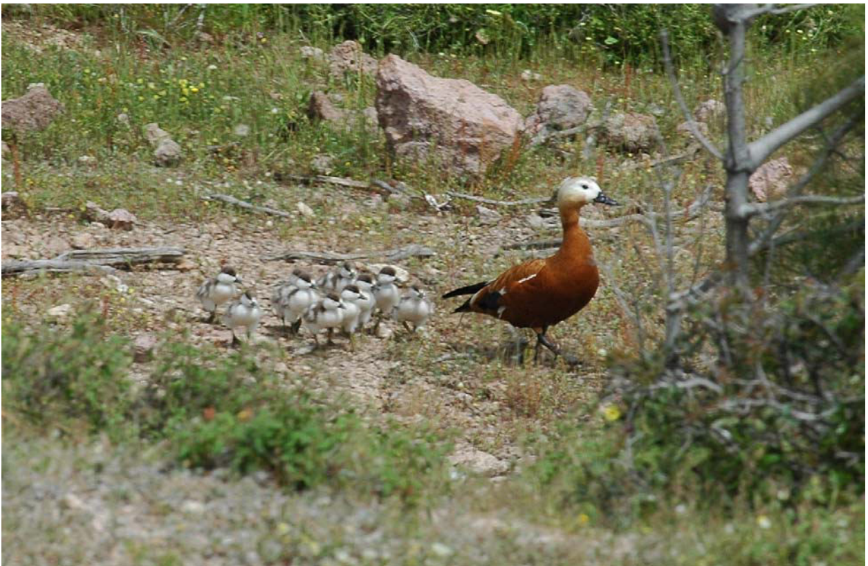
Rostgans Weibchen mit Jungen 19.4.08