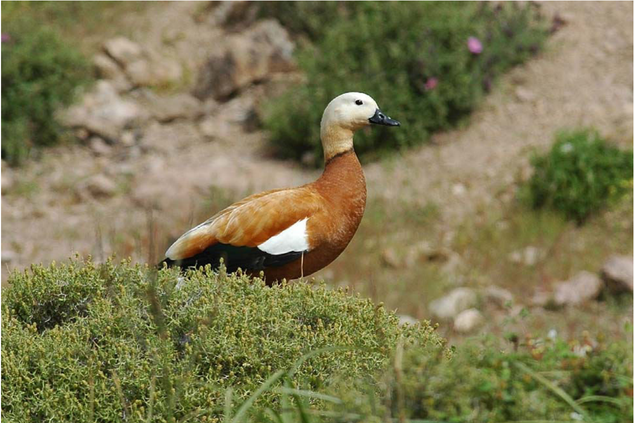
Rostgans Männchen 19.4.08