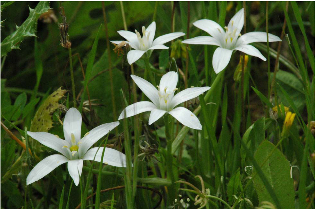
Dolden - Milchstern ( Ornithogalum umbellatum (?)) 13.4.08