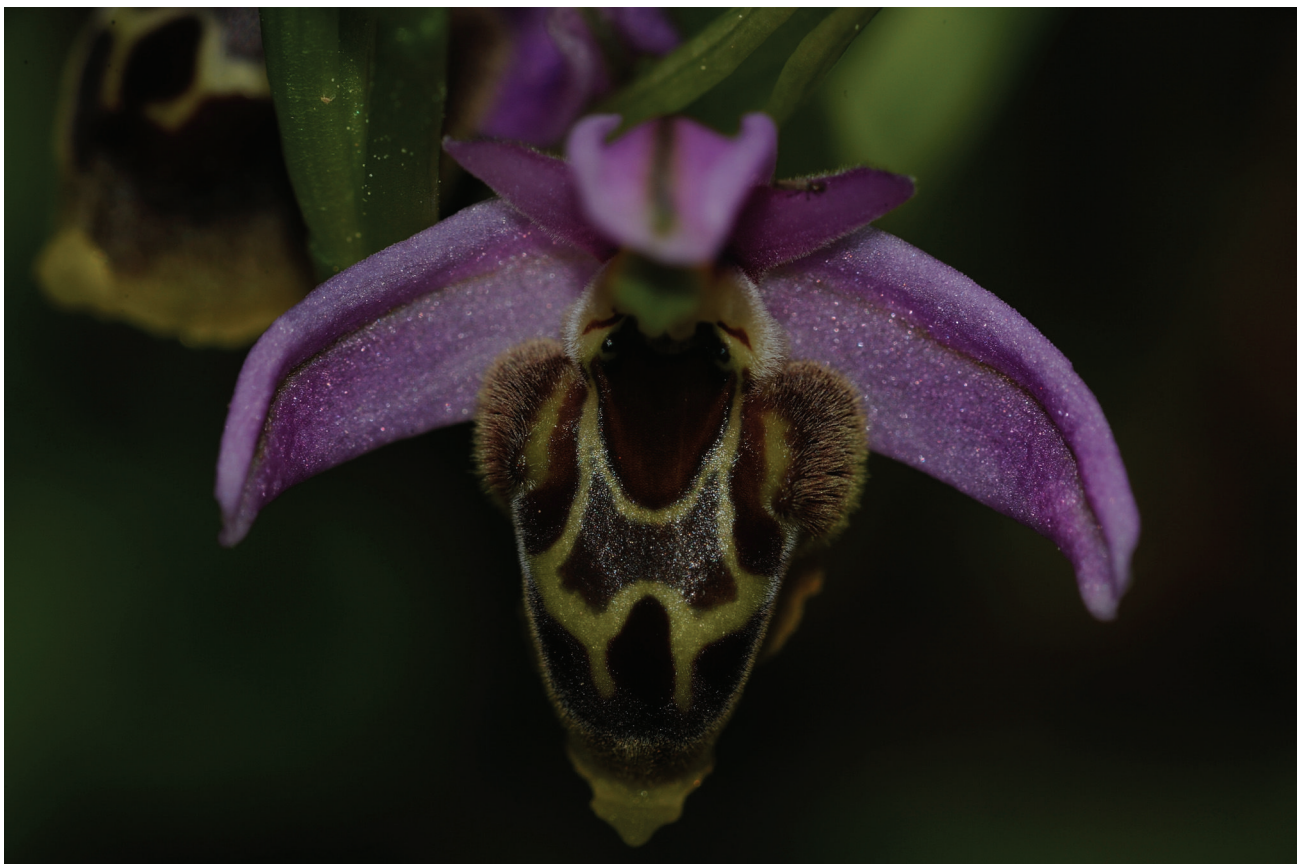
Ophrys phrygia (?) bei Neochori 18.4.2010