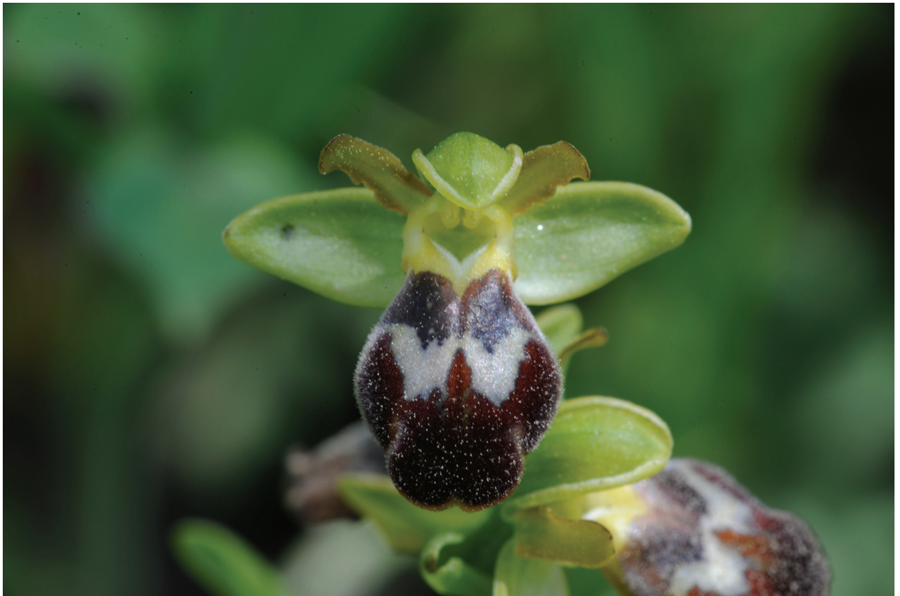
Ophrys omegaifera (Gruppe) bei Neochori 18.4.2010