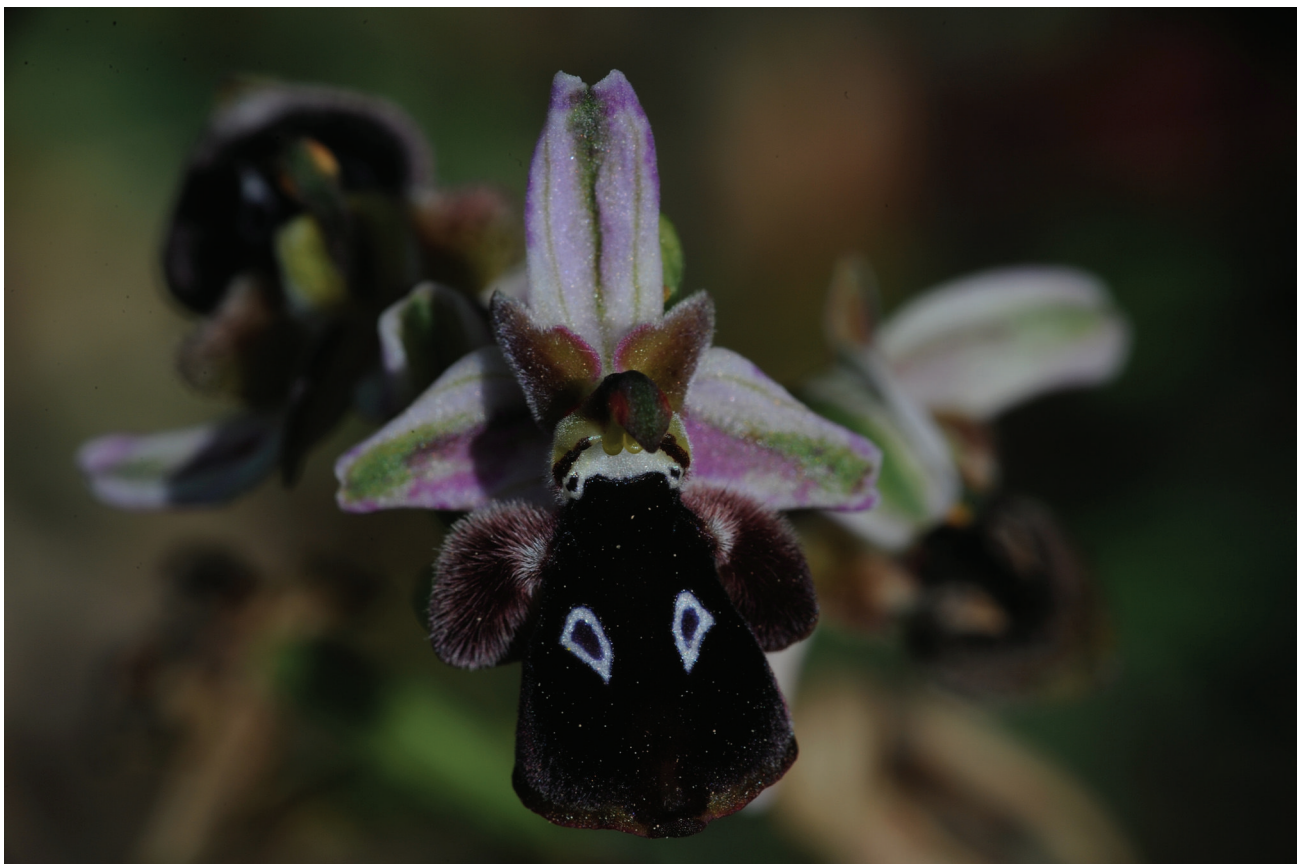
Orphrys reinholdii Reinholds Ragwurz bei Neochori 18.4.2010