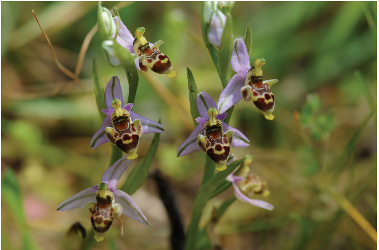
Ophrys oestrifera (Gruppe) bei Neochori 18.4.2010