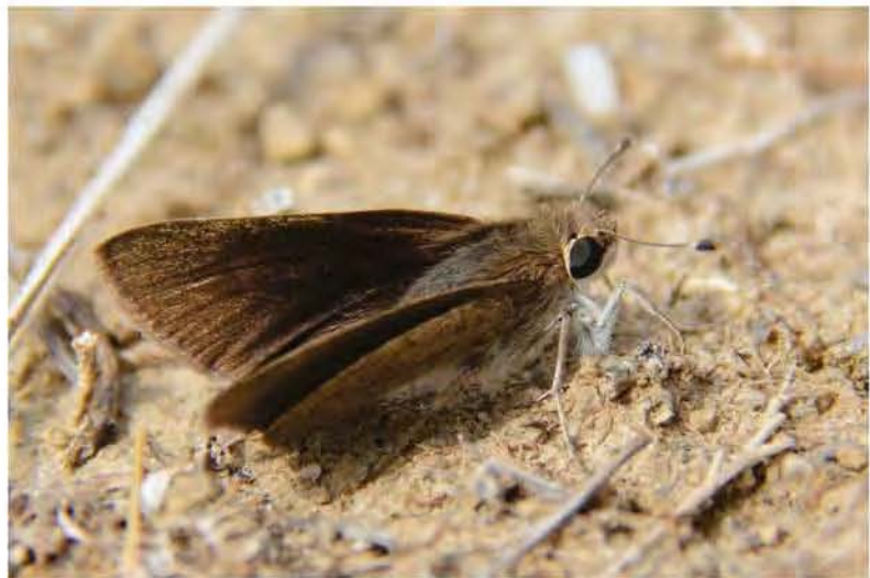
Gegenes nostradamus Männchen