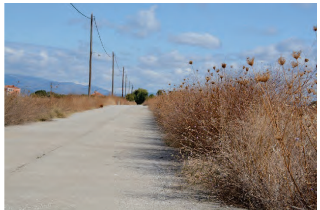
„Südl.“ Schuppenkopf Cephalaria transsylvanica nördl. Saline Polichnitou