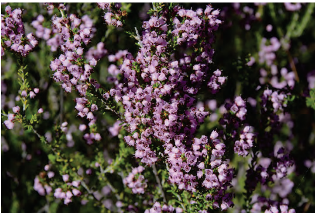
Quirlblättrige Heide Erica manipuliflora beim Megali Limni