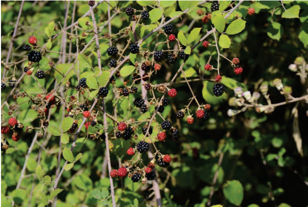
Mittelmeer-Brombeere Rubus ulmifolius Evergetoulas Bl.Brücke 3.10.14