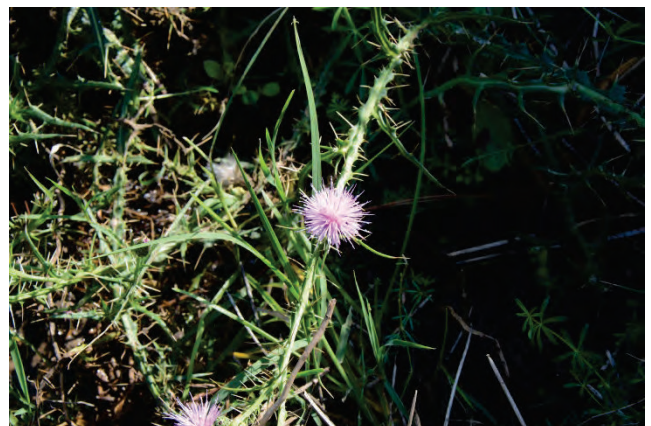
Kratzdistel Cirsium spec. Krioneri kleiner Teich 10.10.14