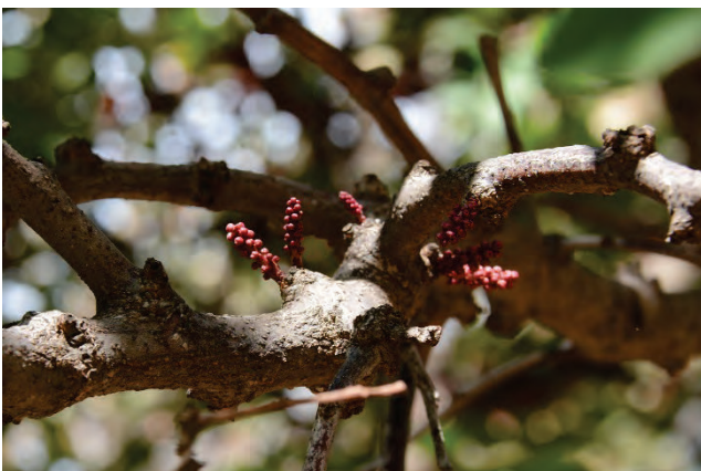
Johannisbrotbaum Ceratonia siliqua Ostseite Almiropotamos 28.9.14