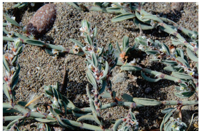
Strand-Knöterich Polygonum maritimum Tsihliotas Strand