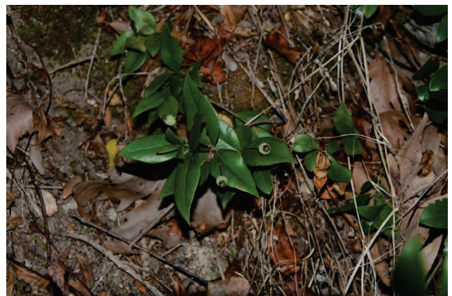
Myrte Myrtus communis oberhalb von Agiassos 2.10.14