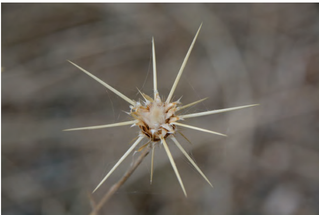
Sonnenwend-Flockenblume Centaurea solstitialis Kato Stavros