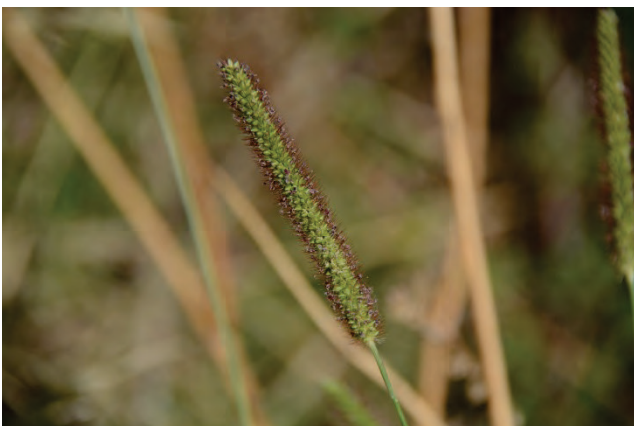
Borstenhirse Setaria spec. Golf von Gera Dipi Marsch 3.10.14