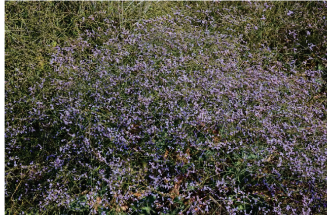
Gemeiner Strandflieder Limonium vulgare Dipi Marsch 3.10.14