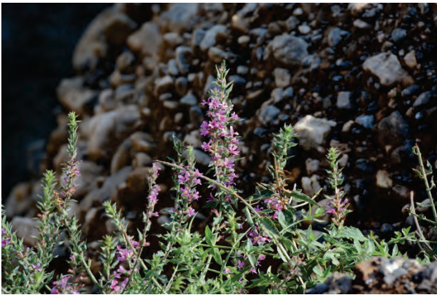
Ruten Gilbweiderich Lythrum junceum Unterlauf Evergetoulas 26.9.14