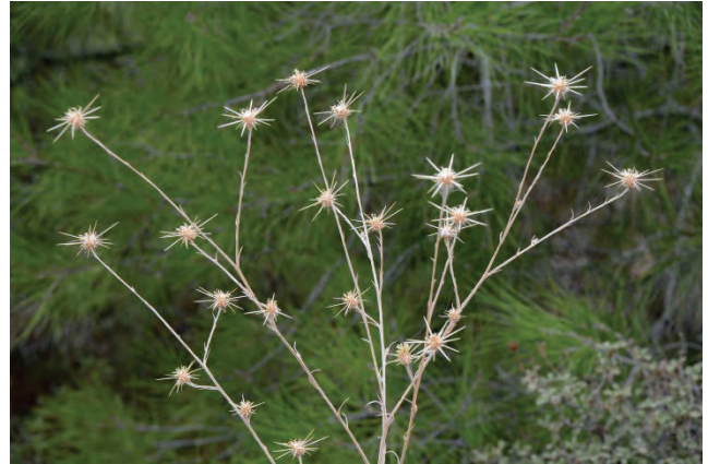
Sonnenwend-Flockenblume Centaurea solstitialis Kato Stavros