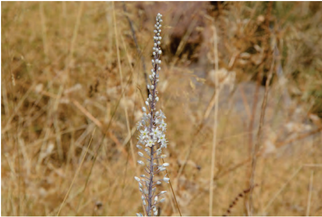
Gewöhnliche Meerzwiebel Drimia maritima Potamiatal