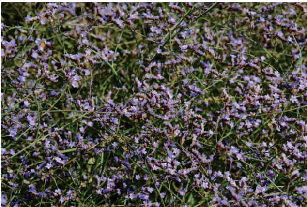
Gemeiner Strandflieder Limonium vulgare Dipi Marsch 3.10.14