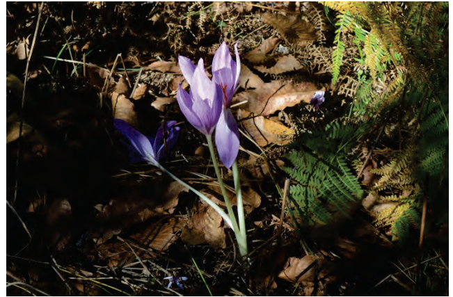
„Zauberhafte“ Herbstzeitlose Colchicum bivonae bei Agiassos 2.10.14