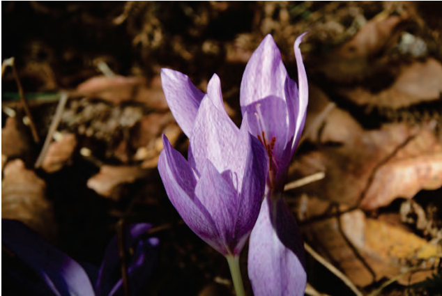
„Zauberhafte“ Herbstzeitlose Colchicum bivonae bei Agiassos 2.10.14