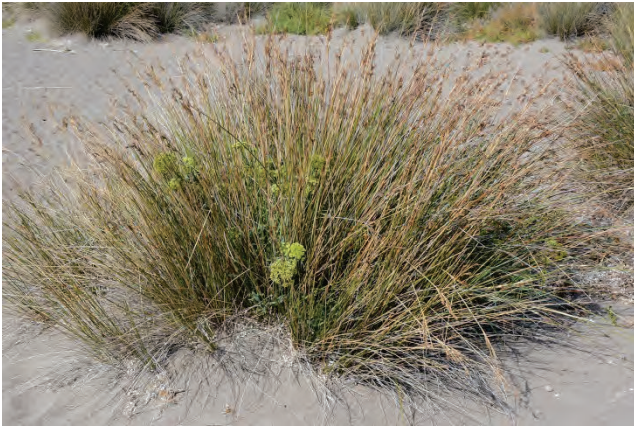
Meerfenchel Crithmum maritimum Tsihiotas Strand 7.10.14