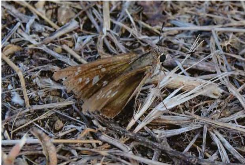
Pelopidas thrax Weibchen