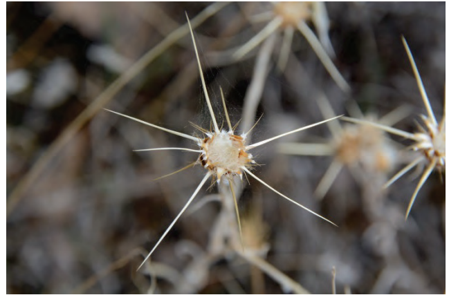
Sonnenwend-Flockenblume Centaurea solstitialis Kato Stavros