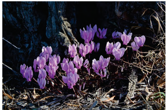
Griechisches Alpenveilchen Cyclamen graecum Asomatos