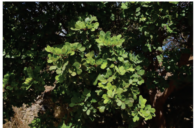
Johannisbrotbaum Ceratonia siliqua Ostseite Almiropotamos 28.9.14