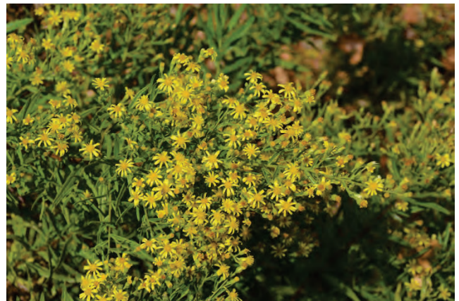
Klebriger Alant Dittrichia viscosa südlich Mikri Limni 8.10.14