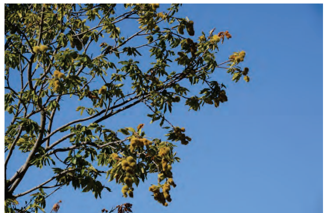
Esskastanie Castanea sativa oberhalb von Agiassos