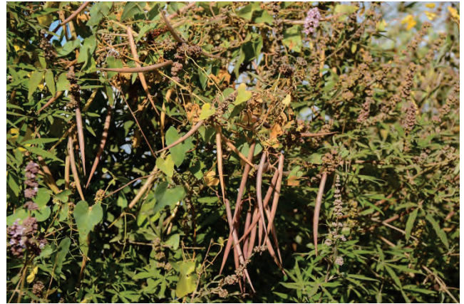
Lianen-Schwalbenwurz Cynanchium acutum Kalloni Ackerbau 27.9.14