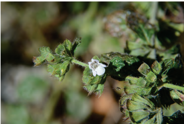
Melisse Melissa officinalis oberhalb von Agiassos 2.10.14