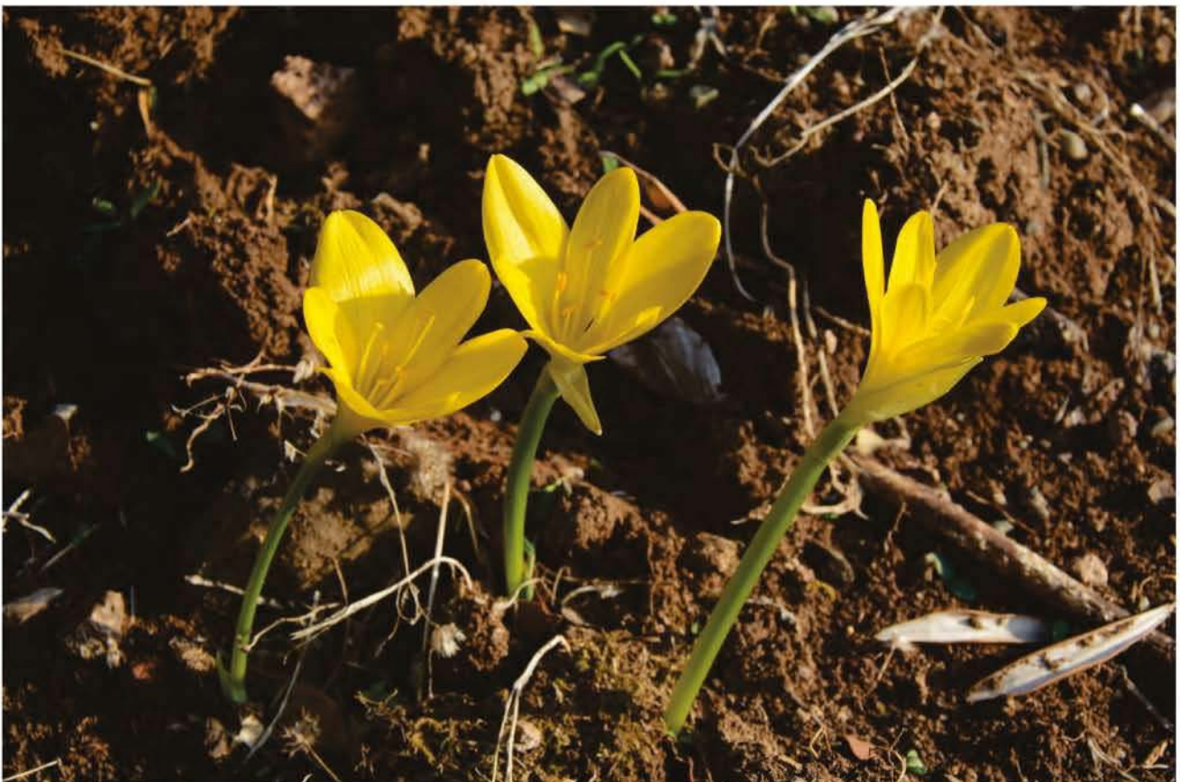
Herbst – Goldbecher Sternbergia lutea südöstlich von Polichnitos 8.10.2014 Tafel 2