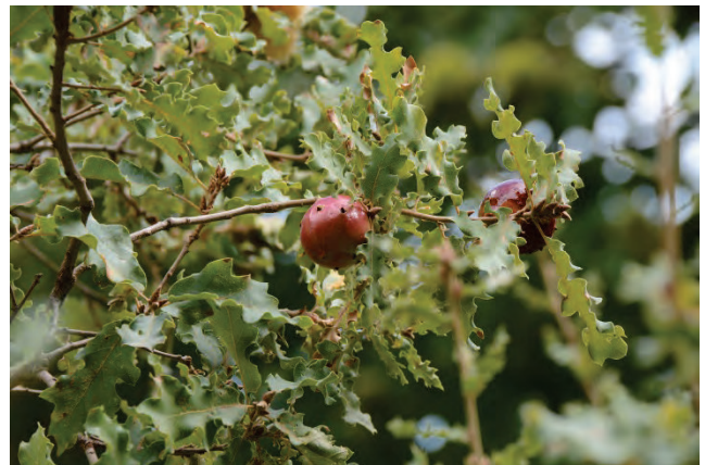
„Lesbos“-Eiche Quercus infectoria oberhalb Parakila