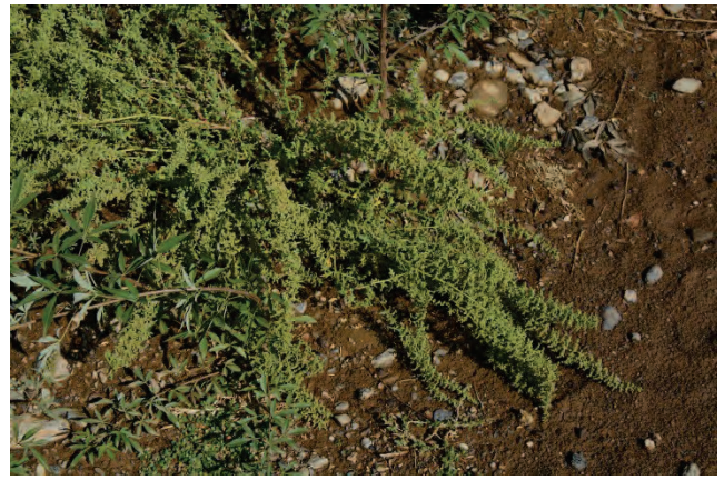
Unterlauf Evergetoulas 26.9.14