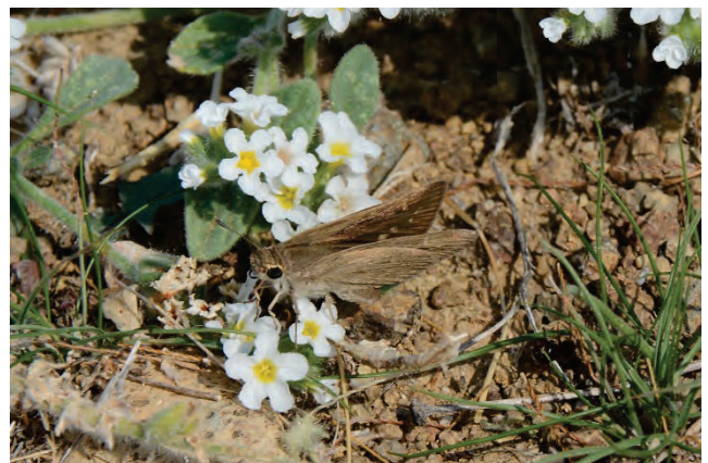
Behaarte Sonnenwende Heliotropicum hirsutissimum Petra 4.10.14