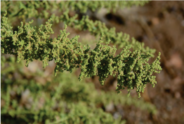
Unterlauf Evergetoulas 26.9.14