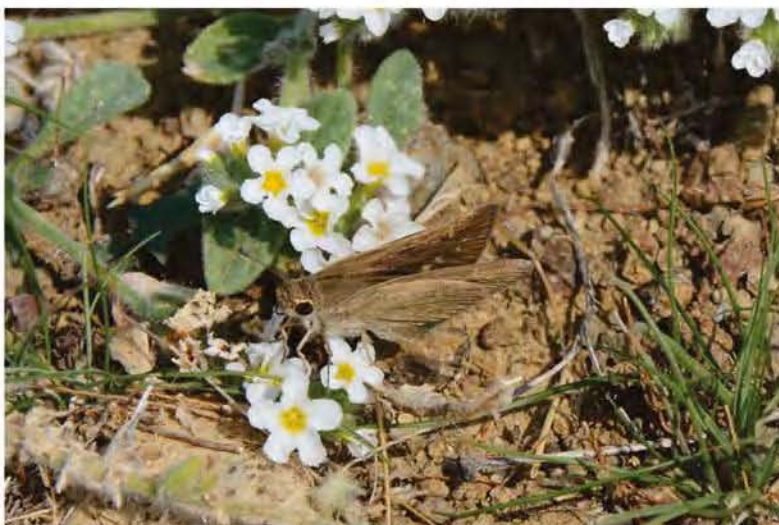
Gegenes nostradamus Weibchen

4. Oktober 2014 Aussichtspunkt auf halber Strecke zwischen Petra und Molivos