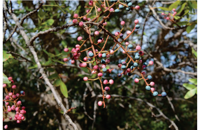
Terpentinpistazie Pistacia terebinthus Ostseite Almiropotamos 28.9.14