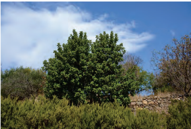
Johannisbrotbaum Ceratonia siliqua Ostseite Almiropotamos 28.9.14