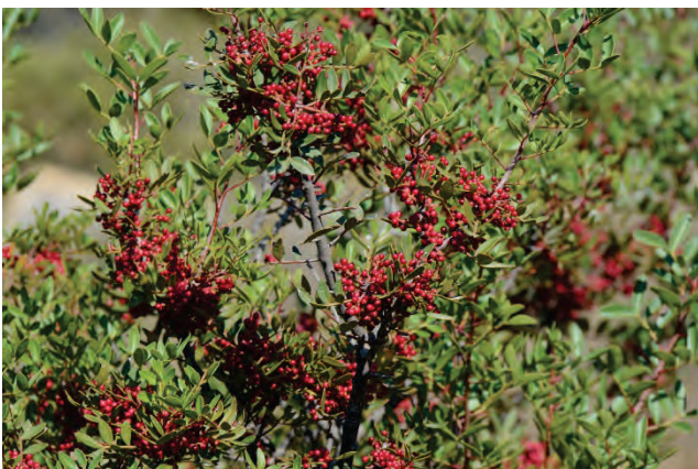
Mastixstrauch Pistacia lentiscus Krioneri 9.10.14