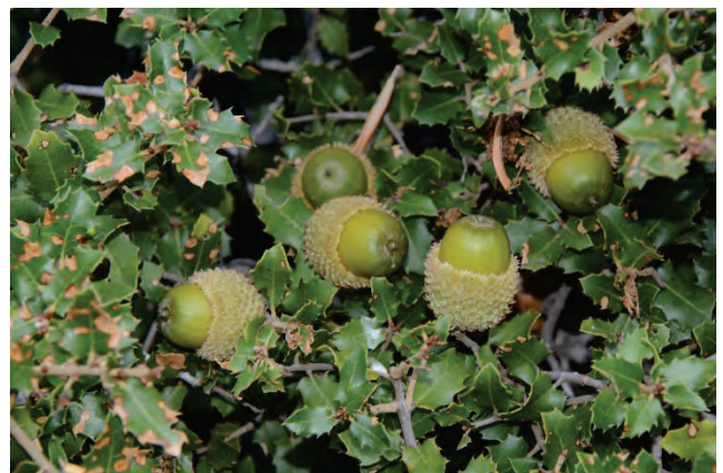
Kermes-Eiche Quercus coccifera Potamiatal 29.9.14