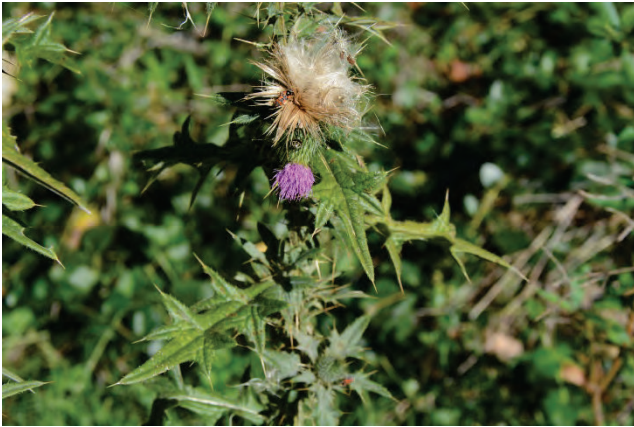
Lanzettblättrige Kratzdistel Cirsium vulgare oberhalb Agiassos 2.10.14