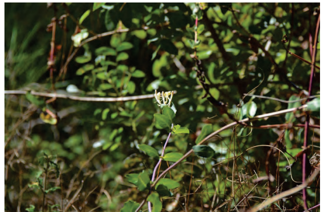
Windendes Geißblatt Lonicera implexa oberhalb von Agiassos 2.10.14