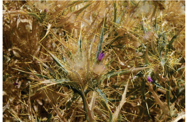
Akarna-Kratzdistel Picnemon acarna Kloster Damandriou