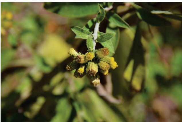
oberhalb von Agiassos 2.10.14