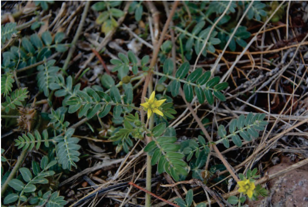
Erdburzeldorn Tribulus terrestris Mikri Limni 8.10.14