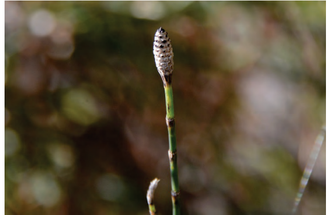
Verzweigter Schachtelhalm Equisetum ramosissimum südlich Mikri Limni