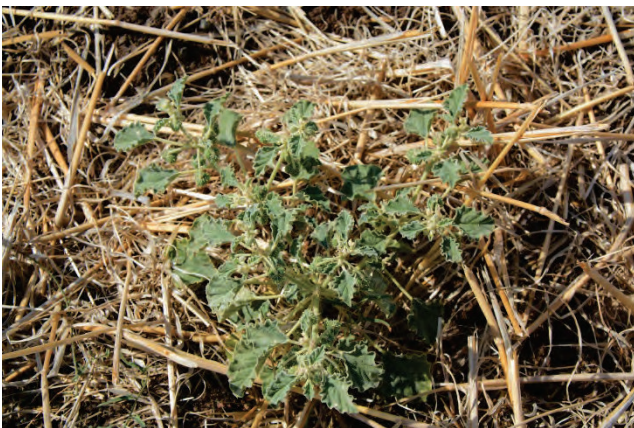
Lackmuskraut Chrozophora tinctoria nördlich Saline Polichnitou 27.9.14