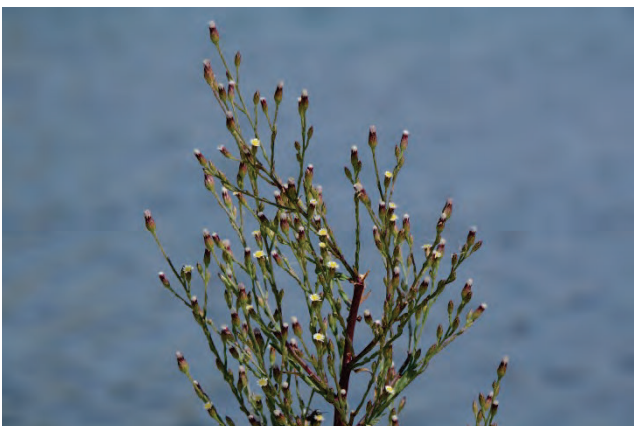
Kanadisches Berufkraut Conyza canadensis Tsihliotas Strand