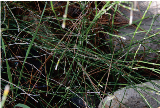
Verzweigter Schachtelhalm Equisetum ramosissimum südlich Mikri Limni