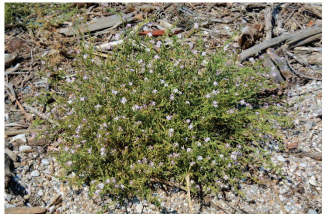
Meersenf Cakile maritima Golf von Gera Dipi Marsch 3.10.14