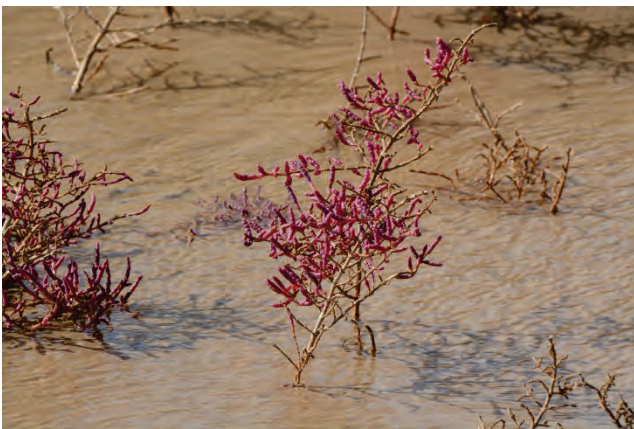
„Queller“ Salicornia europaea