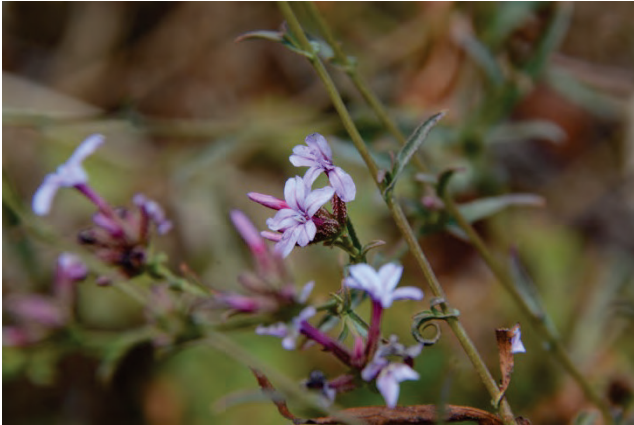
Europäische Bleiwurz Plumbago europaea Almiropotamos 28.9.14