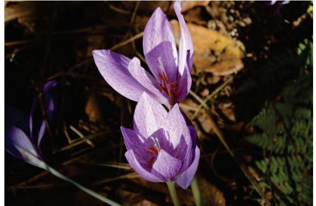
„Zauberhafte“ Herbstzeitlose Colchicum bivonae bei Agiassos 2.10.14