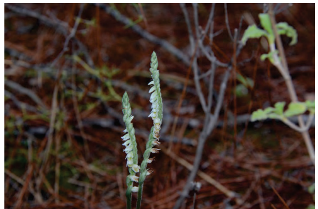
Herbst-Drehwurz Spiranthes spirales Achladeri Creek