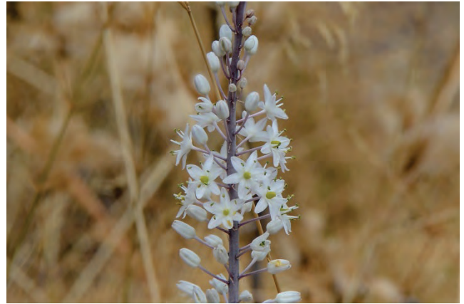
Gewöhnliche Meerzwiebel Drimia maritima Potamiatal