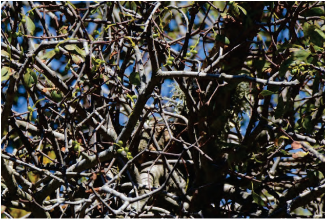
Eichen-Mistel Loranthus europaeus oberhalb von Agiassos 2.10.14