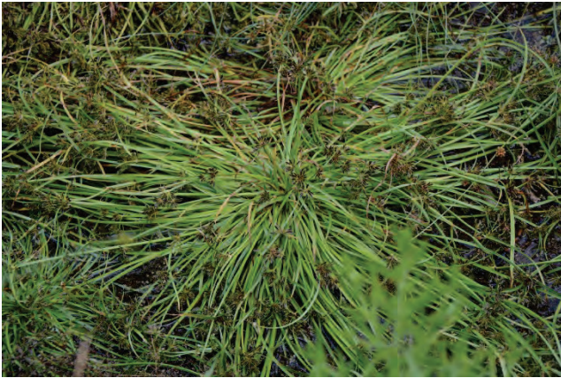
Braunes Zypergras Cyperus fuscus Vouvaris/Achladeri Creek 27.9.14