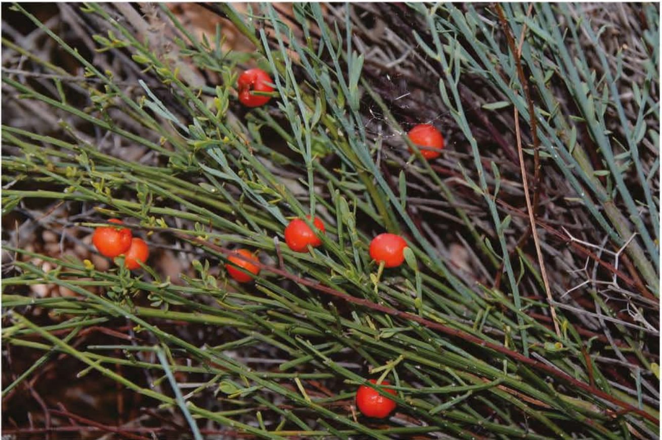
Honigduftender Rutenstrauch Osyris alba südlich vom Mikri Limni 8.10. 14