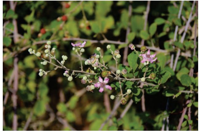
Mittelmeer-Brombeere Rubus ulmifolius Evergetoulas Bl.Brücke 3.10.14