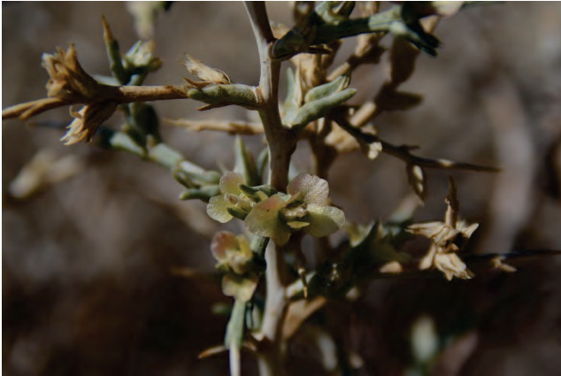
Noaea Noaea mucrunata Kloster Ipsilou