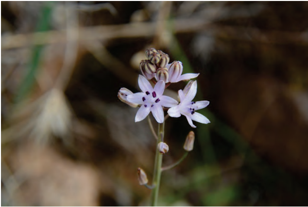
Herbst-Blaustern Scilla autumnalis nördlich Petra