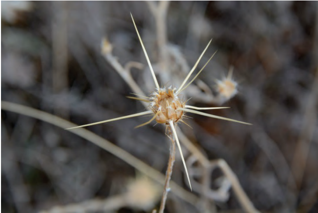
Sonnenwend-Flockenblume Centaurea solstitialis Kato Stavros