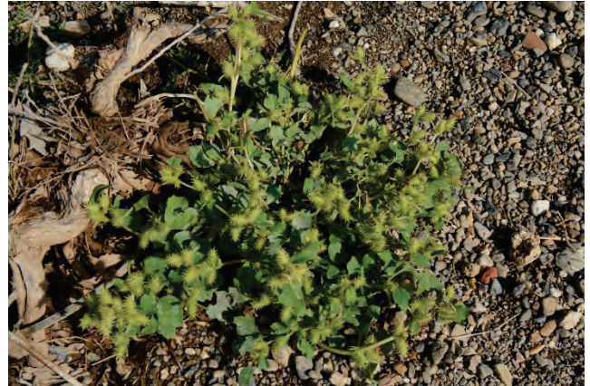
Italienische Spitzklette Xanthium strumarium-italicum Evergetoulas