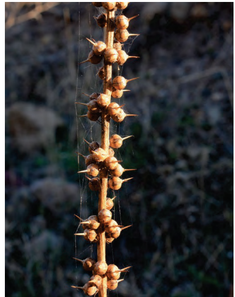
Eindrucksvolle Fruchtstände vom Purpur – Gilbweiderich Lysimachia atropurpurea