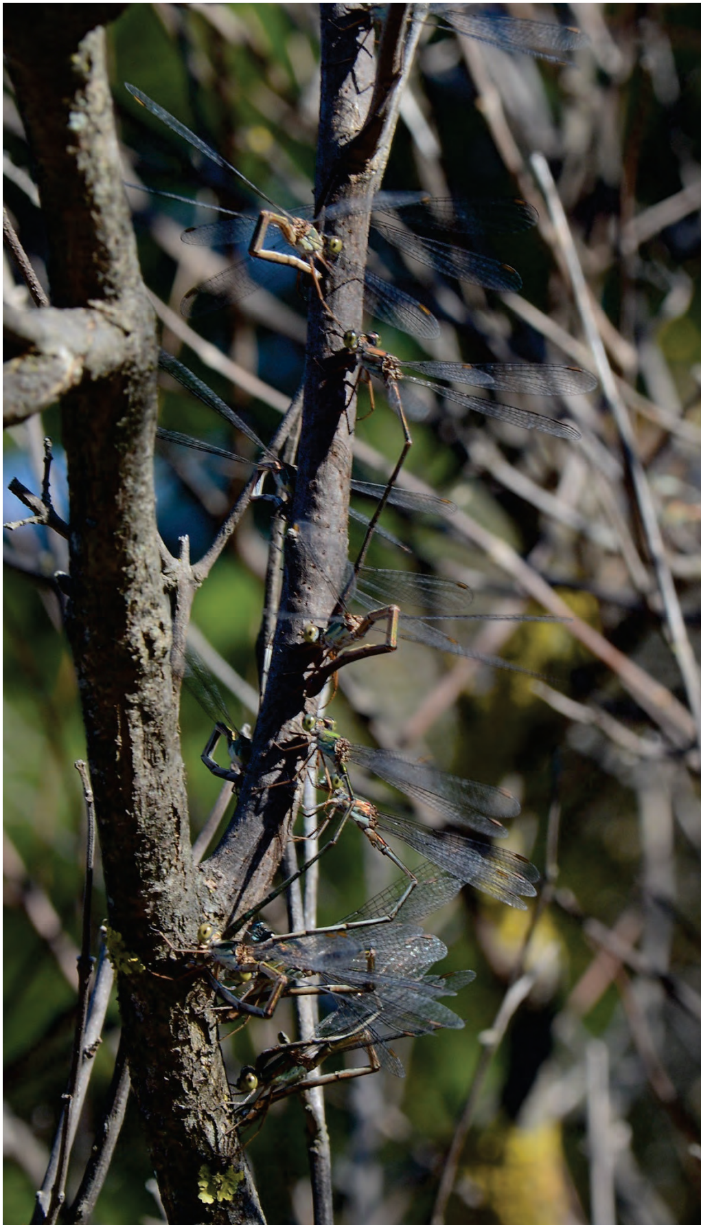
Lestes parvidens Massen-Eiablage am Mikrilimni 4.11.15