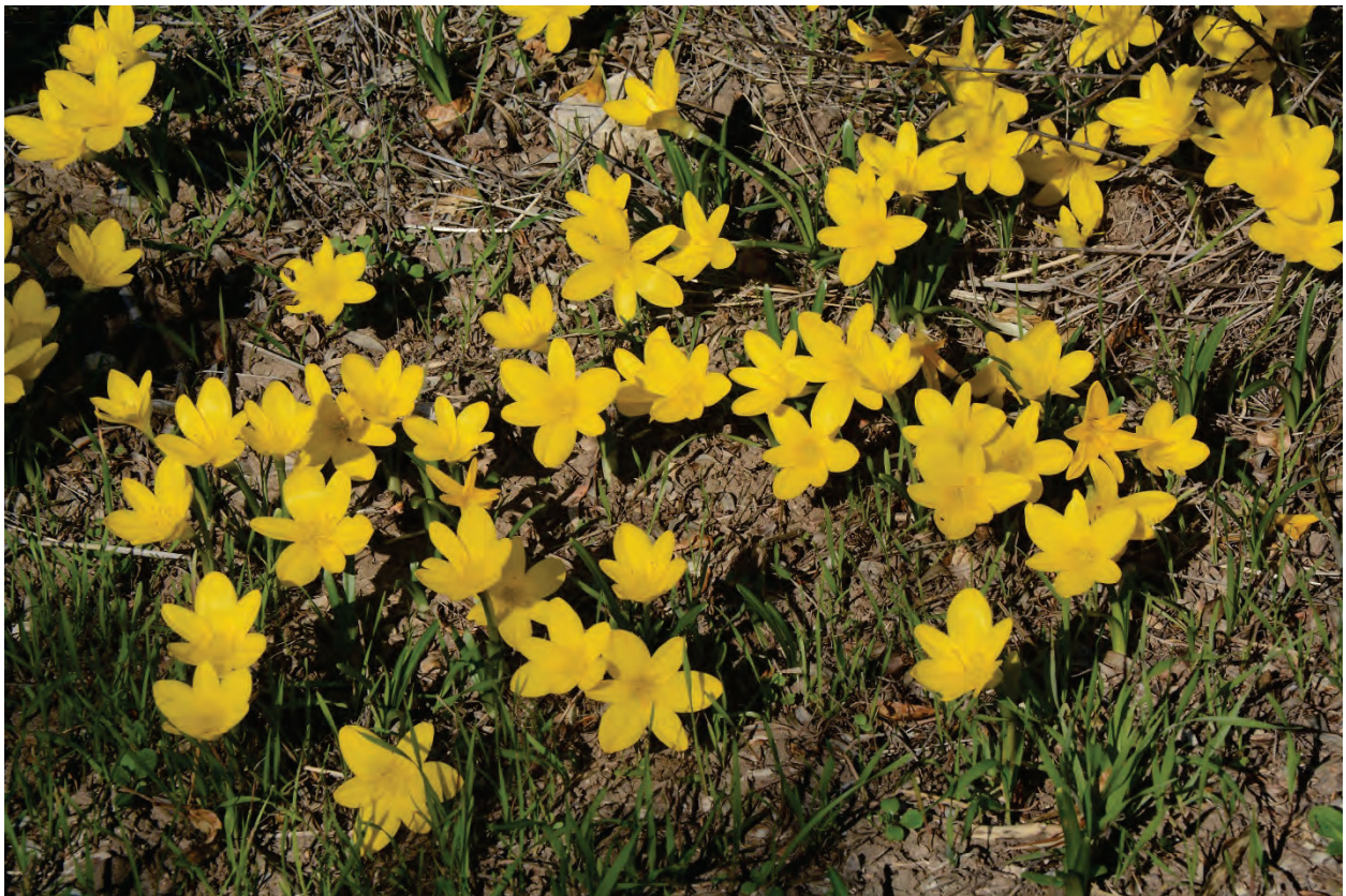
Herbst – Goldbecher Sternbergia lutea