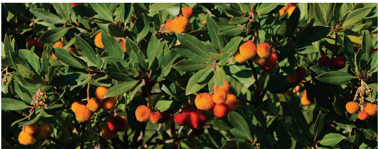
Gemeiner Erdbeerbaum Arbutus unedo