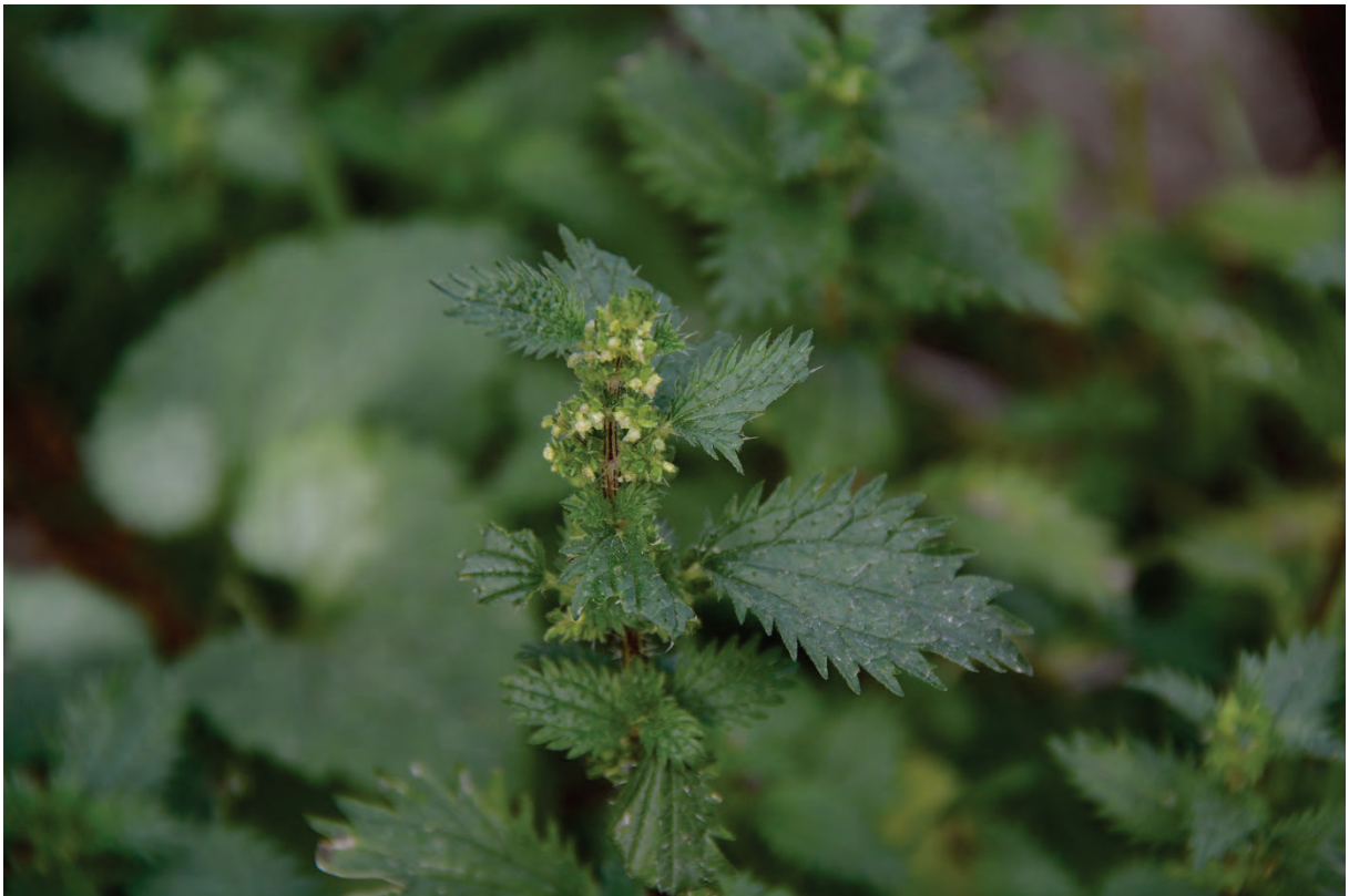
Kleine Brennessel Urtica urens