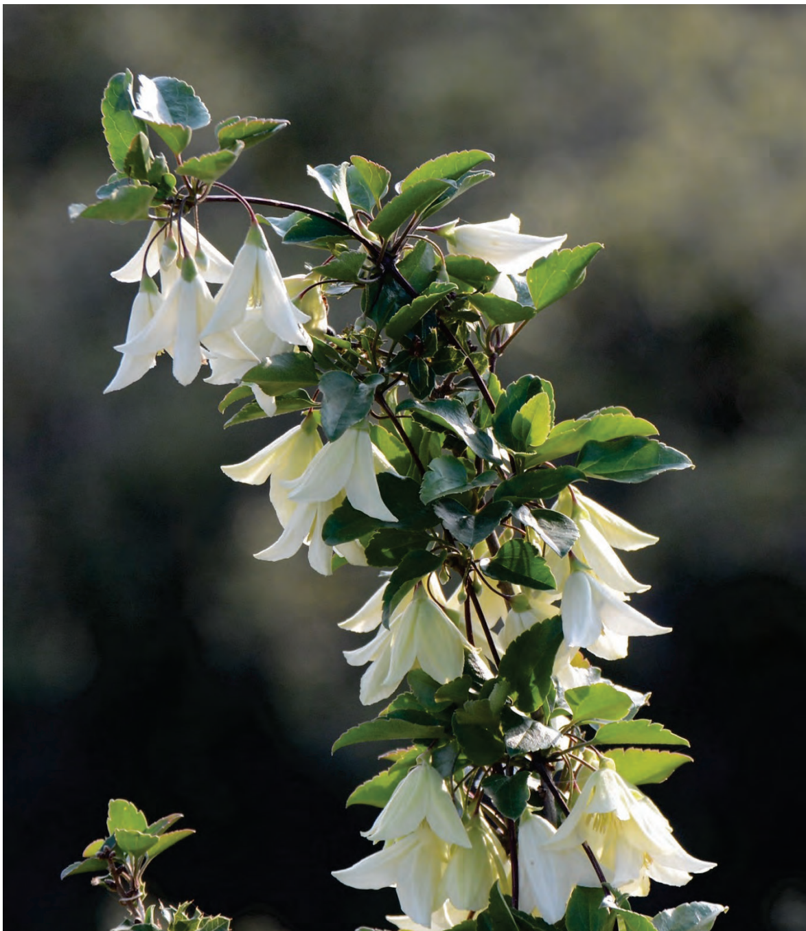
Rankende Waldrebe Clematis cirrhosa