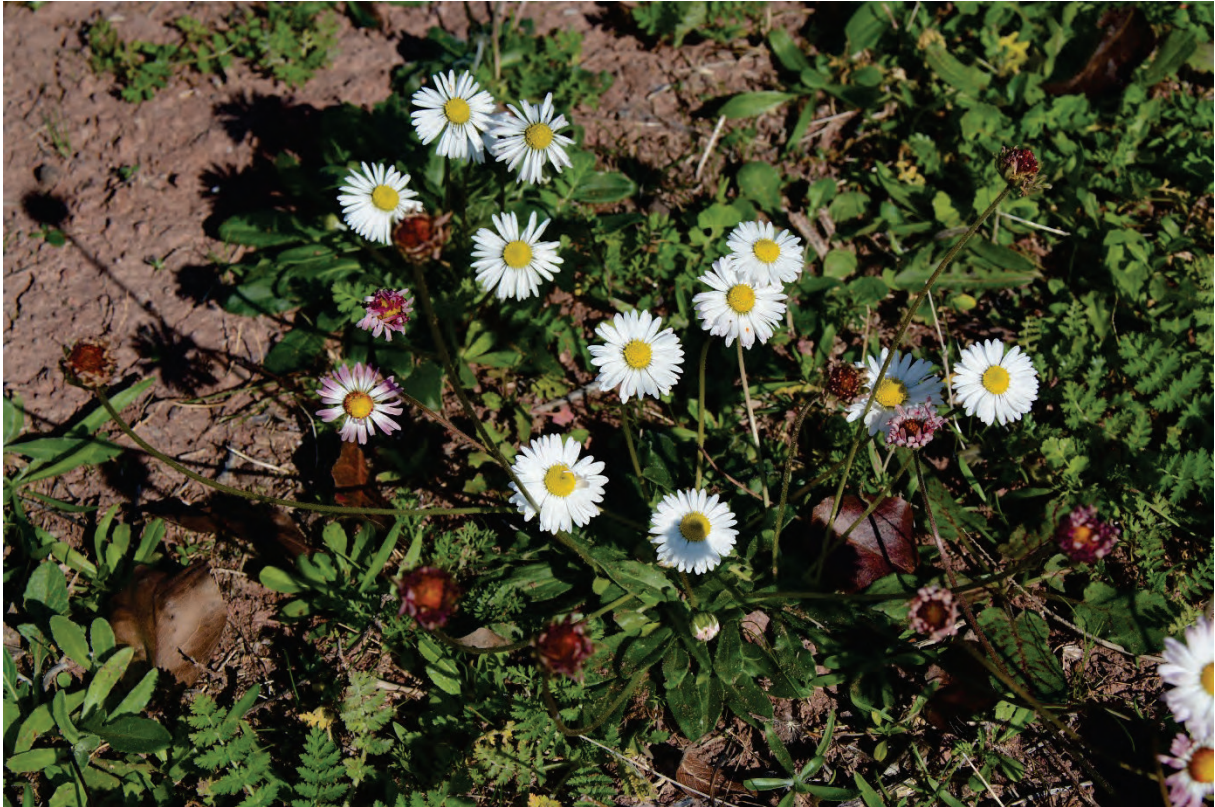
erste Gänseblümchen-Pracht, die in den nächsten Tagen in vielen Bereichen erscheint