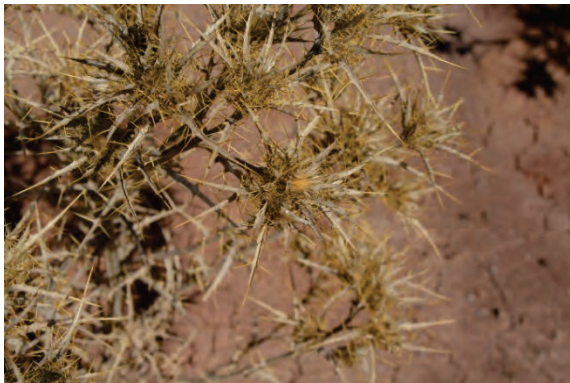
Syrische Kratzdistel Notobasis syriaca