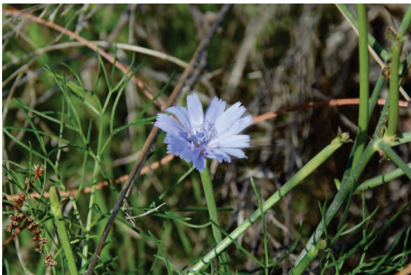
Wegwarte Cichorium intibus