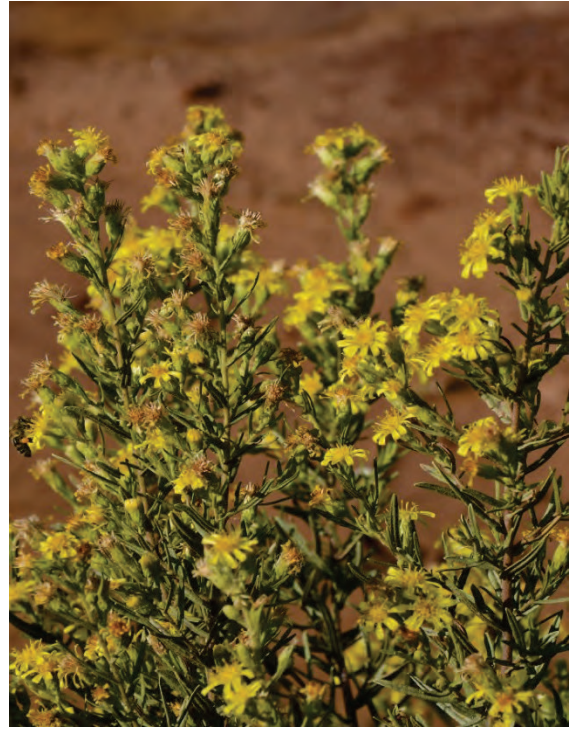
Klebriger Alant Dittrichia viscosa