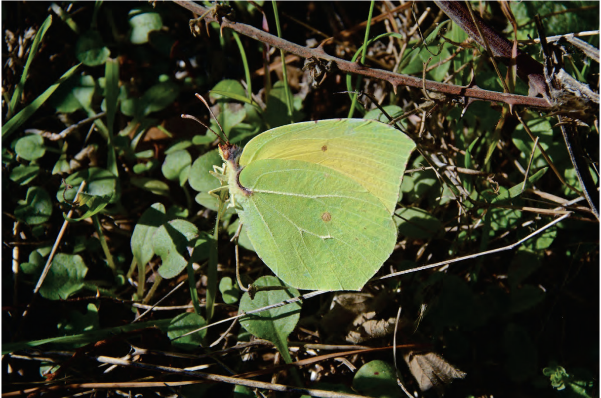
Ganz frisch: Gonepteryx cleopatra unterhalb Steilwand Olymp 9.11.15