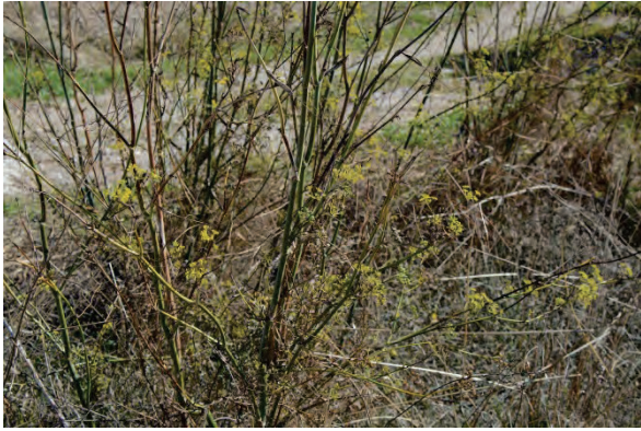
Wilder Fenchel Foeniculum vulgare