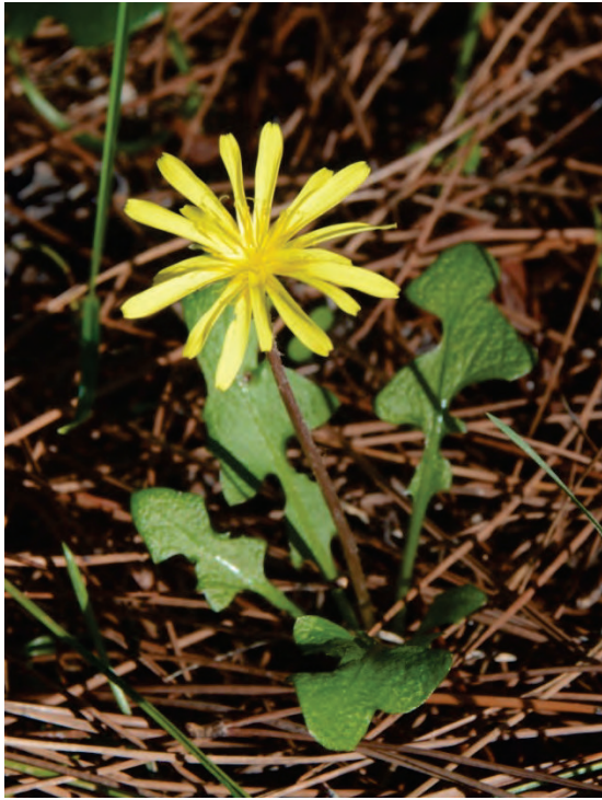
Ein Löwenzahn Taraxacum ?