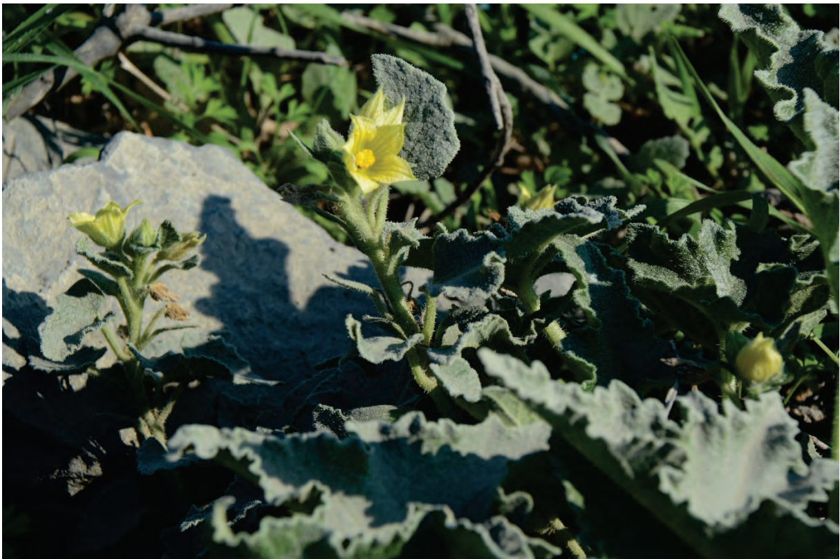
Spritzgurken Ecballium elaterium blühen an vielen Stellen