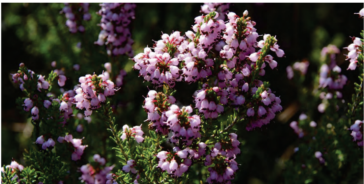
Quirlblättrige Heide Erica manipuliflora