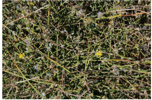
Ruten – Knorpellattich Chondrilla juncea