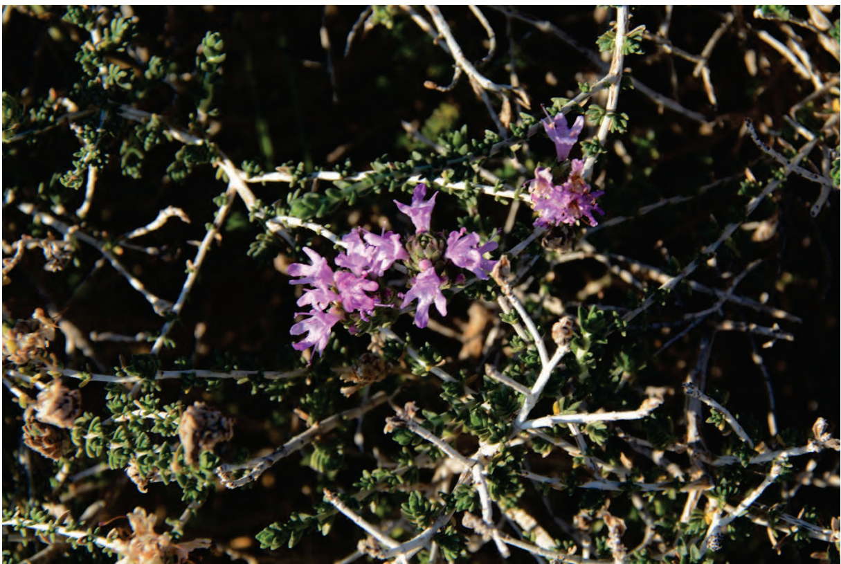
Kopfiger Thymian Corydorthymus capitatus