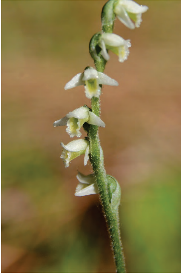
Herbst – Drehwurz Spiranthes spirales