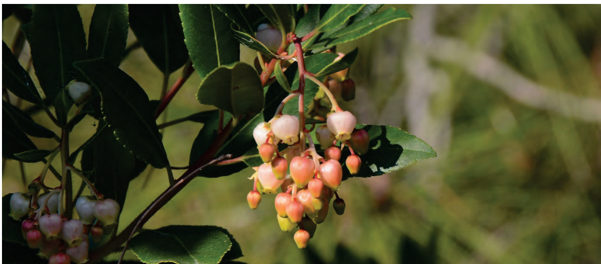
Gleichzeitig blüht und fruchtet