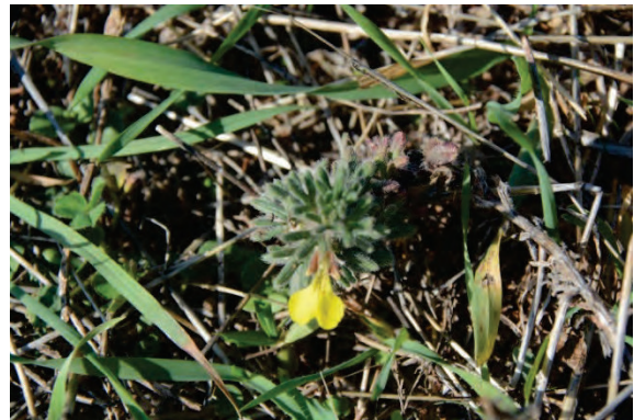
Gelber Ackergünsel Ajuga chamaepitys