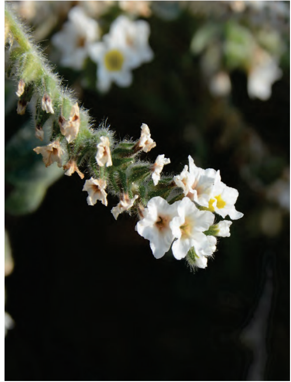
Behaarte Sonnenwende Heliotropium hirsutissimum