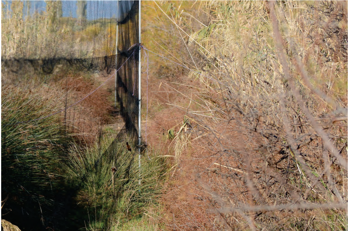
Fanganlage in der Dipi Marsch mit zwei gefangenen Mariskensängern