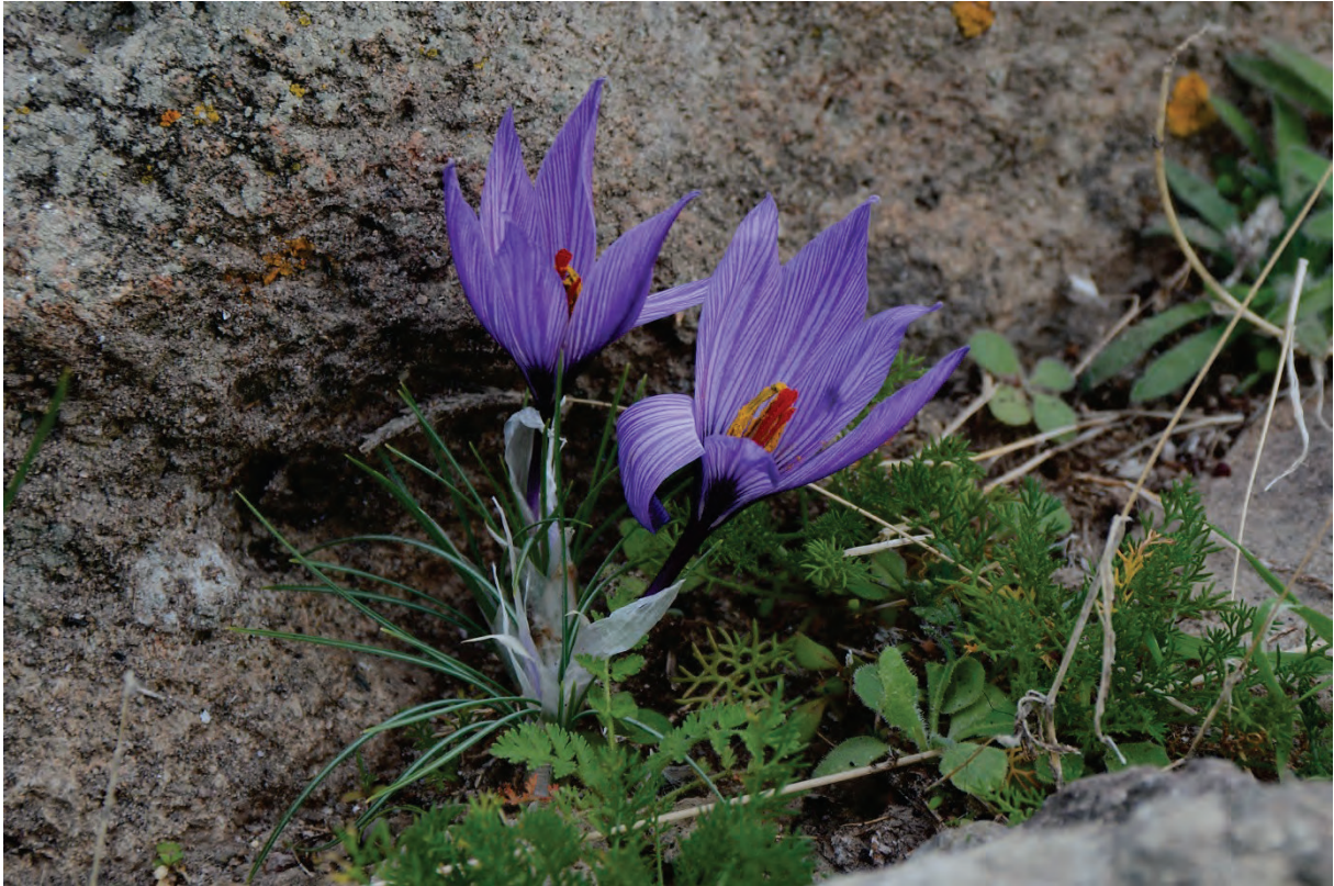
Pallas - Krokus Crocus pallasii