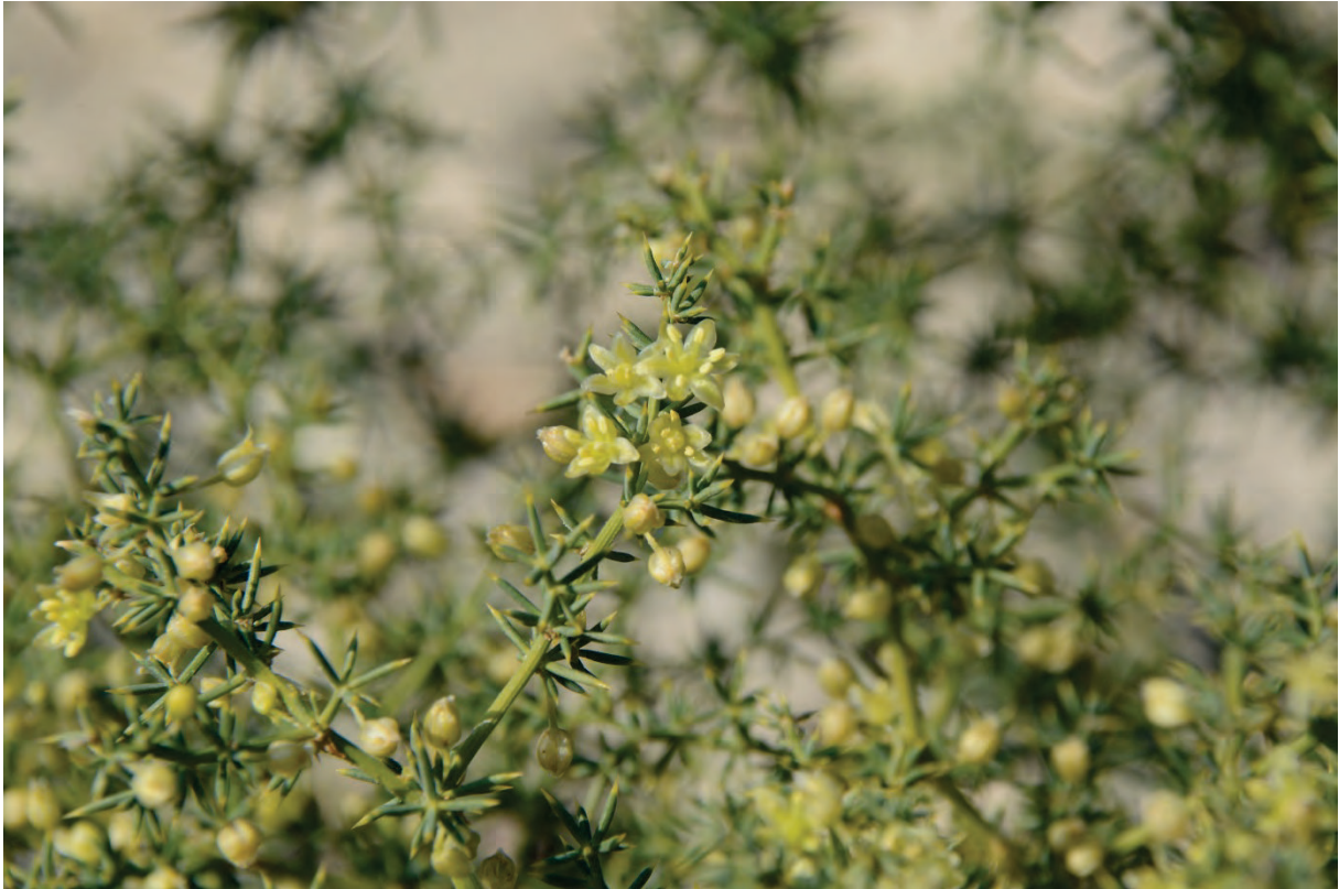
Stechender Spargel Asparagus acutifolius