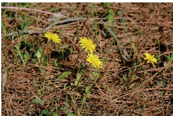
Löwenzahn oder Herbstlöwenzahn ?