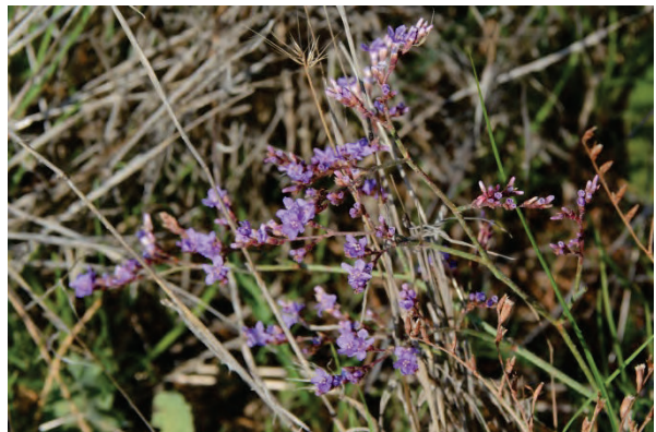
Gemeiner Strandflieger Limonium vulgare 5. Nov.