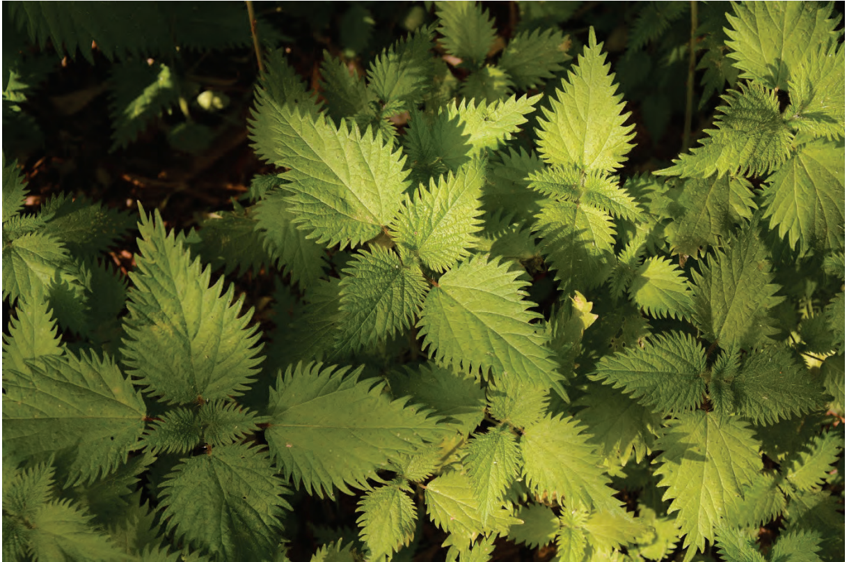
„nur“ Brennesseln, frisches Grün, eine Augenweide