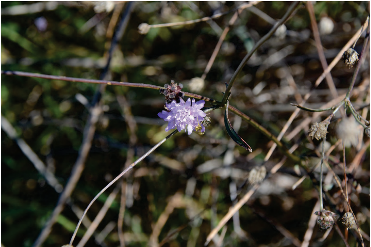
Südlicher Schuppenkopf Cephalaria transsylvanica