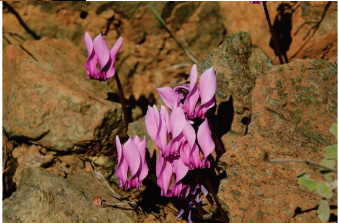
Griechisches Alpenveilchen Cyclamen graecum