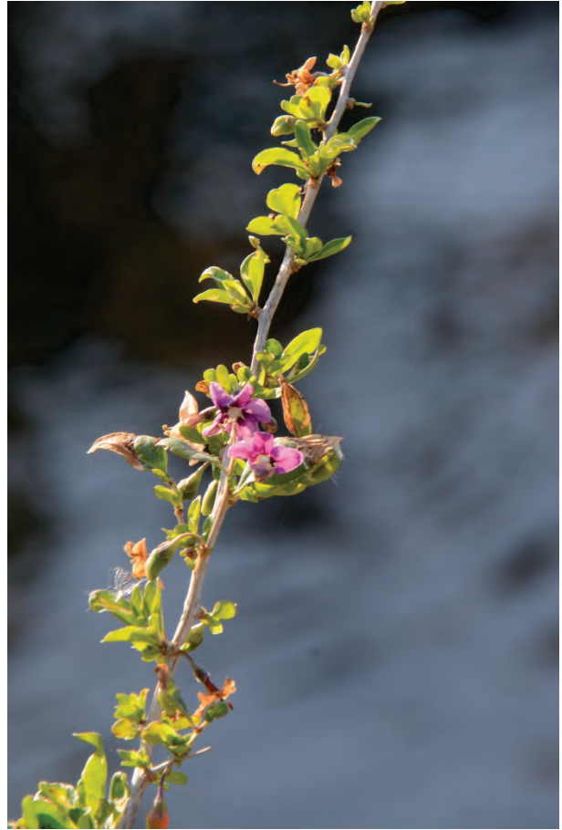
Chinesischer Bocksborn Lycium barbarum