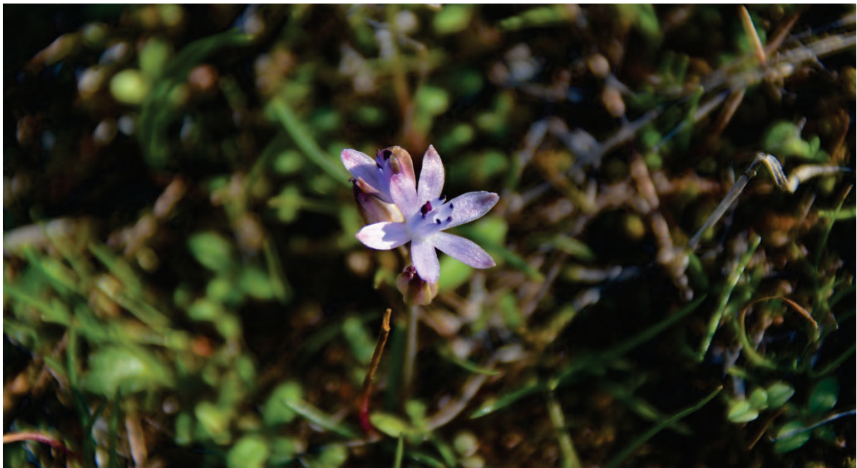
Herbst – Blaustern Scilla autumnalis