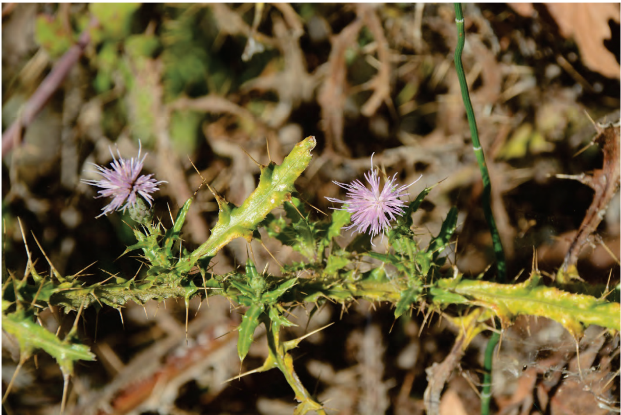
Kretische Kratzdistel Cirsium creticum ?