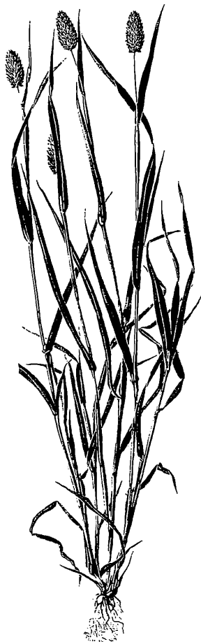
Kanariengras ( Phalaris canariensis L.)

Unter "74. Gymnigritella x heufleri " muss es heißen: " 74. Gymnigritella x suaveolens (= Gymnadenia conopsea x Nigritella rhelicani ; laut Auskunft Gschwend) "