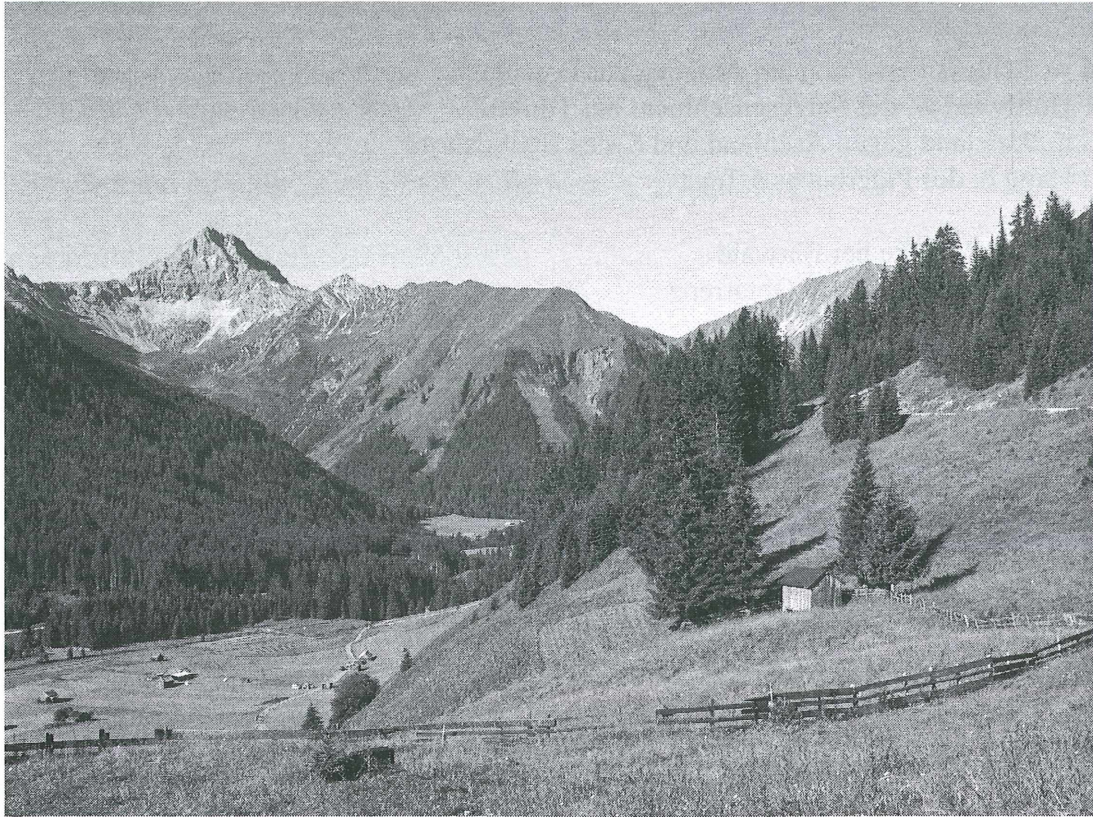
Kelmener Tal mit Namloser Wetterspitze