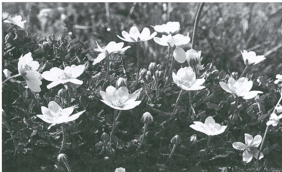
Silberwurz Dryas octopetala