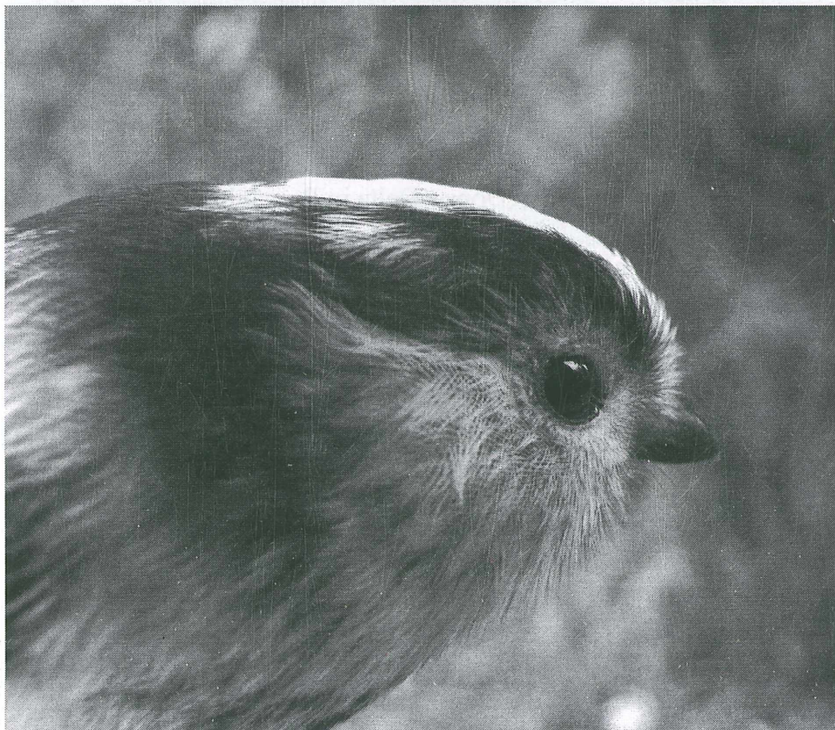
Schwanzmeise ( Aegithalos caudatus , Fängling)