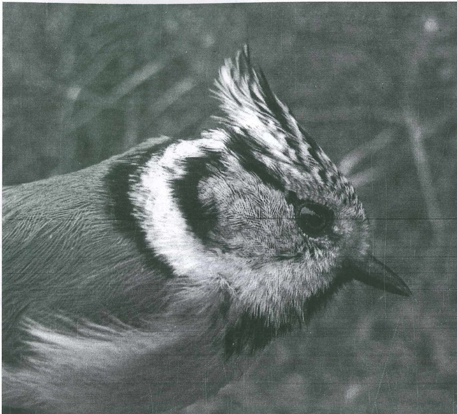
Haubenmeise ( Parus cristatus , Fängling)