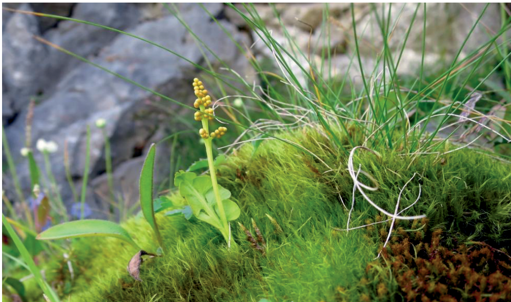
Echte Mondraute – Neunerköpfe – 12.8.21 – (Johann Bauer)

Aa-Ti: 8529/11: Neunerköpfe bei Tannheim, Gipfelnähe (Ba 12.8.21)