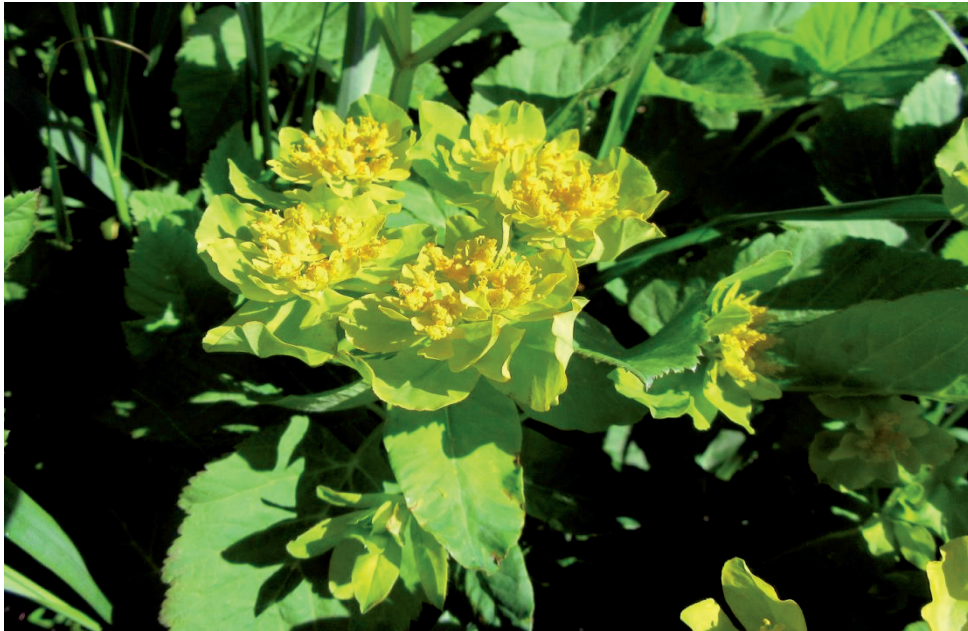
Vielfarbige Wolfsmilch – Ruderatshofen – 28.5.21 – (Johann Bauer)

Ho: 8129/3: Einzelne Pflanzen am S Bahndamm W Ruderatshofen (Ba 28.5.21)