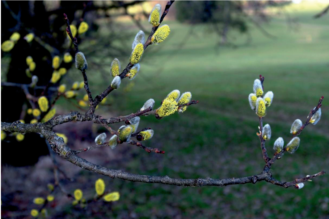
Filzast-Weide – Fechsen / Etwiesen – 10.3.21 – (Johann Bauer)

Ho: 8229/41: Feldhecke zwischen Fechsen und Etwiesen (Ba 7.3.21)