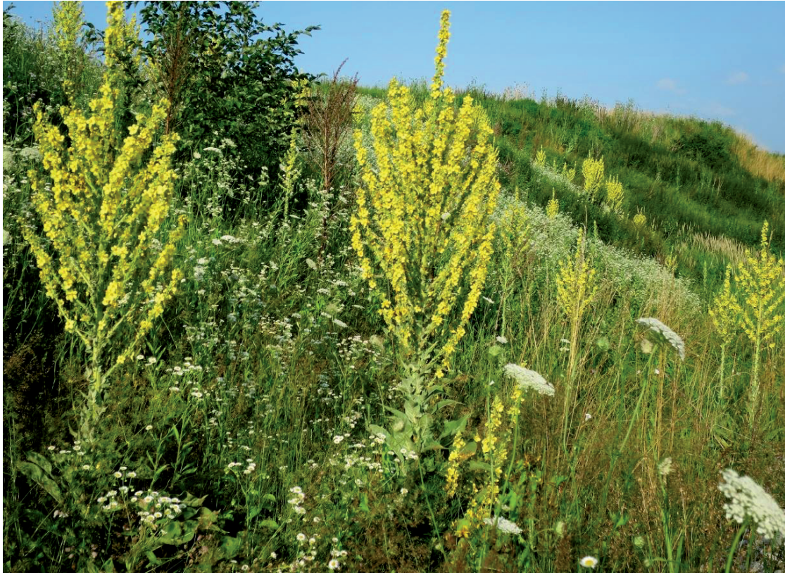
Pracht-Königskerze – Marktoberdorf-Schweinberg – 20.7.21 – (Johann Bauer)

Ho: (Grenzgebiet): 8330/24: Wegrand in Eschenberg (Ba 6.11.21) Gartenflüchtling