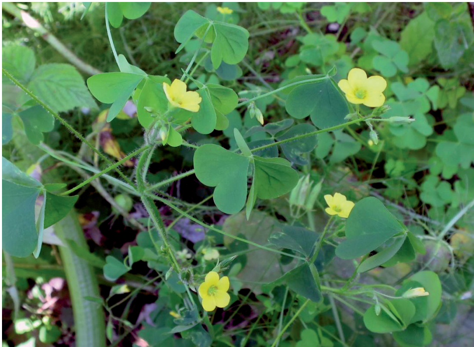
Dillenius' Hornklee – Marktoberdorf – Sept. 2021 – (Johann Bauer)

8229/23: Marktoberdorf, Unkraut im eigenen Garten (Ba 24.9.21)