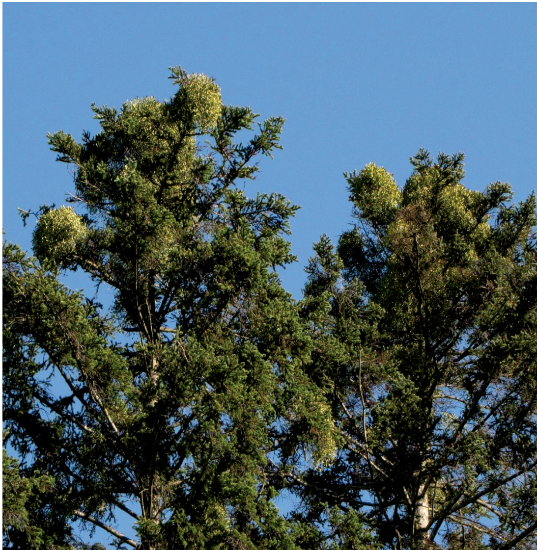
Tannen-Mistel – Rottachberg – 13.10.2018

Ho: 8229/42: Waldrand N Birngschwend (Sc 8.5.21)