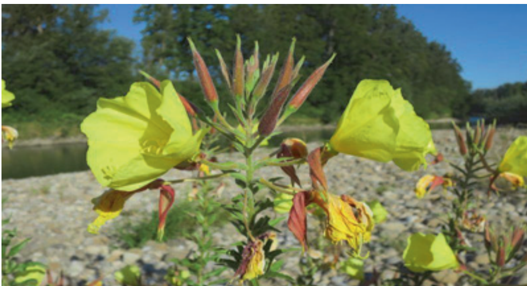
Rotkelch-Nachtkerze – Iller in Kempten – 19.7.22 – (Johann Bauer)

Ho: 8227/24: Kempten, Illeraue bei Unterwang, Kiesbank Nord-Brücke (Ba 19.7.22)