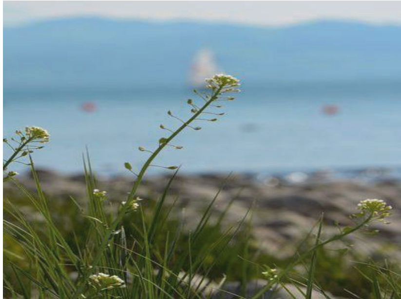
Lauch-Hellerkraut – Wasserburg – 12.5.21 – (R. Nowack)

Hbu-Bay: 8423/24: Wasserburg, Ufergeröll am Malerwinkel, 10 Ex. (No 12.5.21), Ausbreitung in 2022 und 2023 (am 4.5.23 80 -100 Ex.)