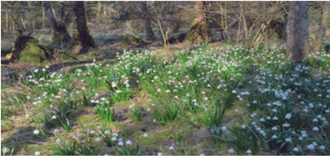
Märzenbecher ( L. vernalis ) – Schmutter – 26.3.22 – (Johann Bauer)