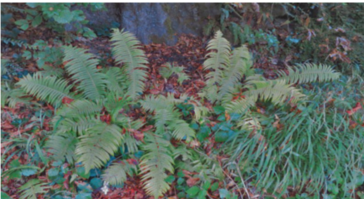
Straußfarn – Iller in Kempten – 19.7.22 – (Johann Bauer)

8227/44: Kempten, W Uferweg an der Iller zw. E-Werk und Wehr bei Kempten-Eich (Ba 21.7.22)