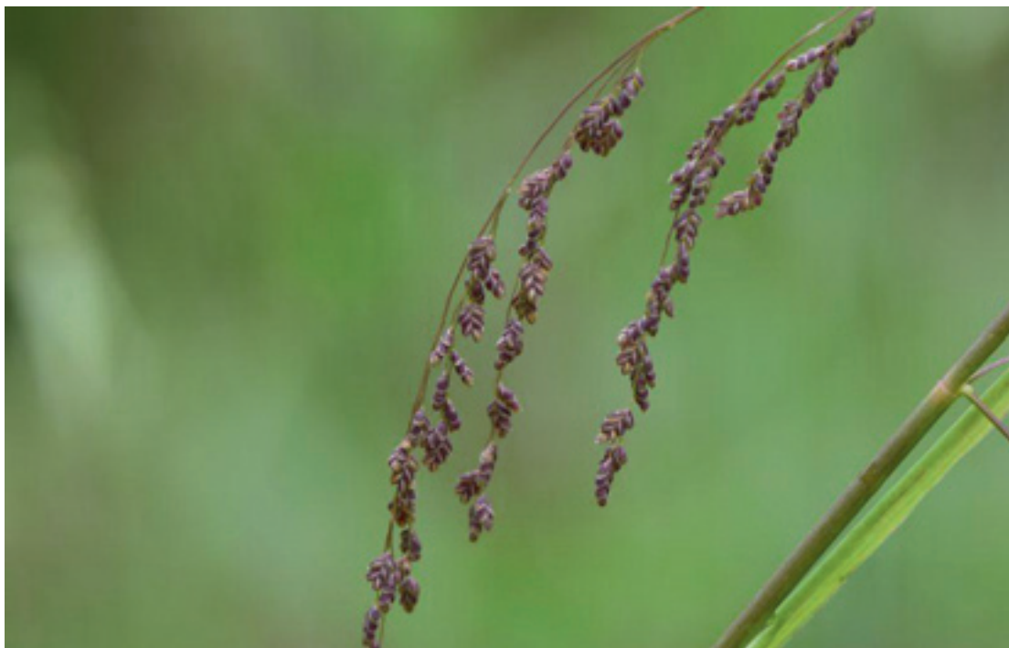
Gestreifter Schwaden ( Glyceria striata ) – Lindau – 13.6.22 – (Rainer Nowack)

Hbo-Bay: 8424/11: Lindau Ortsteil Oberreitnau an Waldwegen nahe NSG Spatzenwinkel, wirkt etabliert (No 13.6.21)