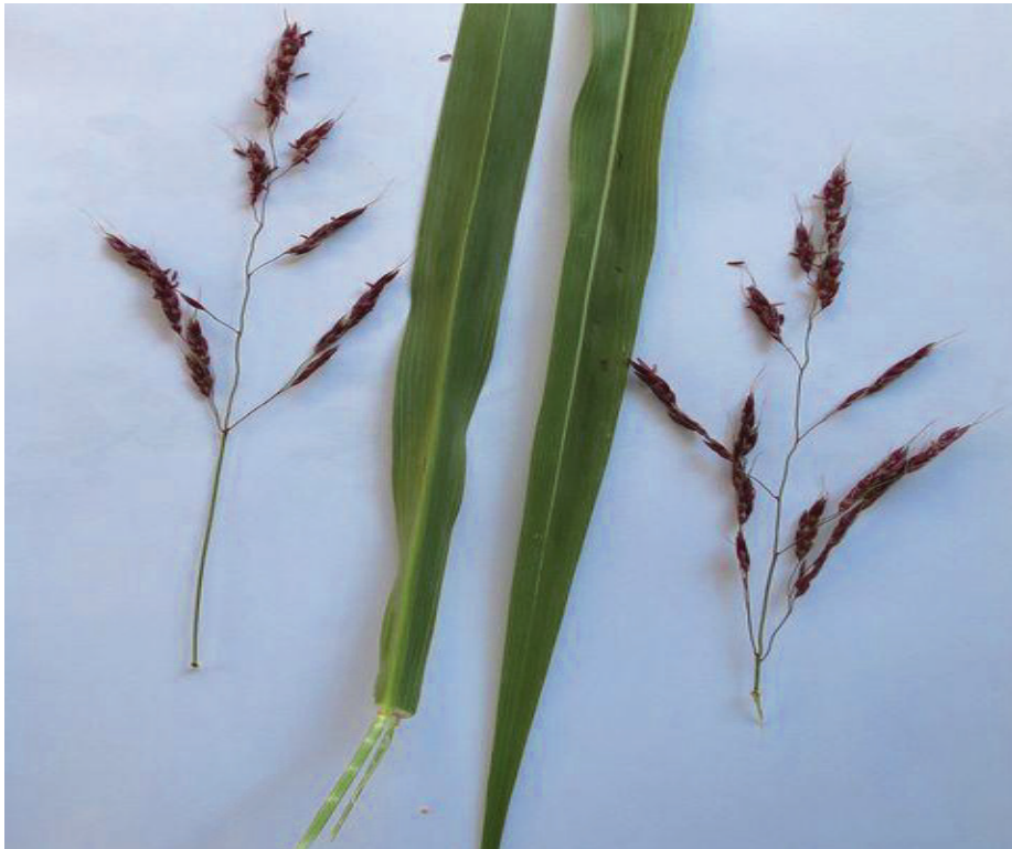
Wilde Mohrenhirse – Marktoberdorf – 26.8.22 – (Johann Bauer)

Ho: 8229/23: Marktoberdorf S, Grünstreifen neben Seeger Str. (Ba 26.8.22)