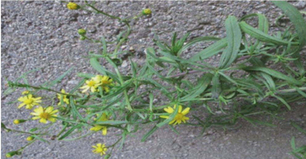
Schmalblättriges Greiskraut – Lenzfried – 4.10.22. – (Johann Bauer)

8330/34: S St. Urban bei Rieden, an B16 zahlreich (Ba 25.10.22)