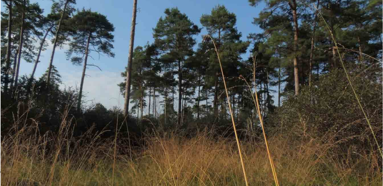
Die Forstheide bei Amstetten