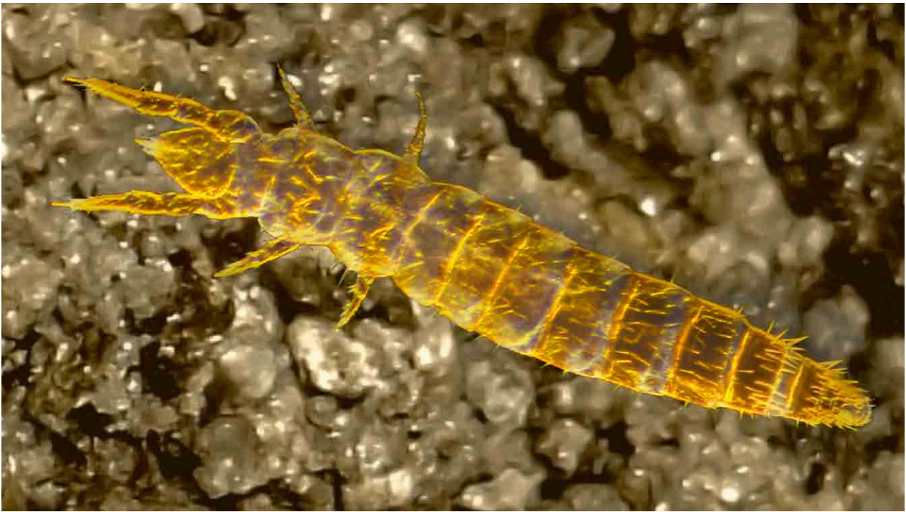
Beintastler sind Bodenschlängler: höchstens 2 mm lang, aber an ihrer einprägsamen Gestalt leicht zu erkennen.