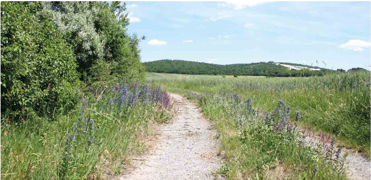
Kleinstrukturen mit hohem Blütenangebot in der Agrarlandschaft