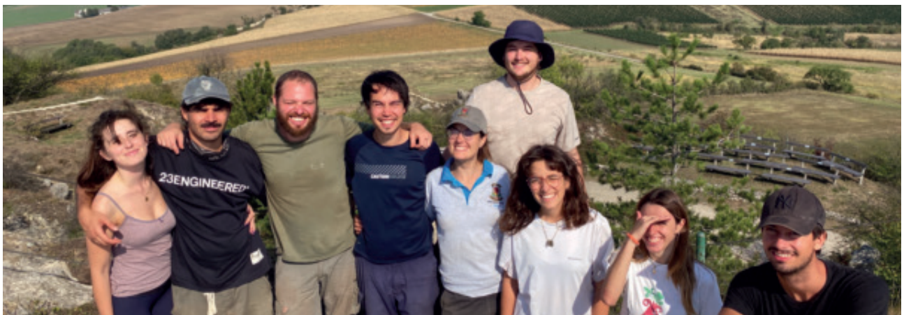
Die Teilnehmer*innen des Green Belt Camps 2024

Auch heuer findet wieder das inzwischen traditionelle Green Belt Camp im Weinviertel statt. Die Jugendlichen werden vom 05. bis zum 20. September 2025 zunächst in Hart-Aschendorf und dann in Poysdorf übernachten. Pflegemaßnahmen in insgesamt zehn Gebieten sind geplant, darunter am Bockstallberg, am Dernberg, in Staatz, in Falkenstein, Wildendürnbach und Kleinschweinbarth. Vielleicht kennen Sie in Ihrem Umfeld Jugendliche, die an einer Teilnahme interessiert sind? Sagen Sie es gerne weiter.