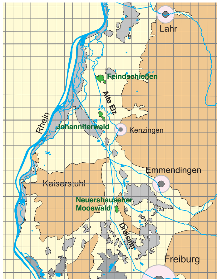
Abb. 1: Das Untersuchungsgebiet umfasst die Elzniederung entlang der Alten Elz bei Kenzingen mit den Wäldern Feindschießen und Johanniterwald sowie den Neuershausener Mooswald in der Dreisamniederung (grün). Andere Wälder: grau.

Der Neuershausener Mooswald bei Neuershausen FR ist seit 1979 Naturschutzgebiet und hat eine Fläche von 40 ha, das NSG mit einer angrenzenden Wiesenfläche weist eine Fläche von 48 ha auf. Er liegt auf einer Meereshöhe von ca. 188 m NN. Dieser Wald besteht aus einem Mosaik eines Traubenkirschen-Erlen-Eschen-Walds auf den feuchteren und eines Waldziest-Stieleichen-Hainbuchen-Walds mit eingestreuten Pappeln auf den trockeneren Standorten (HÜTTL 2004).