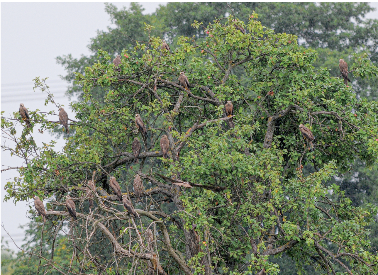
Abb. 4: Eine große Gruppe von Schwarzmilanen, darunter viele Diesjährige, am 10.07.2011 um die Mittagszeit im NSG „Elzwiesen“ während einer Sommerwässerung.