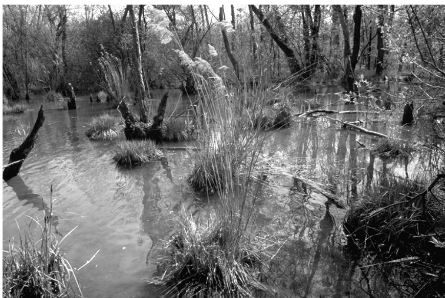
Abb. 2: Überstaute Weichholzaue des Bannwaldes Rheinwald Weisweil nach dem Hochwasser.

he betrug minimal 0,5 m bis zu 2,1 m mit teilweise sehr starken Strömungsgeschwindigkeiten. In tiefer liegenden Bereichen (ca. 40 % der Fläche) stand das Wasser anschließend noch bis zum 08.06. (Abb. 2). Dann wurden diese tiefer liegenden Bereiche von einer zweiten Hochwasserwelle nochmals aufgefüllt, bevor der Wasserstand kontinuierlich sank. Derartige Hochwasserereignisse treten seit dem modernen Rheinausbau (1960-1970 Fertigstellung der Kraftwerke zwischen Breisach und Straßburg) auf diesem Rheinabschnitt nur noch sehr selten auf. Das Hochwasser fand zur Hauptbrutzeit der meisten Vogelarten statt und fiel mitten in die Datenaufnahmen. Vor dem Hochwasser wurden sechs Morgen- und zwei Abendbegehungen durchgeführt, nach der ersten Hochwasserwelle weitere vier Morgenbegehungen und eine Abendbegehung.