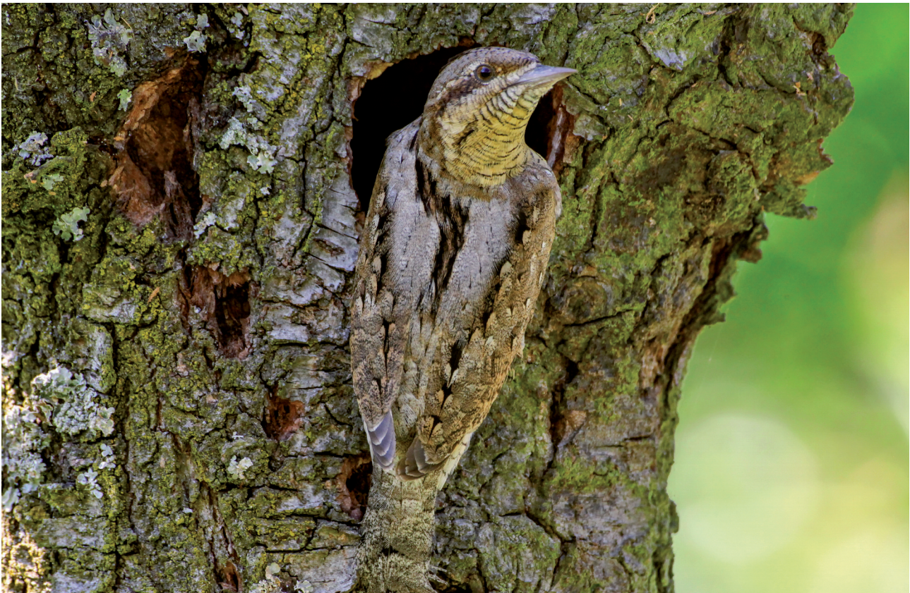
Abb. 2: Als einziger unter den heimischen Spechten ist der Wendehals ein Zugvogel, der sich nur von April bis September in den Brutgebieten Mitteleuropas aufhält, wo er in einer, seltener auch in zwei Jahresbruten seine Jungen aufzieht.