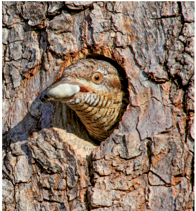
Abb. 5, 6: Das Gelege besteht in der Regel aus 7-11 beige-weißen, matt glänzenden Eiern. Nistmaterial wird nicht eingetragen; die hier sichtbare Moosunterlage stammt von einem früheren Nutzer der Bruthöhle. Der Kottaustrag aus der Bruthöhle ist ein untrügliches Zeichen, dass die Jungen geschlüpft sind.