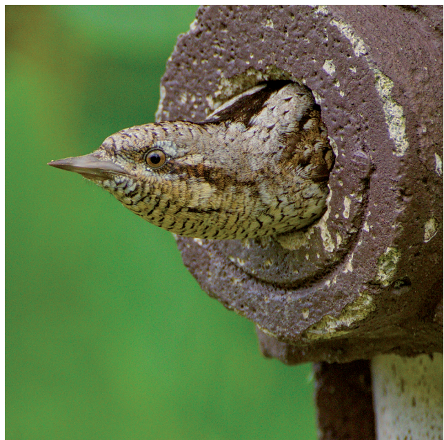
Abb. 3, 4: Wendehälse können als einzige der heimischen Spechte ihre Bruthöhle nicht selbst zimmern. Sie sind auf vorhandene Höhlungen angewiesen. Deshalb zählen alte Obstgärten zu ihren bevorzugten Brutbiotopen. Auch Nistkästen werden gern angenommen. Das im April zuerst eintreffende Männchen inspiziert alle potentiellen Bruthöhlen des gewählten Reviers. Dabei werden Späne, Holzmehl und gelegentlich auch bereits begonnene Bruten anderer kleiner Höhlenbrüter (Eier, Küken und Nistmaterial) „ausgeräumt“.