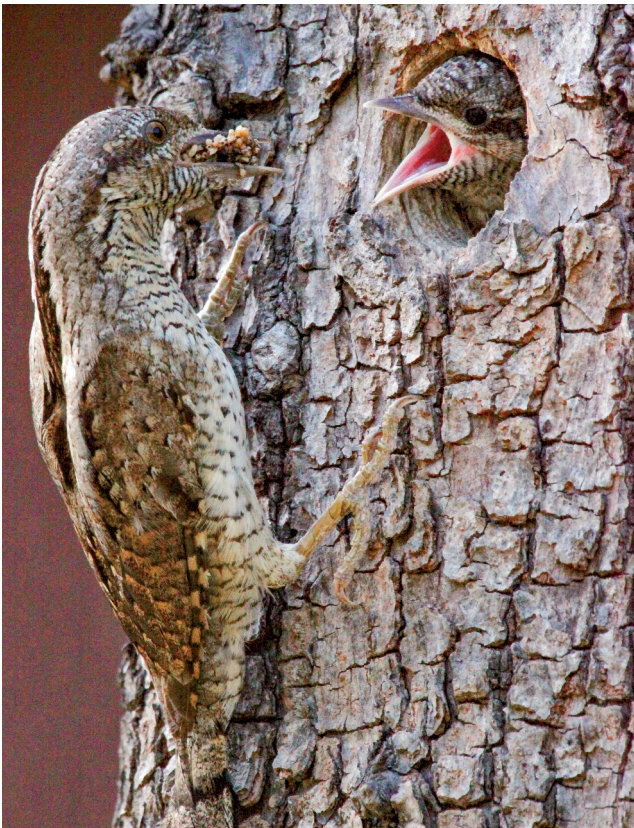
Abb. 9: Der Wendehals ernährt sich fast ausschließlich von Ameisenlarven, die er aus Bodennestern ausgräbt und in großer Zahl an seine Jungen verfüttert.