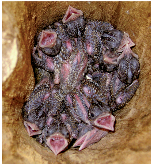
Abb. 7, 8: Nackt und blind schlüpfen die Jungen nach einer Brutdauer von 12-14 Tagen. Die auffällige Pigmentierung der Haut nimmt Muster der späteren Befiederung vorweg. Nach wenigen Tagen bereits entwickelt sich das Federkleid der jungen Wendehäule und die Augen öffnen sich.