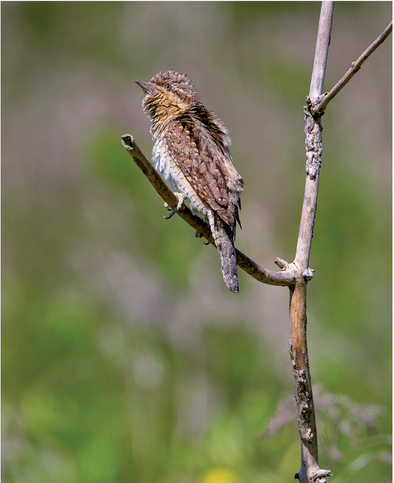
Abb. 1: Der Wendehals nimmt eine Sonderstellung unter den Spechten Mitteleuropas ein. Sein detailreiches Tarngefieder unterscheidet ihn von allen anderen Spechtarten des Verbreitungsgebietes.