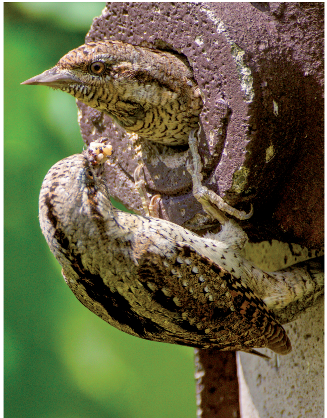
Abb. 10: Im äußeren Erscheinungsbild sind Männchen und Weibchen nicht zu unterscheiden. Beide Eltern beteiligen sich an der Fütterung der Jungen.