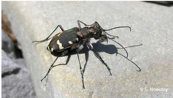
Sandlaufkäfer erbeuten mit ihren kräftigen Kiefern Insekten und Spinnen auf den Schotterbänken.