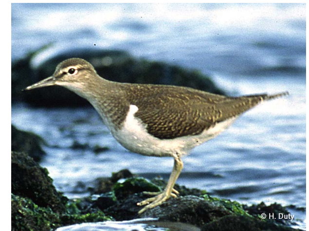
Für Flussuferläufer dürfen die Schotterbänke auch etwas bewachsen sein.

Bitte halten Sie sich im gekennzeichneten Bereich an dieses befristete Betretungsverbot der Schotterflächen vom 1. April bis 31. Juli. Es wird von der Salzburger Berg- und Naturwacht überwacht!