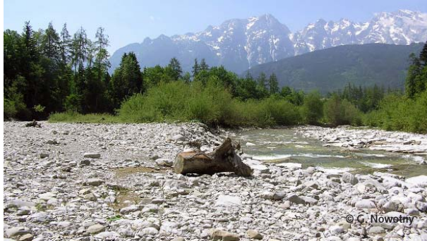
Schotterbänke mit krautigem Bewuchs oder mit Lavendelweidengebüsch zählen zu den europaweit bedeutsamen Lebensräumen des Tauglgries.