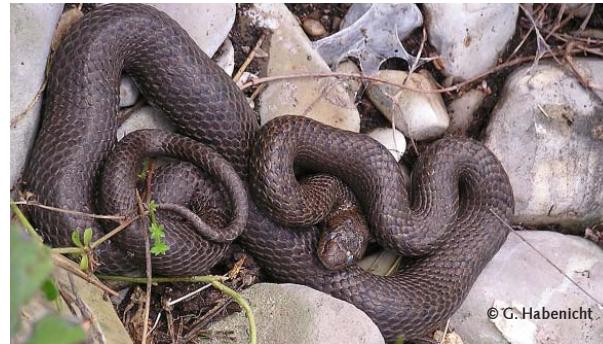
Die ungiftige, wärmeliebende Schlingnatter wird wegen ihrer Rückenzeichnung oft mit der Kreuzotter verwechselt.