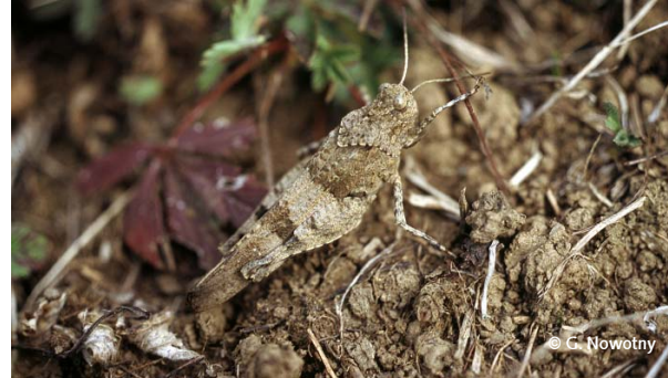
Die bestens getarnte Blauflügelige Ödlandschrecke zeigt nur bei ihren kurzen Flügen ihre namensgebenden Flügel. Sie braucht völlig offene Rohbodenbereiche.