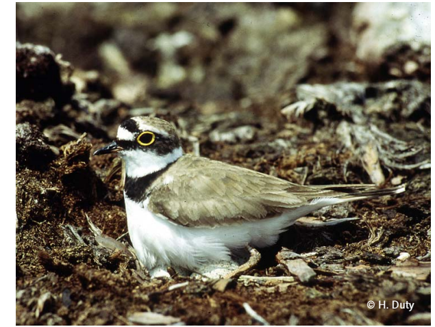
Flussregenpfeifer brüten auf ausgedehnten, offenen Schotterflächen.

Bitte halten Sie sich im gekennzeichneten Bereich an dieses befristete Betretungsverbot der Schotterflächen vom 1. April bis 31. Juli. Es wird von der Salzburger Berg- und Naturwacht überwacht!