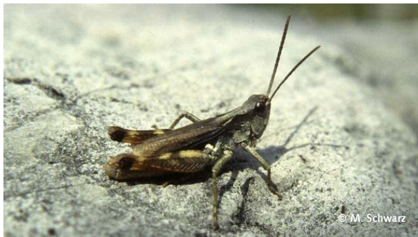
Der Kiesbankgrashüpfer kommt wie die Blauflügelige Ödlandschrecke in Salzburg nur im ESG Tauglgries vor und besiedelt wenig bewachsene Rohbodenstandorte.