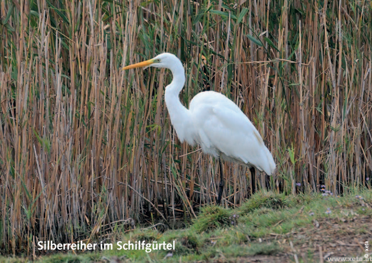
Silberreiher im Schilfgürtel