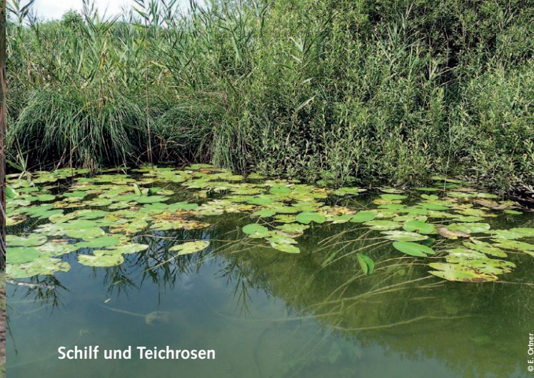
Schilf und Teichrosen