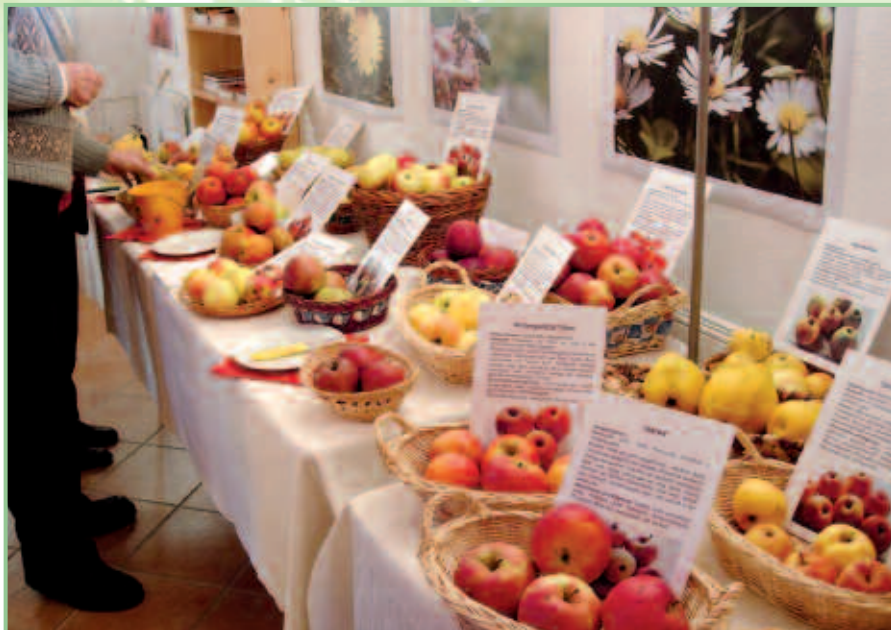
Die Obstsortenausstellung bietet eine Vielfalt an Formen und Geschmäckern.

und Titel der Referate steht unter www.arge-streuobst.at zum Download zur Verfügung.