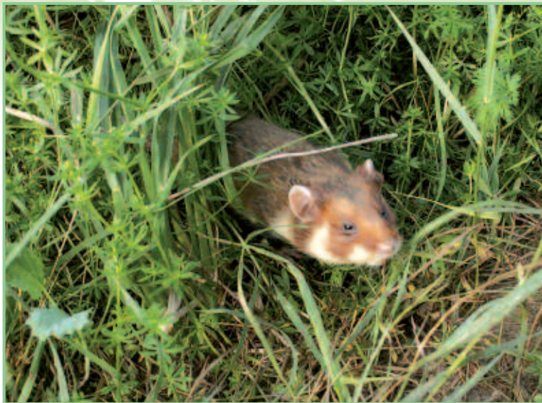
Hamstersichtungen sollten bitte gemeldet werden.