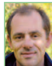
Autor und Foto: Mag. Manfred Fiala, Bezirksgruppenleiter Oberpullendorf des Naturschutzbundes Burgenland

Mag. Manfred Fiala (ÖNB) 0676-95 33 337, Albert Kriegler (VÖAV) 0664-38 43 932 bzw. im Internet unter www.naturschutzbund-burgenland.at