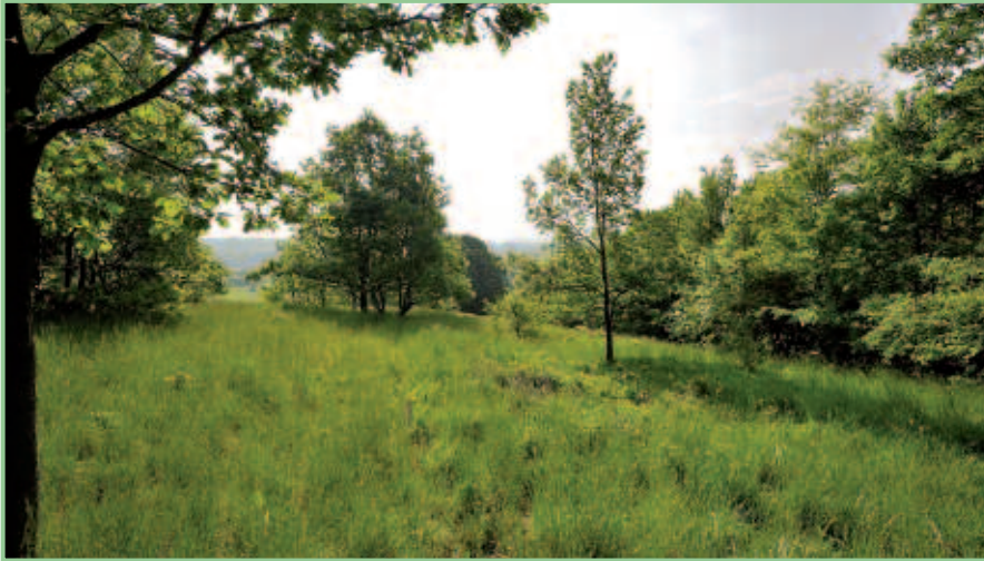
Eisenstadt/St. Georgen - Schauerkreuz

rasen als Reste großflächiger Hutweiden. Das gesamte Gebiet stellt den Ausschnitt einer typischen pannonischen Kulturlandschaft dar. Hutweide, Steinbruch, Mähwiese, Hohlweg, einige Obstbäume und alte Weideeichen sind als Reste der vielfältigen Landschaft erhalten geblieben. Nach der Nutzungsaufgabe kam es zur Ausbreitung der Waldflächen und folglich ging auch ein Teil der regionalen Merkmale verloren.