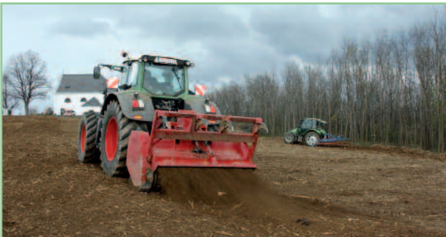
Erweiterung des Trockenbiotops in Rechnitz