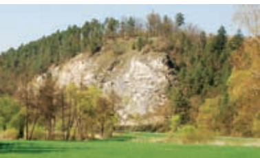
Die Julienhöhe, ein beliebter Aussichtspunkt mit einem artenreichen Trockenrasen.

Trockenrasen sind von Natur aus gehölzfrei und kommen vorwiegend im trocken-warmen Osten Österreichs, dem so genannten Pannonikum, vor. Charakteristisch für Trockenrasen ist die Vielfalt an speziell angepassten Pflanzen und Tieren, unter denen auch viele seltene und gefährdete Arten sind.