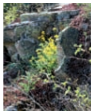
Blühendes Felsensteinkraut auf der Julienhöhe

Eine Besonderheit auf der Julienhöhe ist der säulenförmig wachsende Gemeine Wachholder. Er ist ein typischer Weidezeiger, der vom Vieh gemieden wird. So ist er vermutlich Zeuge einer längst eingestellten Beweidung der Hänge und Wälder rund um Drosendorf.