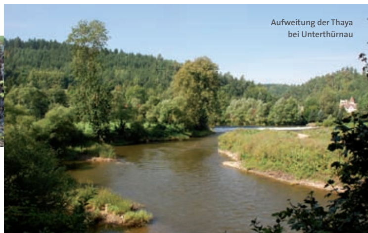
Aufweitung der Thaya bei Unterthürnau

sterben bedroht. Flussmuscheln reagieren sehr empfindlich auf Gewässerverschmutzung. Die erwachsenen Tiere brauchen strukturierte, mit Wurzeln durchwachsene Ufer, Jungmuscheln sind auf sandig-kiesiges Substrat angewiesen. Aus dem Laich der Muscheln schlüpfen so genannte Glochidien, die sich an den Kiemen geeigneter Wirtsfische anheften und sich so an einen neuen Ort transportieren lassen. Nach einer Woche platzen die Zysten auf und die Jungmuscheln sinken auf den Gewässergrund.