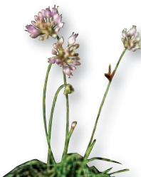
Der Berglauch wächst auf sehr flachgründigen, felsigen Stellen und gilt im Waldviertel als gefährdet.

Der rosa blühende Berglauch wächst im Anschluss an die Felsen. Das Felsensteinkraut, ein gelber Kreuzblütler, ist ein richtiger Felsbewohner. Es hat auf der Stadtmauer von Drosendorf eine zweite Heimat gefunden.