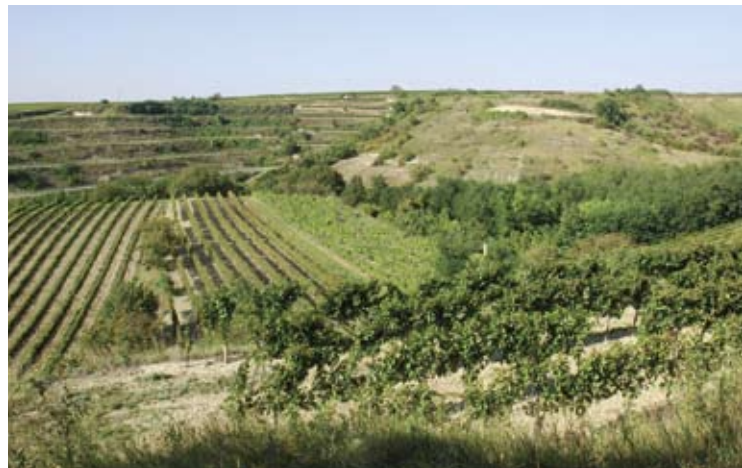
Die reich strukturierte Kulturlandschaft um Haugsdorf ist ein wichtiger Lebensraum für den Steinkauz.

Durch ein spezielles Artenschutzprogramm versucht die Naturschutzabteilung des Landes Niederösterreich das Überleben des Steinkauzes zu sichern: So wird etwa im Raum Retzbach und im Pulkautal die Anlage von Brachen mit Obstbäumen gefördert. Gestaffelte Pflegetermine sollen gewährleisten, dass stets auch kurzrasige Bereiche vorhanden sind, wo der Steinkauz leicht diverse Kleintiere erbeuten kann.