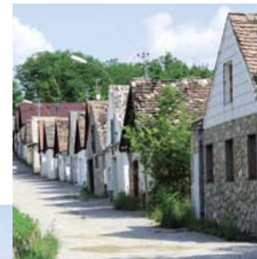
Charakteristische Kellergasse in Haugsdorf.

Wegbeschreibung: Vom Bahnhof Retz führt die Radroute über den historischen Retzer Hauptplatz durch das Verderberhaus über die Windmühlgasse steil zur Retzer Windmühle mit den umgebenden Trockenrasen hinauf. Von dort genießen wir den Ausblick auf Retz und die Weinbaulandschaft und folgen dem Weg weiter nach Osten Richtung Hofern. Nach ca. 200 m biegen wir auf einer kleinen Trockenrasenkuppe nach rechts in einen asphaltierten Weg Richtung Altstadt ab, der hinunter ins Tal führt. Achtung: ein Teilstück ist sehr grob gepflastert!