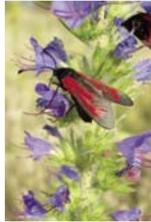
Ein Widderchen labt sich an den Blüten des Natternkopfs.

Wegränder sind in der Kulturlandschaft oft die einzigen Rückzugsräume für Wildpflanzen und Tiere. Diese Flächen werden nicht oder kaum mit Pestiziden behandelt und nur selten gemäht. So gedeihen hier unzählige bunte Blumen, wie Klatschmohn, Ruchlose Kamille, Hainsalbei, Königskerzen und Natternkopf.