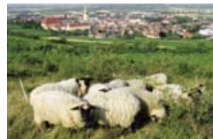
Durch die Beweidung werden die Trockenrasen offen gehalten.

Doch gerade die wertvollen Trockenrasen, die heute ohnehin nur kleine Reste der einstigen Flächen darstellen, sind stark bedroht: Durch das Fehlen einer bäuerlichen Nutzung dringen hochwüchsige Gräser und Sträucher ein und verdrängen die kleinwüchsigen