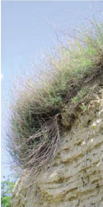
Die Halbstrauch-Radmelde wächst auf den Kellerportalen der Retzbacher Kellergasse und auf Böschungen bei Haugsdorf.

Auf den äußerst trockenen, südexponierten Steilböschungen wächst die Halbstrauch-Radmelde, eine in Österreich sehr seltene, stark gefährdete Pflanze. Der graugrüne Halbstrauch blüht unauffällig, interessant ist jedoch sein Verbreitungsgebiet: Die aus der asiatischen Steppe stammende Pflanze wird in den Steppengebieten Amerikas als Futterpflanze für das Vieh angebaut. Bei den österreichischen Vorkommen, die sich auf die Umgebung von Retz und Haugsdorf beschränken, handelt es sich vermutlich um Relikte der eiszeitlichen Kältesteppen. Die lichtliebende Pflanze reagiert empfindlich auf Beschattung. Vor allem die Überwucherung mit Bocksdorn oder Robinien wird rasch zu einer Bedrohung.